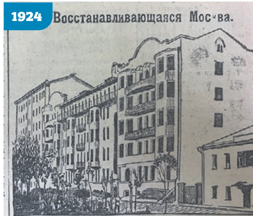
1924 Восстанавливающаяся Москва.