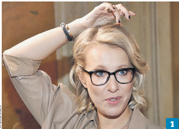
Собчак (1) одна из первых выпустила первую книгу в 2008 году, Бузова (2) решила не отставать от нее. Правда, шедевров у обеих так и не получилось

■ В нашем шоу-бизнесе с каждым годом все больше звезд решаются на написание книг. Они делятся советами, как стать успешными и такими же прекрасными. Но пользуются ли их произведениям спросом?