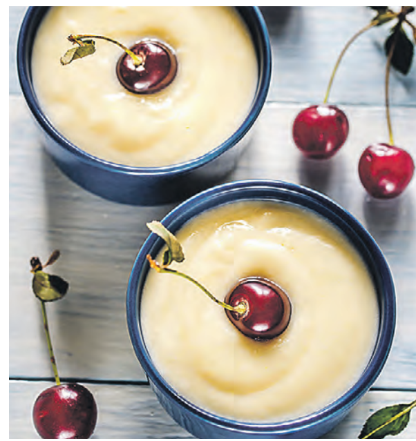
Гости мастер-класса научатся готовить сабайон — традиционный итальянский кремовый десерт

ковом сборе в 250 рублей. Вход на мастер-класс платный, нужна предварительная регистрация. Желающих принять участие в мастер-классе ждут по адресу: улица 1905 года, 10, строение 1.