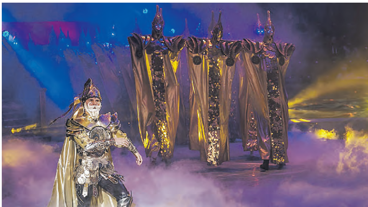
21 декабря 2021 года. Постановка «Вероятно невероятная сказка» на манеже Большого Московского цирка. Зрителей ждет завораживающее шоу с участием акробатов, эквилибристов, иллюзионистов и дрессировщиков

■ Большой Московский государственный цирк готов удивлять детей и взрослых своим новым шоу — «Вероятно невероятная сказка». Посмотреть его можно до конца января.