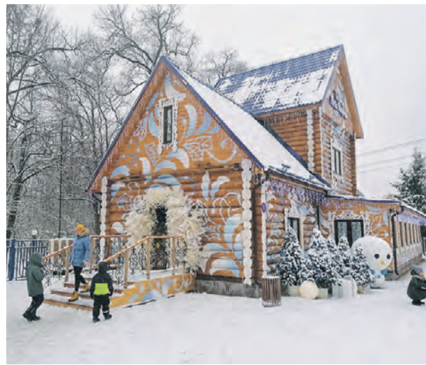
5 декабря 2021 года. Московская усадьба Деда Мороза в музее-заповеднике «Кузьминки-Люблино»