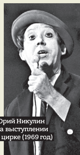
Юрий Никулин на выступлении в цирке (1969 год)

Завтра исполнится ровно 100 лет со дня рождения легендарного артиста и клоуна Юрия Никулина. В честь этого в Московском цирке на Цветном бульваре стартовали праздничные мероприятия для зрителей. А «Вечерка» вспомнила главные роли артиста и фильмы, которые точно стоит пересмотреть в канун Нового года с. 8