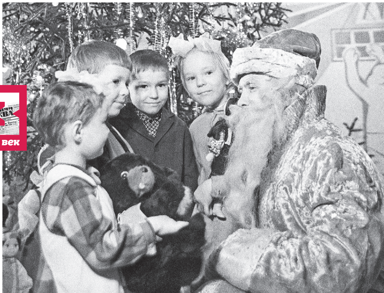
1970 год. Воспитанники столичного детского сада во время новогоднего утренника с Дедом Морозом

гать на детских утренниках, в школах и садиках бенгальские свечи.