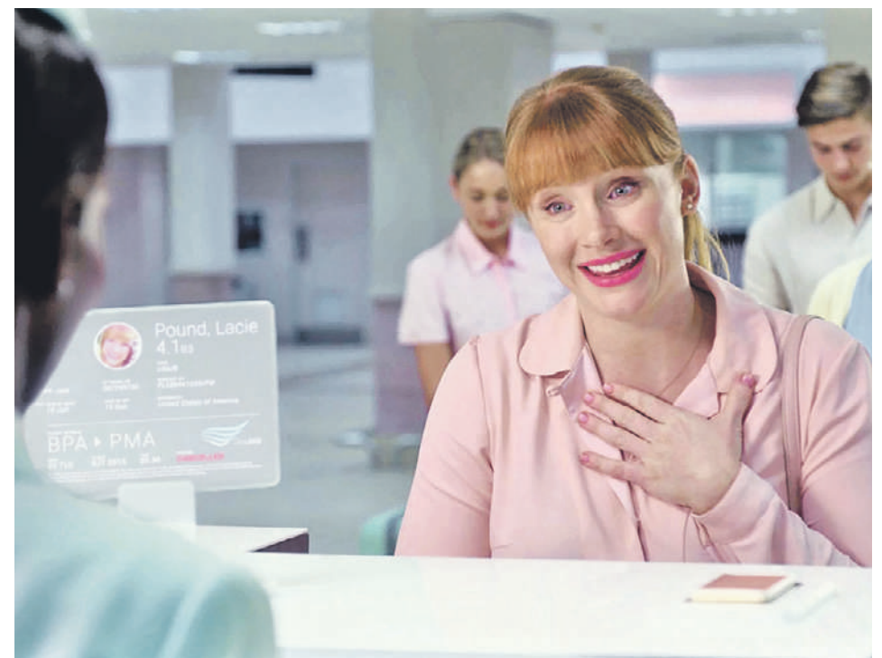
Кадр из эпизода «Под откос» (2016) сериала «Черное зеркало»: героине Лейси в исполнении Брайса Далласа Ховарда отказывают в покупке билета из-за низкого рейтинга

Как сбывались сюжеты из сериала «Черное зеркало»