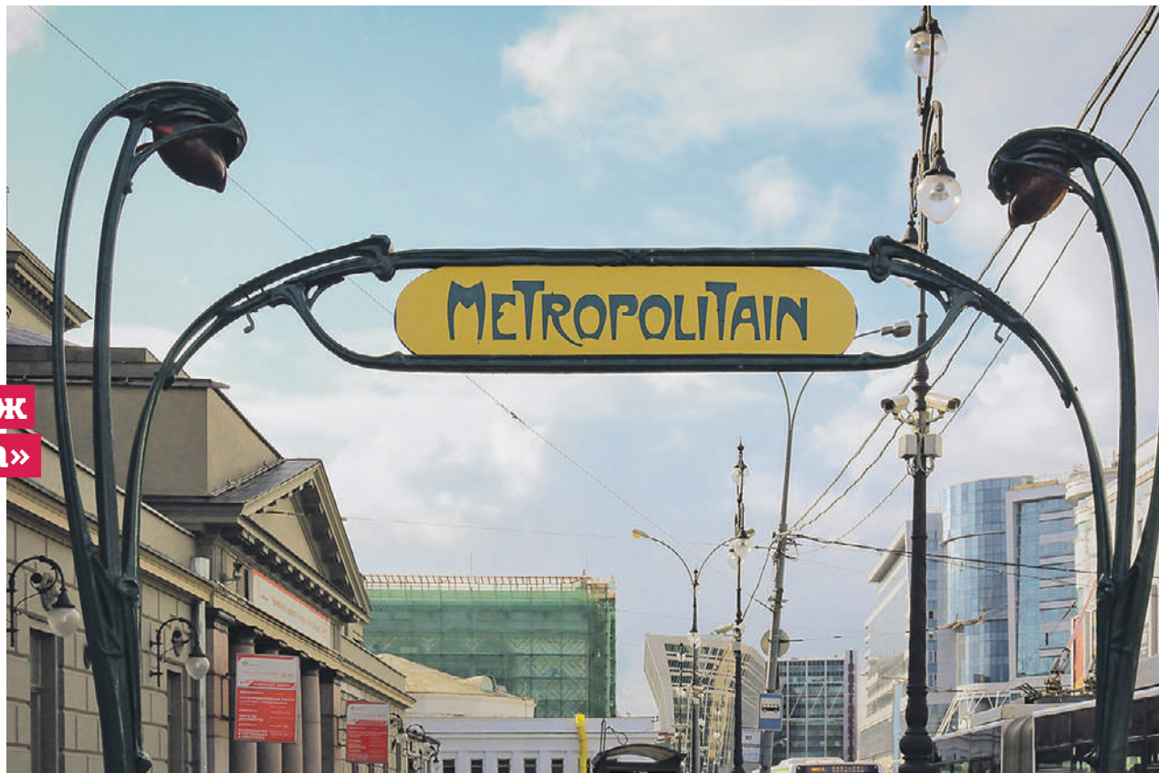
Арку, установленную в 2006 году на станции метро «Киевская», вернут после завершения благоустройства

Современный символ подземки убрали на время ремонтных работ