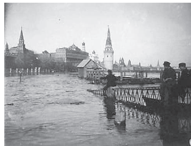
1908 год. Красная площадь: самое большое наводнение в истории Москвы