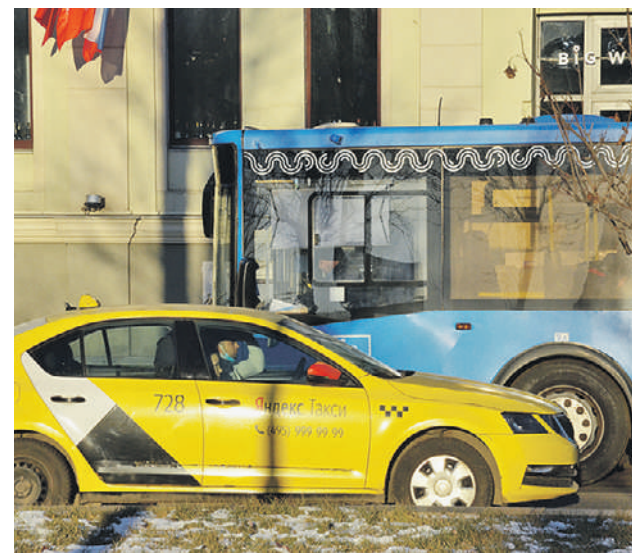
Вся транспортная сеть столицы в будущем будет отображаться в новом приложении Делтранса