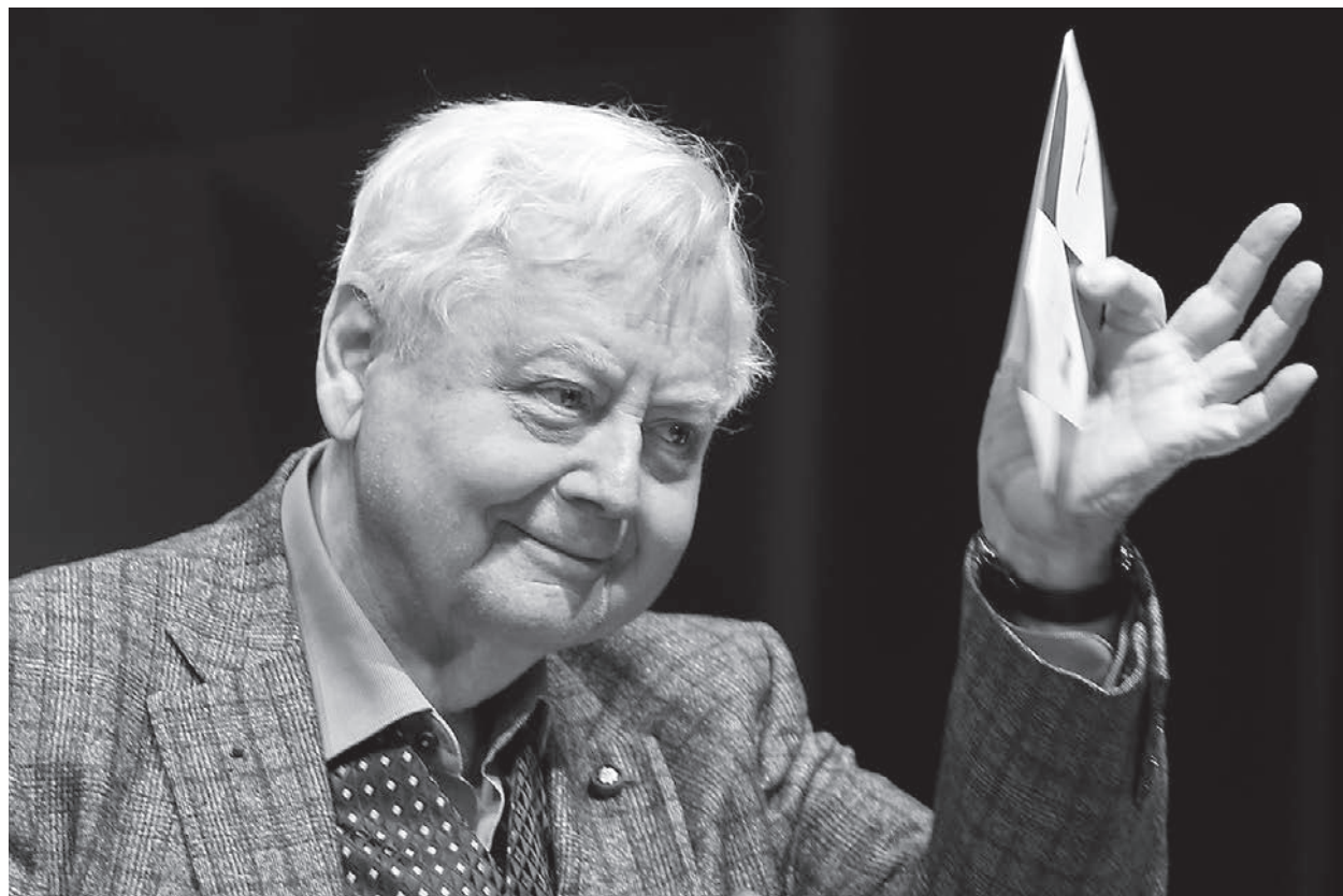
24 марта 2016 года, Москва, «Табакерка». Художественный руководитель МХТ им. А. П. Чехова и театра «Табакерка» Олег Табаков во время церемонии вручения премии, носящей его имя (имени Олега Табакова)

17 августа Олегу Табакову исполнилось бы 85 лет