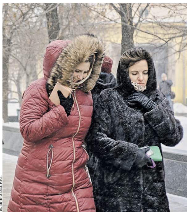
17 января 2019 года. Ненастная погода доставляет беспокойство не только метеозависимым

по дороге в Россию циклон ослабел. Тем не менее он полностью не растерял свой разрушительный потенциал — в штормовой зоне будет находиться значительная часть Европейской России.