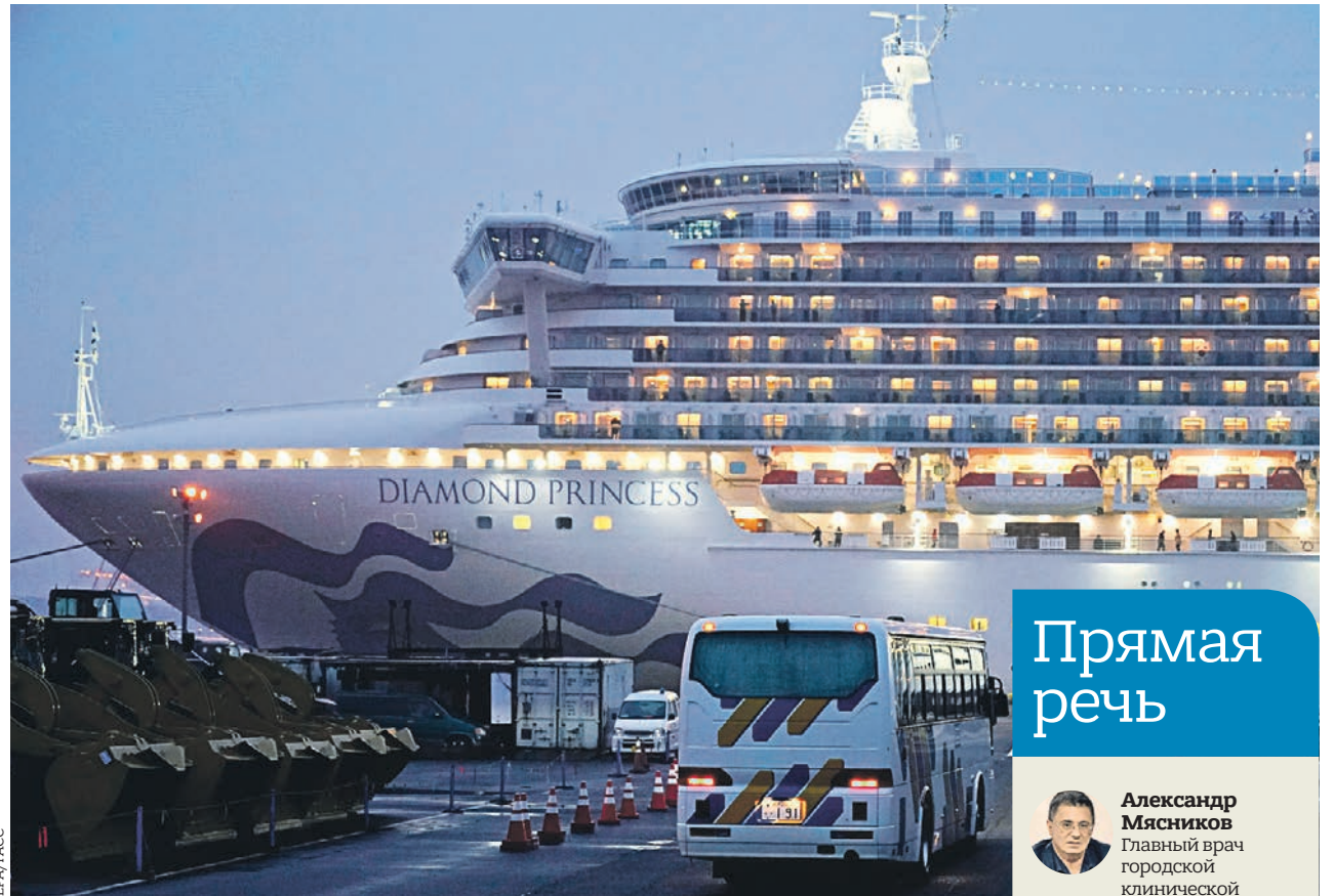
16 февраля 2020 года. Число заразившихся коронавирусом COVID-19 на борту круизного судна Diamond Princess в Японии достигло 454 человек

■ Одна из россиянок, находящаяся на круизном лайнере Diamond Princess, который в настоящий момент стоит на карантине у японского города Иокогама, заразилась коронавирусом. Об этом в понедельник, 17 февраля, сообщили в Японии.