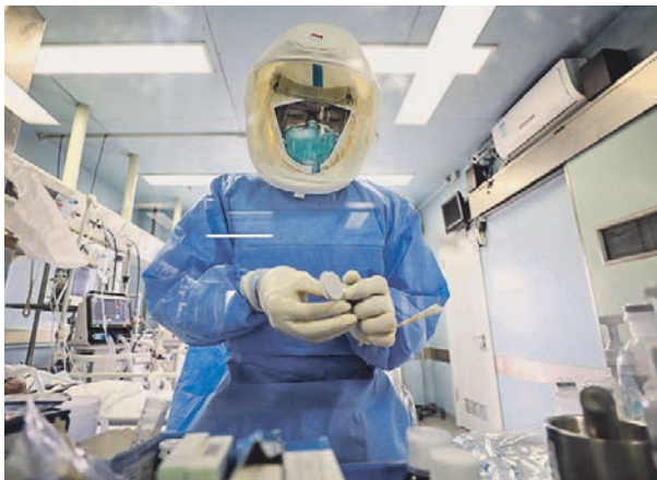
13 февраля 2020 года. Лечение зараженных коронавирусом пациентов в больнице в Ухане

морепродуктов, что заражение произошло, когда одна из инфицированных летучих мышей напала на сотрудника лаборатории и поранила его. А также, что именно летучие мыши стали источником эпидемии атипичной пневмонии в 2002–2003 годах. Ученые призвали повысить уровень безопасности время исследований в научных лабораториях.