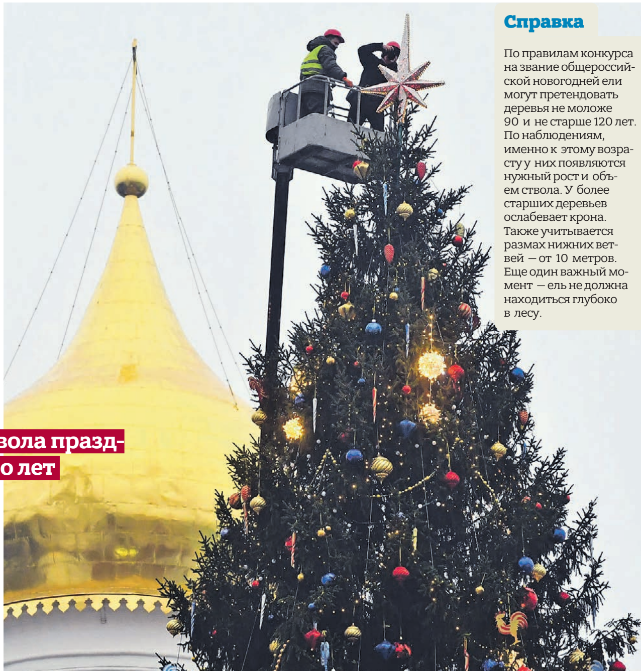
23 декабря 2019 года. Главную елку страны на Соборной площади украсили новогодними игрушками и гирляндами

Украшения для символа праздника собирали много лет