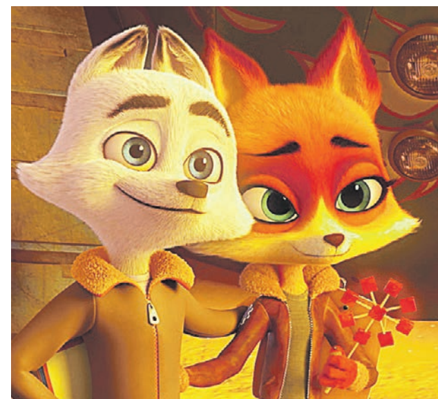
Кадр из мультфильма «Стражи Арктики», отличившегося неудачным дубляжом