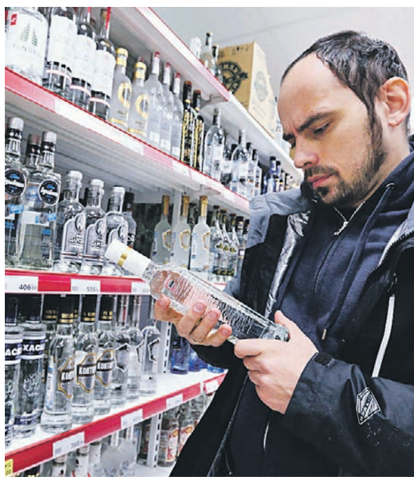
23 января 2019 года. Контрольная закупка алкоголя в одном из магазинов столицы