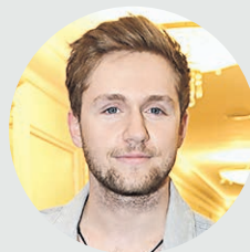
Влад Соколовский Певец

Я живу недалеко от Фрунзенской набережной и много времени провожу там. По выходным стараюсь бегать по утрам, кататься на велосипеде да и больше гулять.