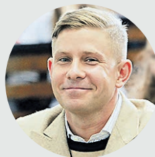
Митя Фомин Певец

Я живу недалеко от Фрунзенской набережной и много времени провожу там. По выходным стараюсь бегать по утрам, кататься на велосипеде да и больше гулять.