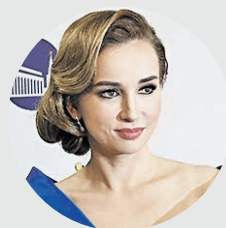
Анфиса Чехова Телеведущая

Выходные я обычно провожу на занятиях спортом. Хожу в тренажерный зал один и уже там встречаю с друзьями. Вот так и проходит день.