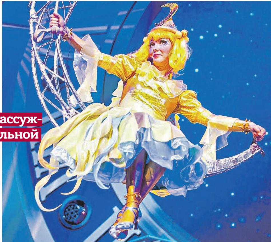
В прошлом году маленьким зрителям рассказали о семи чудесах Москвы. На фото — одна из героинь шоу 2017 года Звездочка