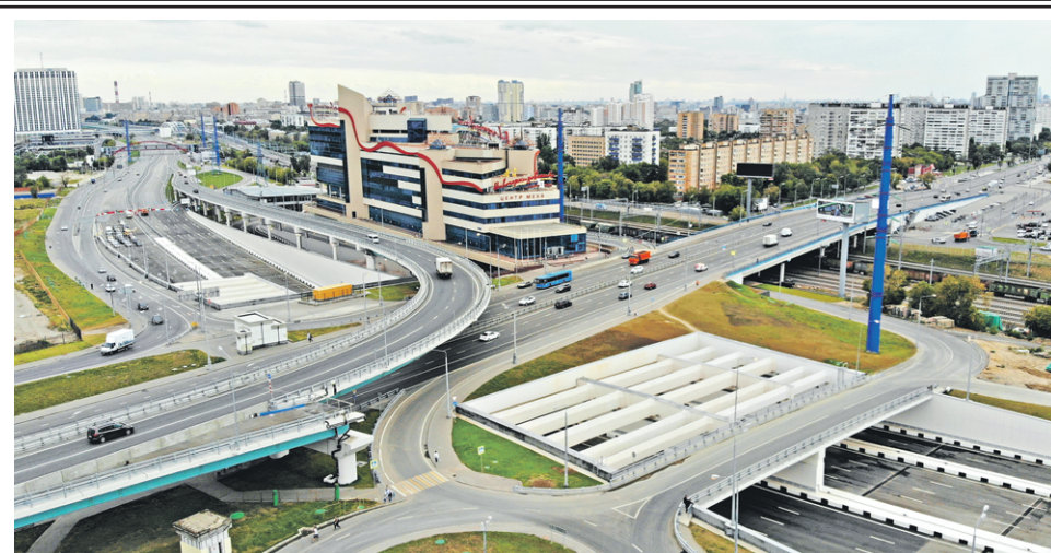
20 августа 2018 года. Открытие участка Северо-Восточной хорды

— В настоящее время усилия стоит сосредоточить на снижении числа транзитного транспорта в городе, а также необходимо вводить новые системы навигации, — отметил Питер-Ральф Шефер. — Помимо этого, следует продолжить популяризовать столичное метро — иногда городскую подземку недооценивают, хотя это один из самых выгодных и быстрых способов передвижения.