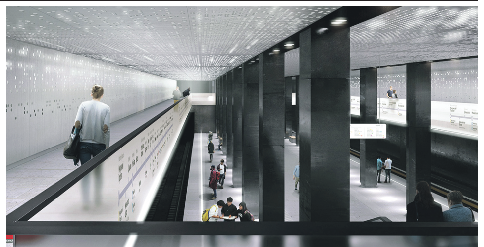
Проект станции «Стромынка» Большого кольца метро, предложенный Башкаевым

— Все проекты предусматривают соблюдение баланса, главное в них — не лишить московское метро уникального образа, — заключил он.