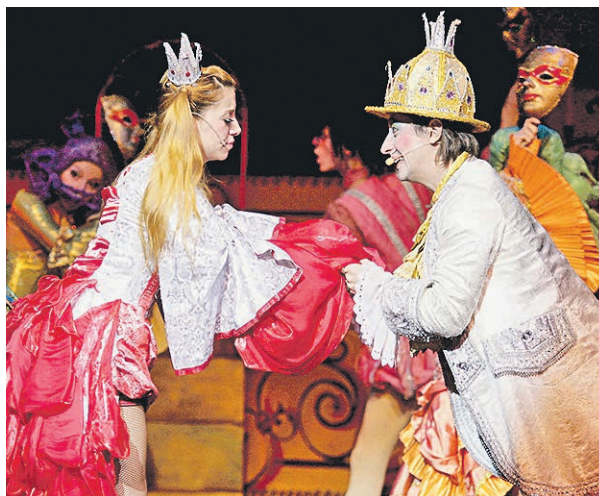
Сцена из семейного спектакля «Бременские музыканты»