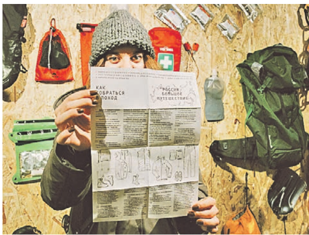
29 ноября 2018 года. Часть выставки — стена с вещами типичного путешественника