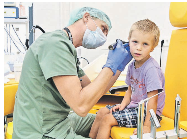
17 сентября 2018 года. Юный пациент на приеме у отоларинголога в Морозовской детской больнице