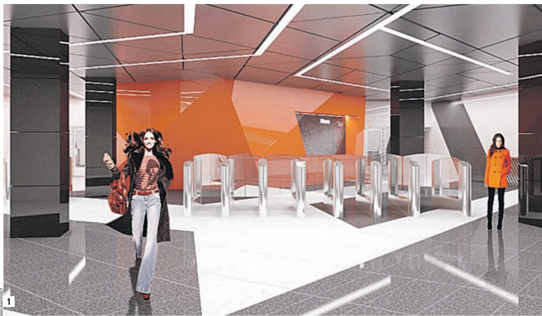
Проект платформенного участка станции «Столбово», которая появится на Сокольнической ветке метро. Станция станет конечной на красной линии (1) Проект двухэтажного вестибюля еще одной будущей станции на территории Новой Москвы с рабочим названием «Филатов луг» (2)

РАЗВИТИЕ Вчера в распоряжении «ВМ» оказались проекты новых станций Сокольнической линии метро. Столичными властями принято решение о продлении ветки, с которой началась история московской подземки. Продолжать ее будут на присоединенных территориях — от Саларьева до Коммунарки. Новый участок метро пройдет параллельно строящейся трассе Солнцево-Бутово-Видное.