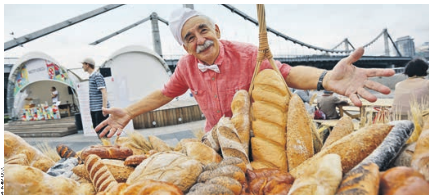
16 августа 2014 года. Фестиваль хлеба в парке «Музеон». Большинство участников — небольшие хлебопекарни Москвы

Корпорацией МСП совместно с Банком России, — эффективный инструмент государственной поддержки компаний, реализующих инвестиционные проекты в приоритетных отраслях экономики. — Чаще всего к нам обращаются компании, занимающиеся сельским хозяйством, производством продуктов питания, машин и оборудования, а также минеральных удобрений, — рассказали «Вечерней Москве» в банке ВТБ. — Также к нам могут обращаться мелкие и средние компании, развивающие туристическую отрасль России, а также фирмы, занимающиеся научными разработками.