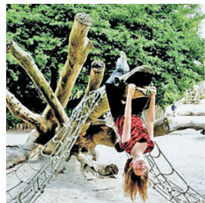
Визуализация проекта одного из элементов будущей площадки в Измайловском парке, который называется «Дерево перевернутое»

щадку монтируют, зона открыта уже в сентябре. Одно из преимуществ новой игровой зоны в том, что там интересно смогут провести время и взрослые. Необычные объекты «гнезда» — большое и маленькое — впечатлят горожан. Первое похоже на деревянный дом с открытой площадкой наверху и вязаным «полом». Второе представляет собой дом-беседку, в который можно залезть, словно в кресло-качалку. Пенсионерам и молодым мамам понравятся скамьи-брусья — аскетичные и невысокие. Они будут находиться рядом с игровыми зонами. Для малышей архитекторы тоже подготовили оригинальные лавочки — бревна с корой и без коры. На них можно не только сидеть, но и играть.