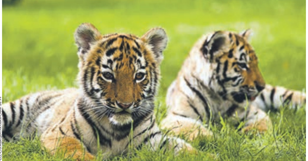
Амурский тигр — один из пяти видов тигров, сохранившихся на планете. Обитает в основном на Дальнем Востоке

В конце июля в Москве, как и во всем мире, широко отмечают Международный день тигра. В преддверии праздника «ВМ» начинает серию публикаций, посвященных спасению этого уникального животного. Кстати, помочь сохранить его может каждый. Центр «Амурский тигр» и Россельхозбанк третий год подряд реализуют уникальную благотворительную программу — «Их судьба в наших руках». В рамках программы выпускаются специальные дебетовые и кредитные карты «Амурский тигр». При их использовании Россельхозбанк перечисляет часть своей прибыли на меры по спасению и сохранению одного из самых редких и красивых хищников.