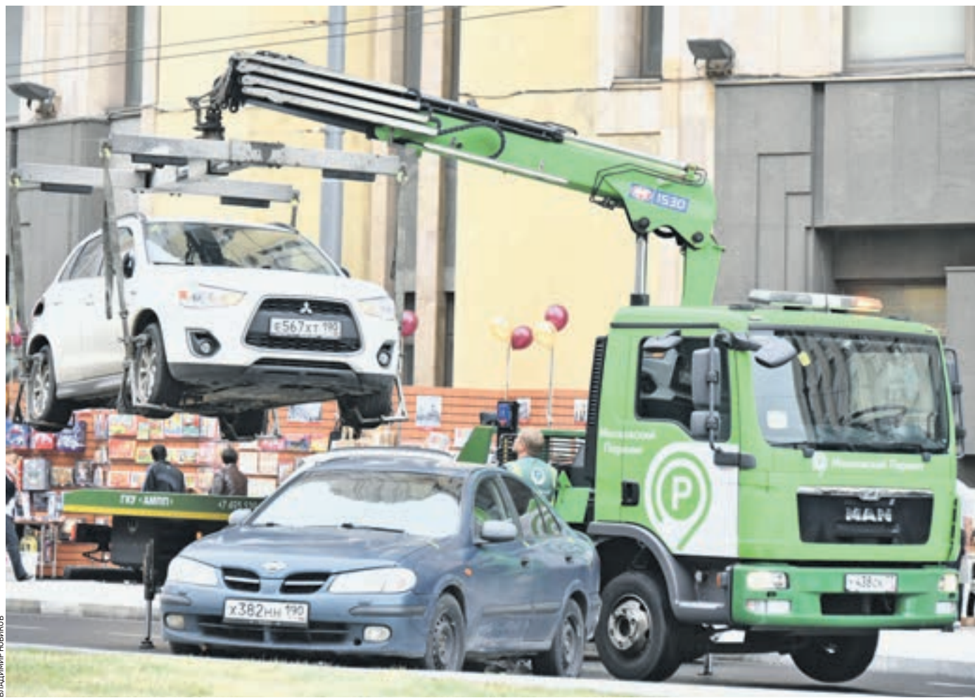
2 сентября 2015 года 10:31 Эвакуатор забирает с Мясницкой улицы автомобили, припаркованные в неполюженном месте. За транспортировку и хранение машин на штрафстоянке взимается плата. Скоро ее можно будет погасить уже после возвращения авто

Инициативой пересмотреть законодательство, которое регулирует порядок возвращения автовладельцам эвакуированных авто, выступила партия «Единая Россия». Благодаря этой инициативе Госдума приняла закон. На территории всей страны он вступит в силу с 1 сентября. Столица пошла на опережение. — Мы отменяем с 24 июля предоплату за эвакуацию машин, — сказал мэр Москвы Сергей Собянин (на фото). — При этом даем возможность водителям получить скидку в 25 процентов, если такая предоплата все же будет произведена. Новые правила, как заметил мэр, станут отличным стимулом для нарушителей, которые нередко откладывают оплату квитанции за эвакуацию и хранение транспортного средства на спецстоянке в долгий ящик. По подсчетам экспертов, уже до 1 сентября такой возможностью воспользуются почти 30 тысяч водителей. Тем временем за последние полгода средняя скорость движения на дорогах столицы, как