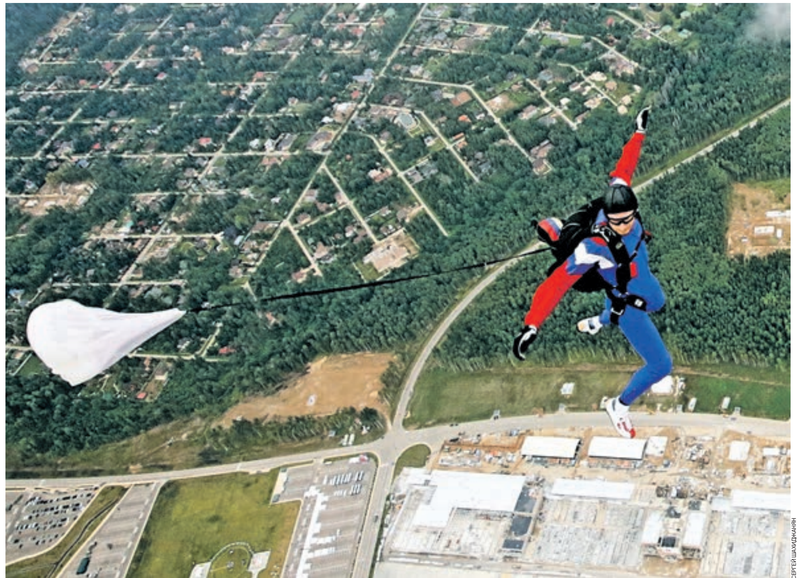
Вчера 15:30 В небе над российским парком «Патриот» выполняет акробатический трюк капитан французской сборной по парашютному спорту. Соревнования помогают достичь взаимопонимания и укрепить доверительные отношения между вооруженными силами разных стран