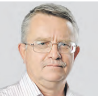
АЛЕКСАНДР ХОЛОВ ОБОЗРЕВАТЕЛЬ

Место для подвига находится и в годы мира. Так, героическим званием был отмечен первый человек в космосе — наш человек! — Юрий Гагарин. Всего за советское время «Золотыми Звездами» были награждены 12 772 человека, представителями более 60 национальностей и народностей СССР. После распада Советского Союза 20 марта 1992 года в России было учреждено звание Героя Российской Федерации, также присваиваемое за выдающиеся подвиги.