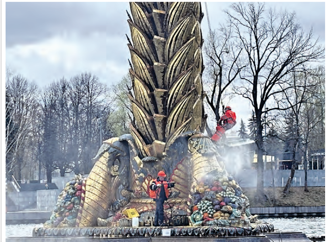
15 апреля. Промышленные альпинисты проводят промывку фонтана «Золотой колос» на ВДНХ. Такую промывку будут проводить ежемесячно.

ВАСИЛИСА ЧЕРНЯВСКАЯ v.chernyanskaya@vm.ru