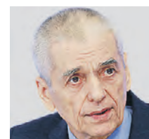
ГЕННАДИЙ ОНИЩЕНКО АКАДЕМИК РАН, ЗАМЕСТИТЕЛЬ ПРЕЗИДЕНТА РОССИЙСКОЙ АКАДЕМИИ ОБРАЗОВАНИЯ

Если так получится, что вы увидели присосавшегося клеща, обязательно сдуйте его в лабораторию, чтобы узнать, заразен ли он или нет. По стране было выявлено 600 тысяч таких случаев, а заболевших было всего несколько тысяч. В зависимости от результатов исследования вам уже скажут, что нужно будет с этим делать. Выезжать за город отдыхать можно, но делайте это аккуратно.