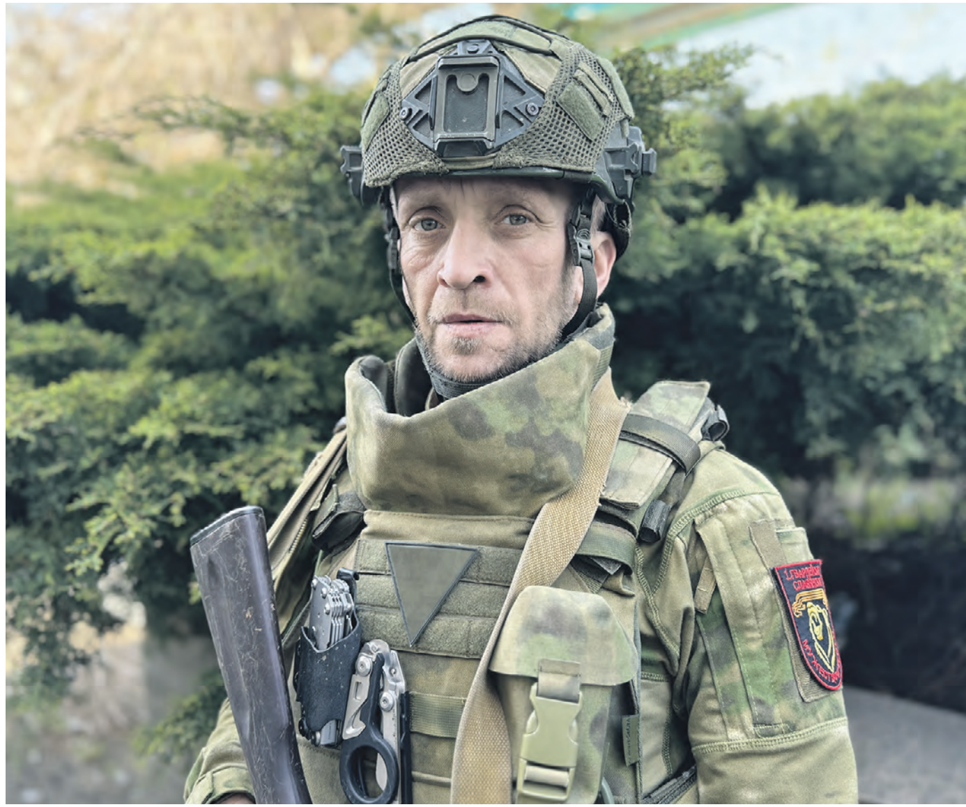
11 апреля. Доброволец 1-й отдельной гвардейской мотострелковой бригады 1-го армейского корпуса Южной группировки войск с позывным «Шахтер» в пункте временной дислокации.

Контракт на военную службу он подписал в январе 2023-го, а летом того же года на фронт отправился и второй сын, рассказывает житель ЛНР.