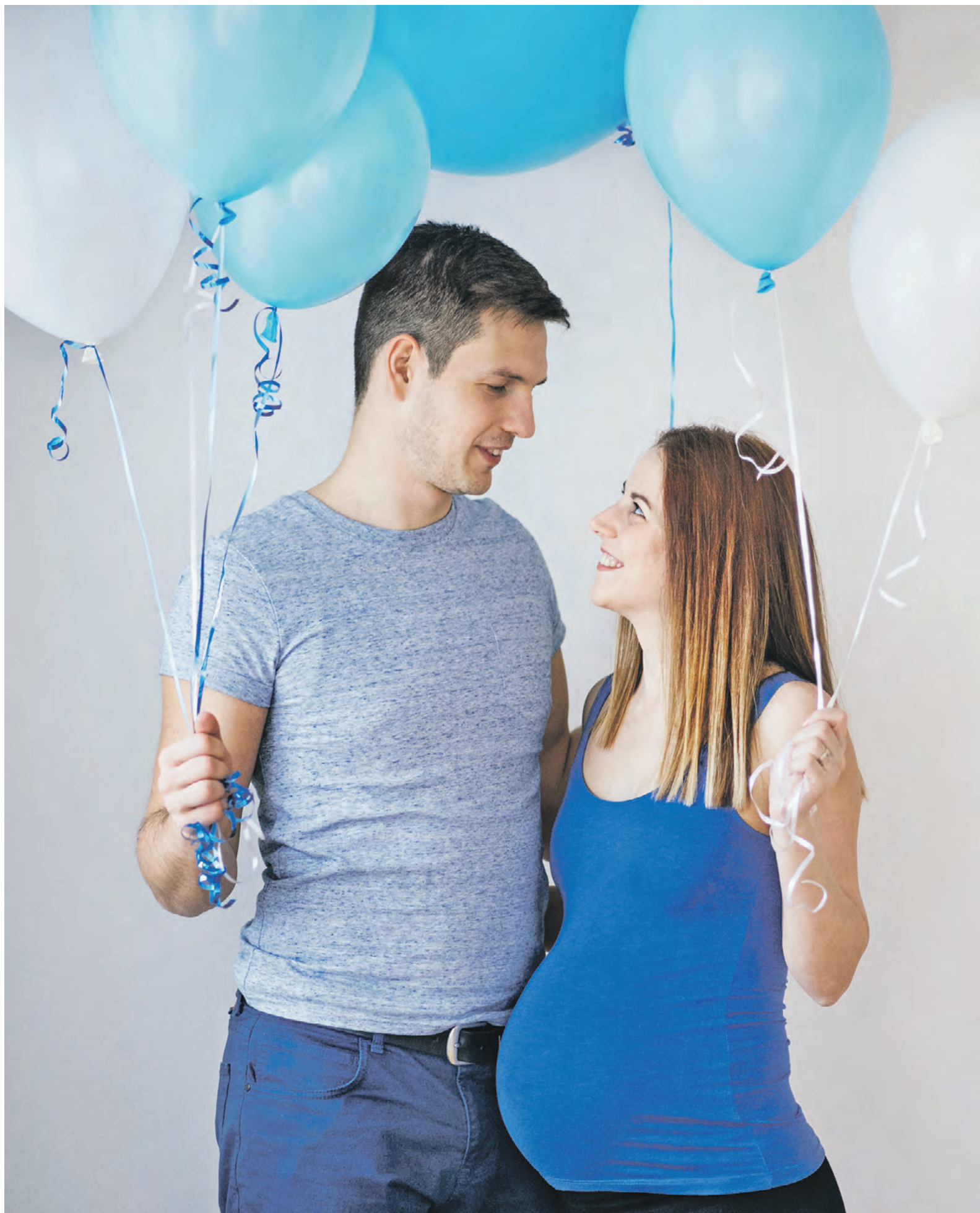
Типичная для нашего времени картина: супруги, ожидающие прибавления в семействе, оглашают пол будущего малыша цветом: «Синий — ждем мальчика!»