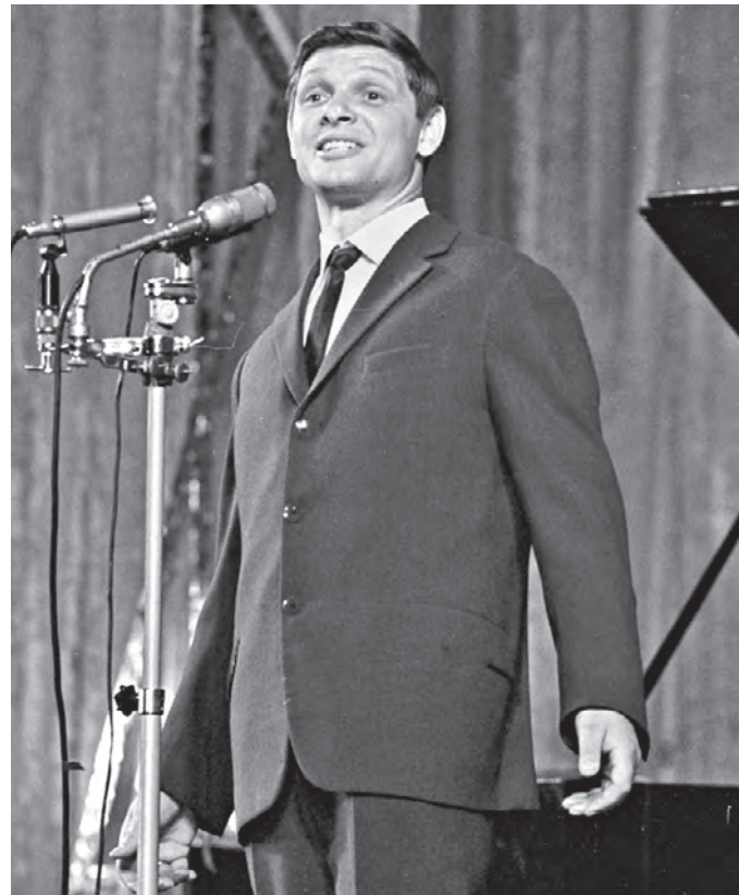
Эстрадный певец Эдуард Хиль во время выступления в Ленинграде. Фото 1965 года

Если посмотреть записи старых концертов, невольно улыбаешься: даже самые «продвинутые» ВИА — вокально-инструментальные ансамбли — выглядят на них статично и официально. На этом фоне манера поведения на сцене Эдуарда Хила была, конечно, прогрессивной. Он принес на