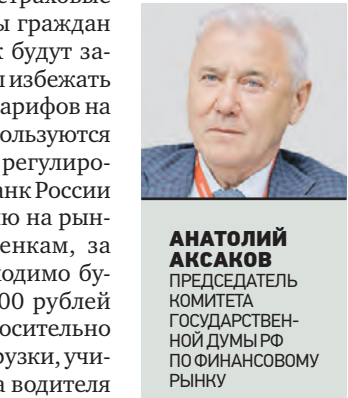
АНАТОЛИЙ АКСАКОВ ПРЕДСЕДАТЕЛЬ КОМИТЕТА ГОСУДАРСТВЕННОЙ ДУМЫ РФ ПО ФИНАНСОВОМУ РЫНКУ

Конечно, это серьезное и значительное улучшение обеспечения интересов граждан. В ключе предотвращения злоупотреблений новыми нормами важно отметить, что большая часть перевозчиков работает на арендованных автомобилях и периодически их меняет. Но если водитель решит продать машину, то полис ОСГОП должен быть аннулирован. При оформлении нового автомобиля водитель должен будет заключить новый страховой договор. Данный законопроект готовился с 2018 года. Все положения документа детально прорабатывались при содействии бизнеса и общественных организаций, подключался к процессу и ЦБ РФ. Предложения, получаемые от коллег, требуют анализа, и вполне возможна их реализация. Опыт, который будет накапливаться на практике, будет учтен в дальнейшем законодательных актах.