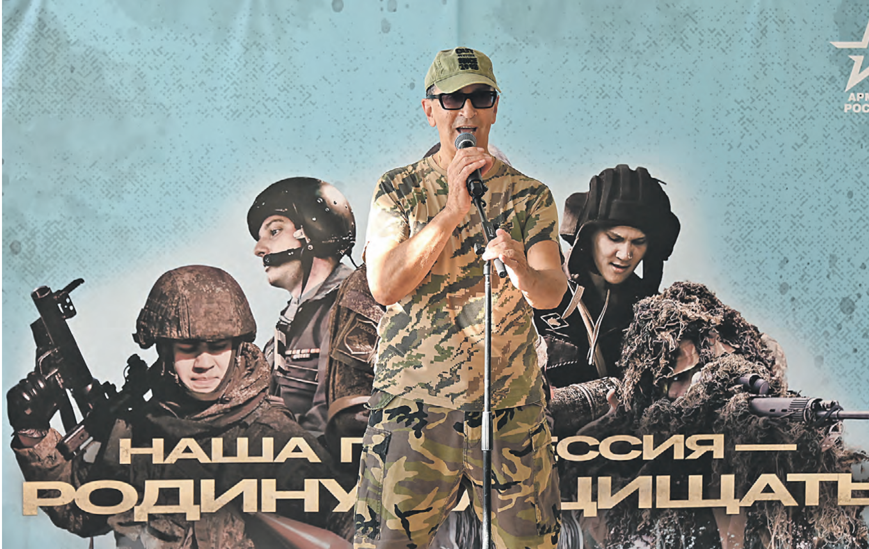
3 сентября. Народный артист России Александр Буйнов выступил перед бойцами в Едином пункте отбора на военную службу по контракту.