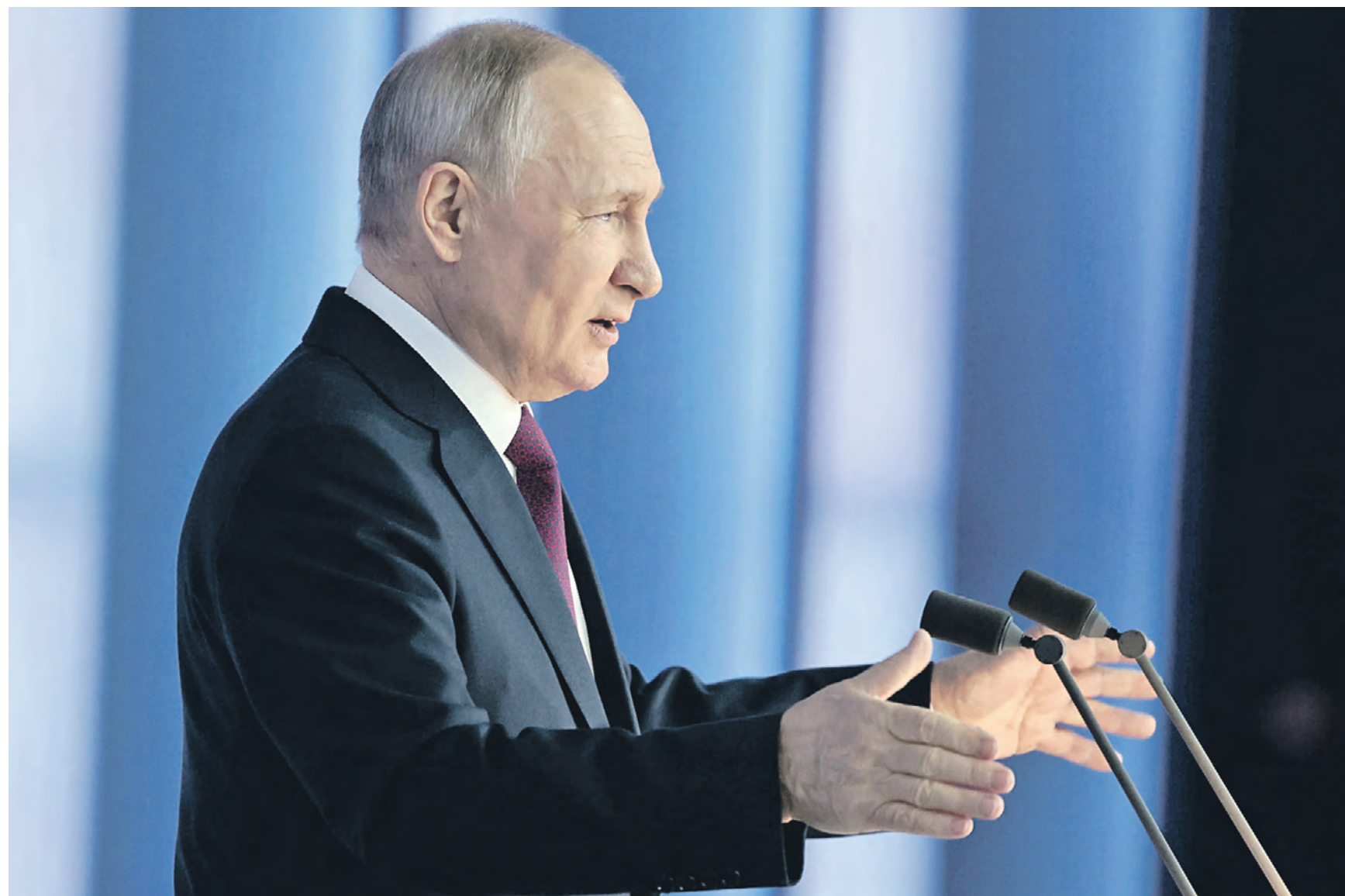
Вчера 13:22 Президент России Владимир Путин выступает с ежегодным посланием Федеральному собранию в Гостином Дворе. В ходе выступления глава государства выразил благодарность всем, кто защищает и развивает нашу страну, поддерживает бойцов на передовой

рые передаются из поколения в поколение. Мы идем только вперед благодаря преданности Родине, воле и нашему единству. Эта сплоченность проявилась буквально с первых дней специальной военной операции. Сотни добровольцев, предстатели всех народов нашей страны пришли в военные комбаты, приняли решение встать рядом с защитниками Донбасса, бороться за родную землю, за Отечество, за правду и справедливость. Сейчас плечом к плечу на передовой сражаются воины из всех регионов нашей многонациональной родины. Их молитвы звучат на разных языках, но все они за победу, за Родину! Их тяжелый ратный труд, их подвиг находят мощный отклик во всей России. Люди поддерживают наших бойцов, не хотят, не могут оставаться в стороне. Фронт проходит сейчас через сердца миллионов наших людей. Знаю, как письма детей, школьников согревают фронтовиков, они берут их с собой в бой как самое дорогое, потому что искренность и чистота детских пожеланий трогают до слез. Народный фронт в рамках инициативы «Все для Победы!» собрал более 5 миллиардов рублей! Поток пожертвований идет постоянно. Такое единение для помощи нашим воинам, мирным жителям в зоне боевых действий, беженцам дорогого стоит! Спасибо вам за такую искреннюю поддержку, сплоченность, взаимовыручку! Их невозможно переопределить! Россия ответит на любые вызовы, потому что все мы одна страна, один большой и сплоченный народ! Мы уверены в себе, уверены в своих силах! Правда — за нами! → стр. 2