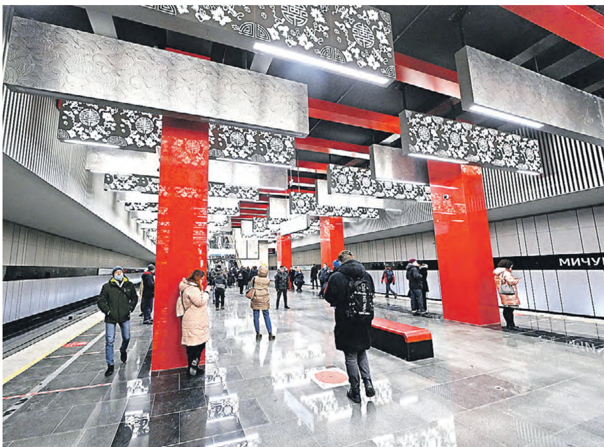
7 декабря 2021 года. Станция Большого кольца столичного метро «Мичуринский проспект»

Подготовила ВАСИЛИСА ЧЕРНЯВСКАЯ v.chernyavskaya@vm.ru