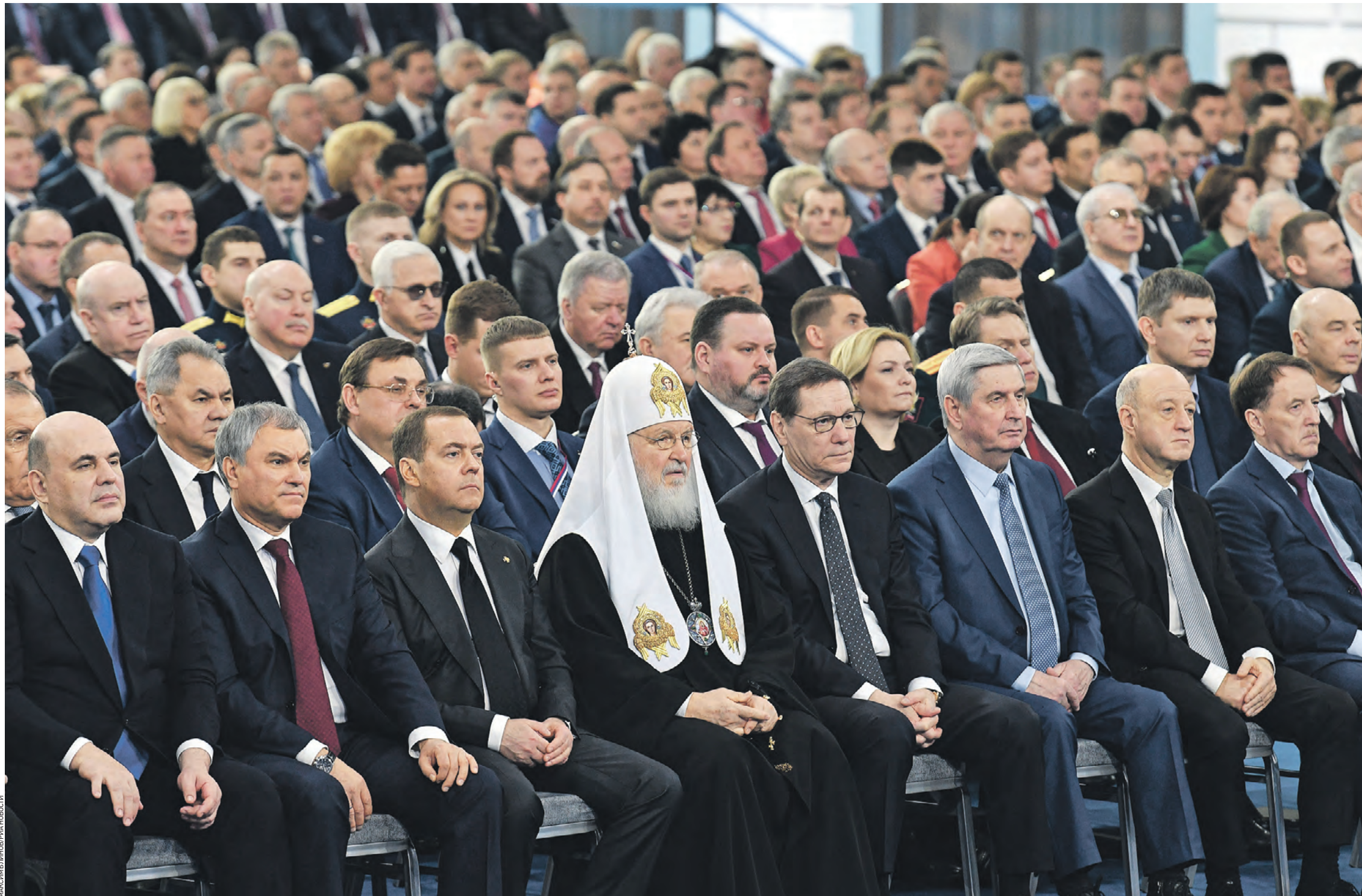
Вчера 12:47 На фото (слева направо в первом ряду): председатель правительства РФ Михаил Мишустин, председатель Государственной думы РФ Вячеслав Володин, заместитель председателя Совета безопасности РФ Дмитрий Медведев, Патриарх Московский и всея Руси Кирилл, первый заместитель председателя Государственной думы РФ Александр Жуков, первый заместитель председателя Государственной думы РФ Иван Мельников, заместитель председателя Государственной думы РФ Александр Бабаков и заместитель председателя Государственной думы РФ Алексей Гордеев в Гостином Дворе, где президент России Владимир Путин выступает с ежегодным обращением к Федеральному собранию

Владимир Путин: Молитвы воинов звучат на разных языках, но все они за победу, за боевых товарищей, за Родину!