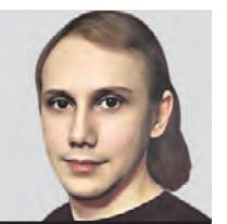
МИХАИЛ ГАЛИЦКИЙ ПОЛИТОЛОГ

дел сонную артерию, поэтому спасти ребенка не удалось. В социальных сетях стали писать, что это были клоны сериала «Слово пацана», но правоохранительные органы это не подтверждают. Помимо этого начали распространять фейки. Например, недавно в интернет-пространстве появились сообщения о том, что подпольщики в Татарстане якобы возродили преступные группировки и устроили массовую драку. На деле местные в шутку создали телеграм-каналы с названиями казанских организованных преступных группировок «Хади Такташ» и «Жилка», а затем соврали, что поделили между собой районы города. Мне кажется, что транслировать такие фильмы не стоит, потому что они плохо влияют на подростков с неокрепшей психикой. Но чтобы решить эту проблему, нужно ставить акцент на педагогику, а не на запреты. Сам скандал вокруг этого фильма уже принес ему хорошую рекламу.