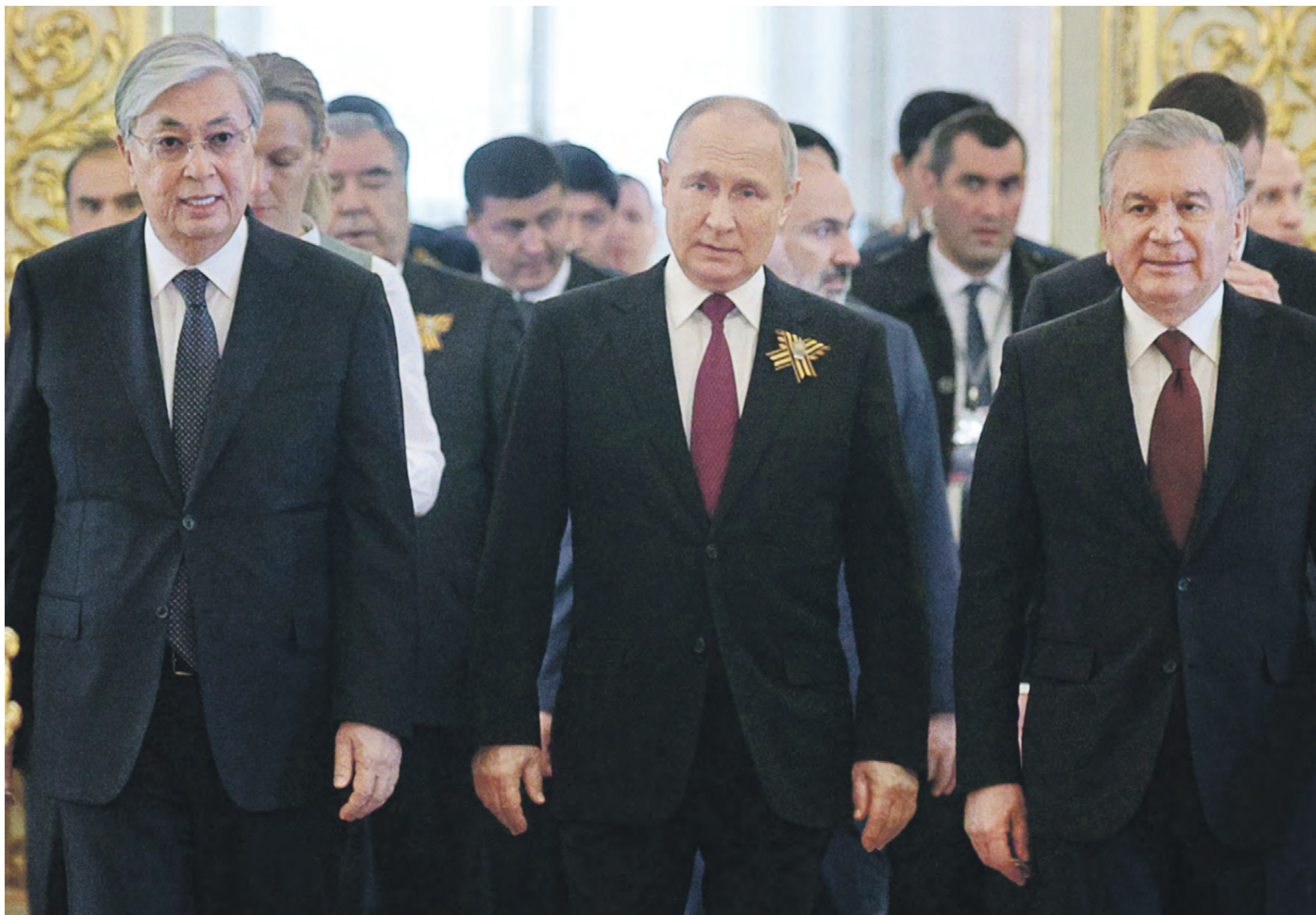
9 мая. Президент России Владимир Путин, президент Казахстана Касым-Жомарт Токаев (слева) и президент Узбекистана Шавкат Мирзиёев (справа) перед началом рабочего завтрака глав государств — участников СНГ

Кстати, о проблемах. Многие уверены, что наш главный рычаг воздействия на страны Центральной Азии — это миграционный режим. Дескать, введем визы, не пустим гастарбайтеров и добьемся выполнения любых наших требований. — Резон в этих рассуждениях есть. Экономика трех стран региона — Таджикистана, Узбекистана и Киргизии — во многом зависит от поступления денег из России, от работающих там граждан, — пояснил Виктор Кудрявцев. — Проблема в том, что мигранты нам нужны никак не меньше! На население примерно в 150 миллионов у нас 43 миллиона пенсионеров — почти каждый третий. А работающих — чуть меньше 70 миллионов, т.е. менее половины населения. В последнее время проблема недостатка рабочих рук только усугубляется. 319 тысяч молодых мужчин год назад призвали в ходе мобилизации. Еще примерно 350 тысяч в этом году заключили контракт с Минобороны. Итого: минус 665–670 тысяч. И всех вышедших из экономики нужно замещать. У нас только в ВПК — самой важной сейчас отрасли — 400 тысяч вакансий. Иными словами, люди нужны. Введя визовый режим, мы себе же и навредим.