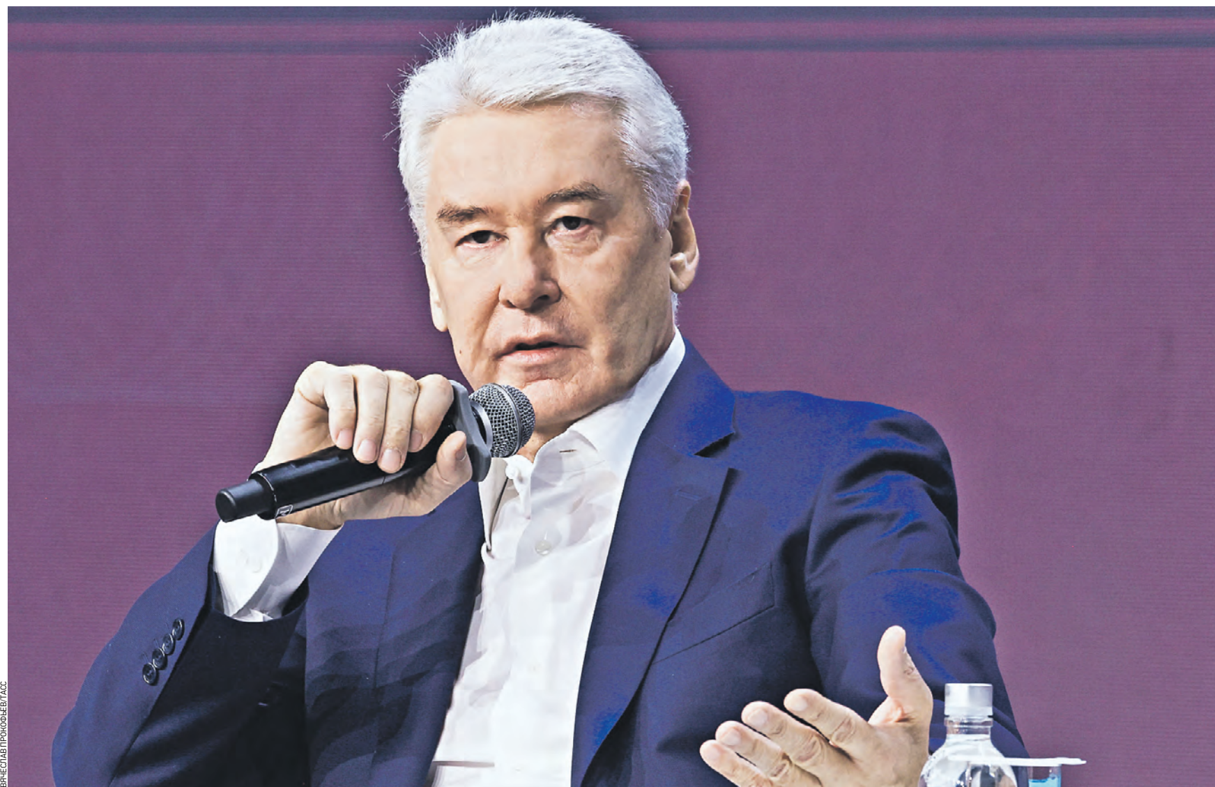
8 ноября. Мэр Москвы Сергей Собянин на панельной дискуссии форума инновационных финансовых технологий Finopolis рассказывает о внедрении искусственного интеллекта в здравоохранении, образовании и сфере безопасности столицы

Мэр сообщил, что Москва находится на пороге следующего этапа развития технологий, которые будут глубже интегрированы в городскую среду. Одна из самых востребованных отраслей, в которых активно применяется искусственный интеллект, — это здравоохранение. В частности, речь идет об обработке снимков лучевых исследований, которая дает правильную диагностику в среднем в 96–98 процентах случаев, а по 30 нозологиям искусственный интеллект выдает стопроцентное распознавание. Технологии идут дальше, и уже сейчас нейросеть помогает врачам в постановке предварительных диагнозов. — В перспективе это будет цифровой двойник человека, когда мы будем диагностировать не по обострению каких-