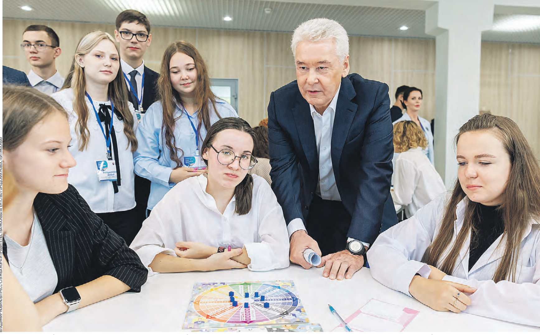
1 сентября 2021 года 10:03 Мэр Москвы Сергей Собянин на открытии после ремонта здания школы «Дмитровский» на Карельском бульваре. Ежегодно в столице строятся и ремонтируются здания школ, детских садов и колледжей, делая образование доступнее

Развитие системы По итогам президиума в задачи государственной программы «Столичное образование»