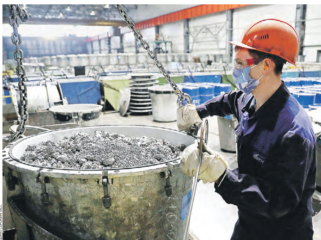
4 марта 2021 года. Свердловская область. Рабочий одного из цехов «Корпорации ВСМПО-Ависма». Эта компания — крупнейший поставщик титана в мире, попавший под западные санкции

Надо заметить, что о прекращении поставок российского газа речи не идет. Куда мы денем 150 миллиардов кубометров, которые составляют наш экспорт? Экономика не подворотно, где можно вывязываться в драку. В экономике побеждает тот, кто умнее. Еще больше зависимость Запада от российской нефти. 25–30 процентов нефти в Европу приходит из России. Наша страна — второй импортер нефти даже в США. Да, от продажи нефти Россия получает