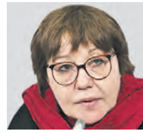
ЛЮБОВЬ АРКУС РЕЖИССЕР, ИЗДАТЕЛЬ КИНОЖУРНАЛА «СЕАНС»

ментарная логика. Эффект от голливудских демаршей может даже дать прирост нашей экономике. Я имею в виду вопрос патентного права и права на интеллектуальную собственность. Если Голливуд ограничивает нас в прокате, то мы можем закрыть глаза на пиратское скачивание контента — благо сейчас в кинотеатры у нас ходит сравнительно мало людей, а большинство смотрят фильмы и сериалы в интернете. При необходимости мы можем расширить такую практику, и это будет вполне нормальным ответом. И тогда западные патенты на программное обеспечение, технические изобретения и прочее для нас будут практически ничего не стоить, а сам Запад от подобного пиратства будет терять очень большие деньги.