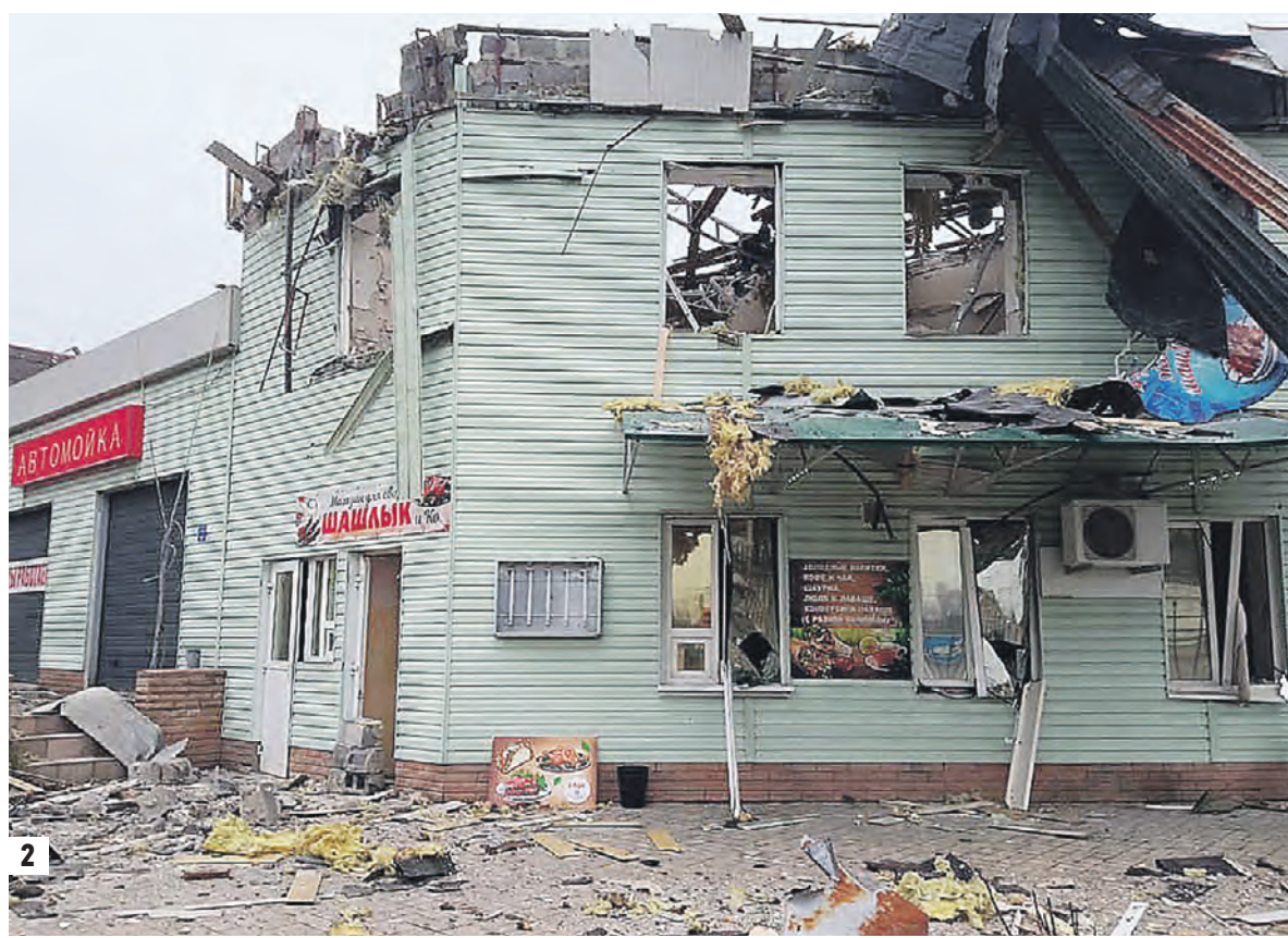
Вчера 11:13 Мэр Донецка Алексей Кулемзин в своем кабинете в здании администрации (1) Вчера 09:58 Результат утреннего обстрела Донецка украинскими военными. Снарядами разрушена крыша городского кафе (2)