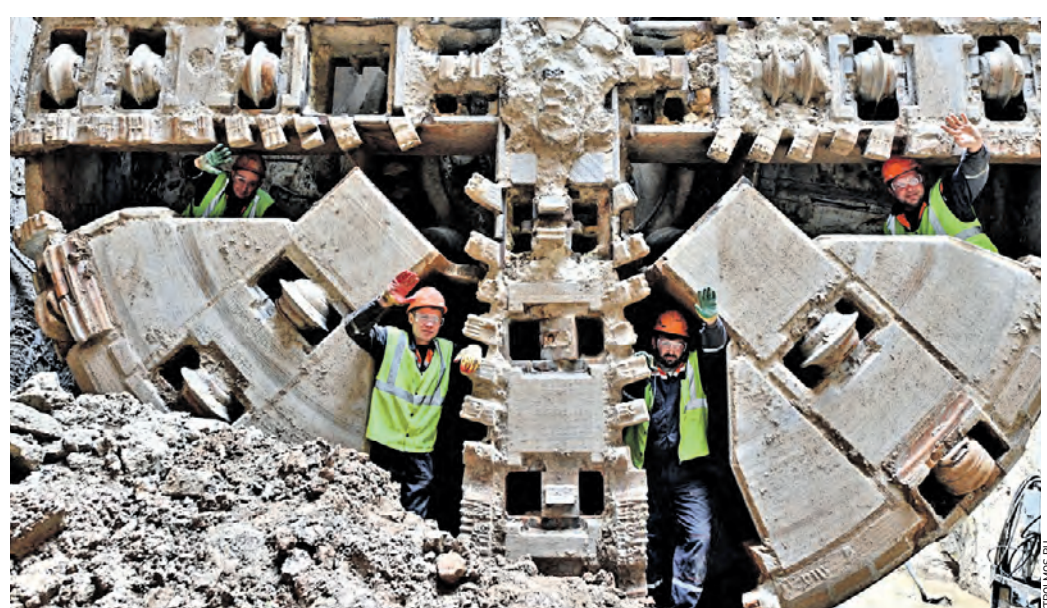
21 сентября 10:37 Выход щита на участке Рублево-Архангельской линии столичного метрополитена. Специалисты прошли первый тоннель

«ЗИЛ» к платформе «Крымская» комплекс «Александра» и тоннелепроходческие щиты «Марина» и «Ольга», соединяющие тоннелями «Вавиловскую» с «Академической». Они преодолели в совокупности примерно две трети запланированного пути. Кроме того, в монтажной камере стационного комплекса будущей станции «Академическая», которая станет пересадочной с одноименной платформы Калужско-Рижской линии метро, осуществляется сборка щита для строительства тоннеля в сторону «Крымской». Возведение основного конструктива станции начнется после завершения «Академической» и «Вавиловской». — На «Вавиловской» ведутся монолитные работы — здесь уложено порядка двух тысяч кубометров бетона, — уточнил в Стройкомплексе. На станции «Крымская» продолжают вынос инженер-