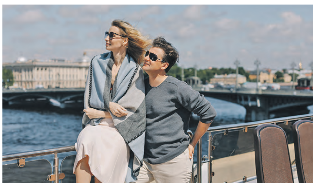
1 сентября 2022 года. Речной круиз в бархатный сезон — прекрасный вариант романтического путешествия для двоих

Круизное путешествие в бархатный сезон — это не только красиво, но и выгодно, ведь осенью стоимость на круизы ниже, чем в высокий летний сезон. К тому же в одну путевку входит проживание в каюте со всеми удобствами, трехразовое питание, экскурсии на берегу и развлекательная программа на борту.