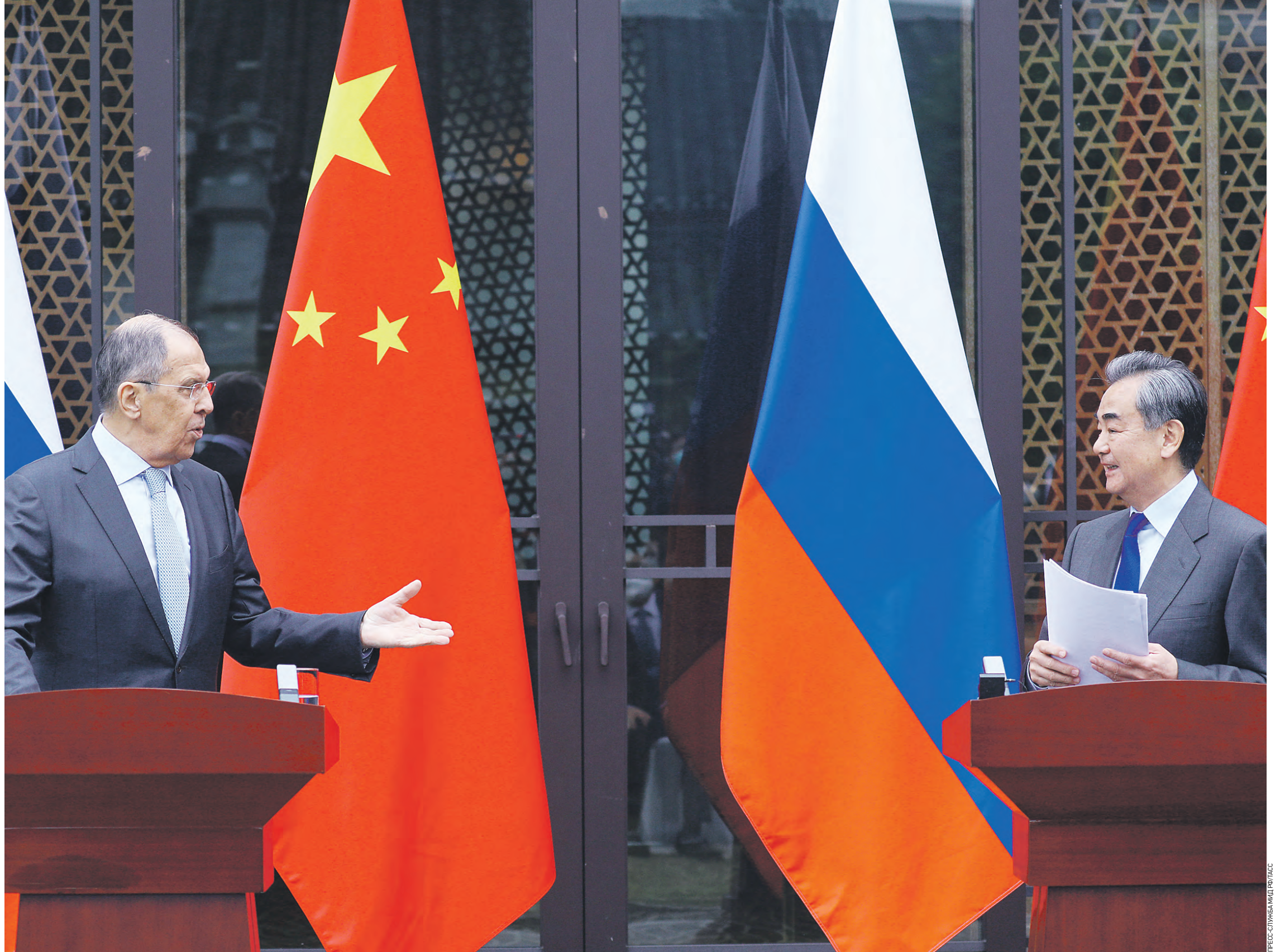
23 марта 2021 года. Министр иностранных дел России Сергей Лавров и министр иностранных дел Китая Ван И на встрече в Гулине, в ходе которой обсудили совместную борьбу с пандемией и вопросы глобального управления

Китай погружен в целый ряд территориальных споров с соседями. Неурегулированные вопросы о территориях есть у него с Филиппинами, Вьетнамом, Малайзией, Индией — не говоря уже о тайваньской проблеме. За последнее столетие Китай не раз начинал боевые действия для решения этих проблем — с большим или меньшим успехом. Эти инциденты сильно вредят имиджу страны в регионе, соседи боятся Китая. Поэтому любая военная активность для него нежелательна, она грозит еще большим осложнением отношений с соседями. Разумеется, в Пекине хотели бы присоединения Тайваня мирным путем, понимая, что военный вариант приведет если не к обычной, то точно к экономической войне с США. Однако если Вашингтон своими нелогичными и подчас провокационными действиями вынудит КНР реагировать жестко, может дойти и до вооруженно-