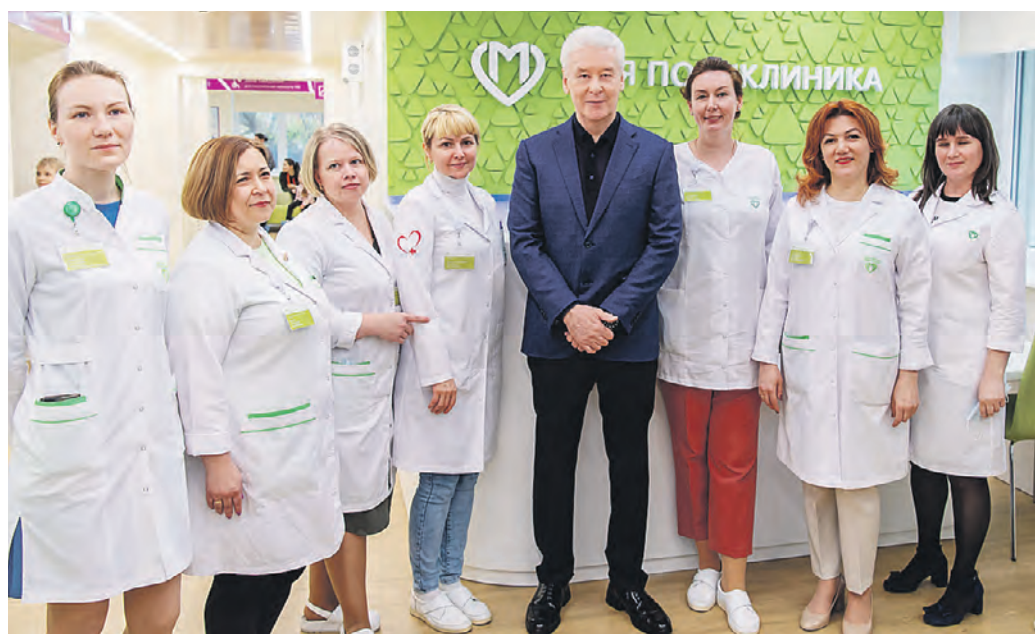
4 мая 2022 года. Мэр Москвы Сергей Собянин (в центре) с коллективом филиала №1 Детской городской поликлиники № 110, здание которой было реконструировано по столичному стандарту

сту. Вместо регистратуры за стеклом — открытая стойка информации. Свои двери вчера открыли две городские (на Мосфильмовской улице и в Шмитовском проезде) и детская поликлиника на 2-й Владимирской. — В общей сложности медпомощь в них будут получать больше 62 тысяч москвичей, — сообщил Сергей Собянин. Мэр напомнил, что в 2019 году была разработана программа комплексной реконструкции городских поликлиник. В нее вошло 201 здание. — Огромный масштаб, практически половина всего городского амбулаторного фонда. На сегодняшний день 63 здания уже готовы, в остальных идут работы, — продолжил глава столицы. — Завершить