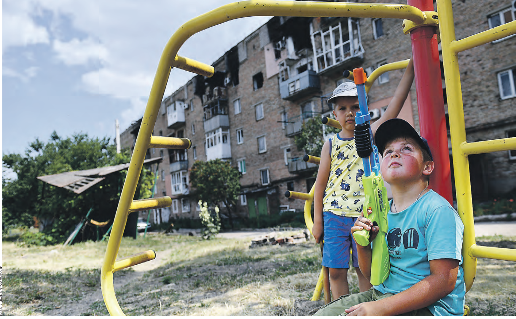
5 июля 15:29 Дети играют на площадке возле жилого дома на одной из улиц Волновахи. Эту территорию российские войска освободили от националистов еще в марте. Сейчас в городе восстанавливается мирная жизнь

Тем временем ВКС России уничтожили на территории ДНР две пусковые установки к американским РСЗО, сообщил официальный представитель Минобороны РФ Игорь Конашенков. — В районе населенного пункта Малотарановка Донецкой Народной Республики высокоточными ракетами воздушно-го базирования уничтожены две пусковые установки системы залпового огня HIMARS производства США и два склада боеприпасов к ним, — уточнил Конашенков. Кроме того, росгвардейцы обнаружили в Донбассе круп-