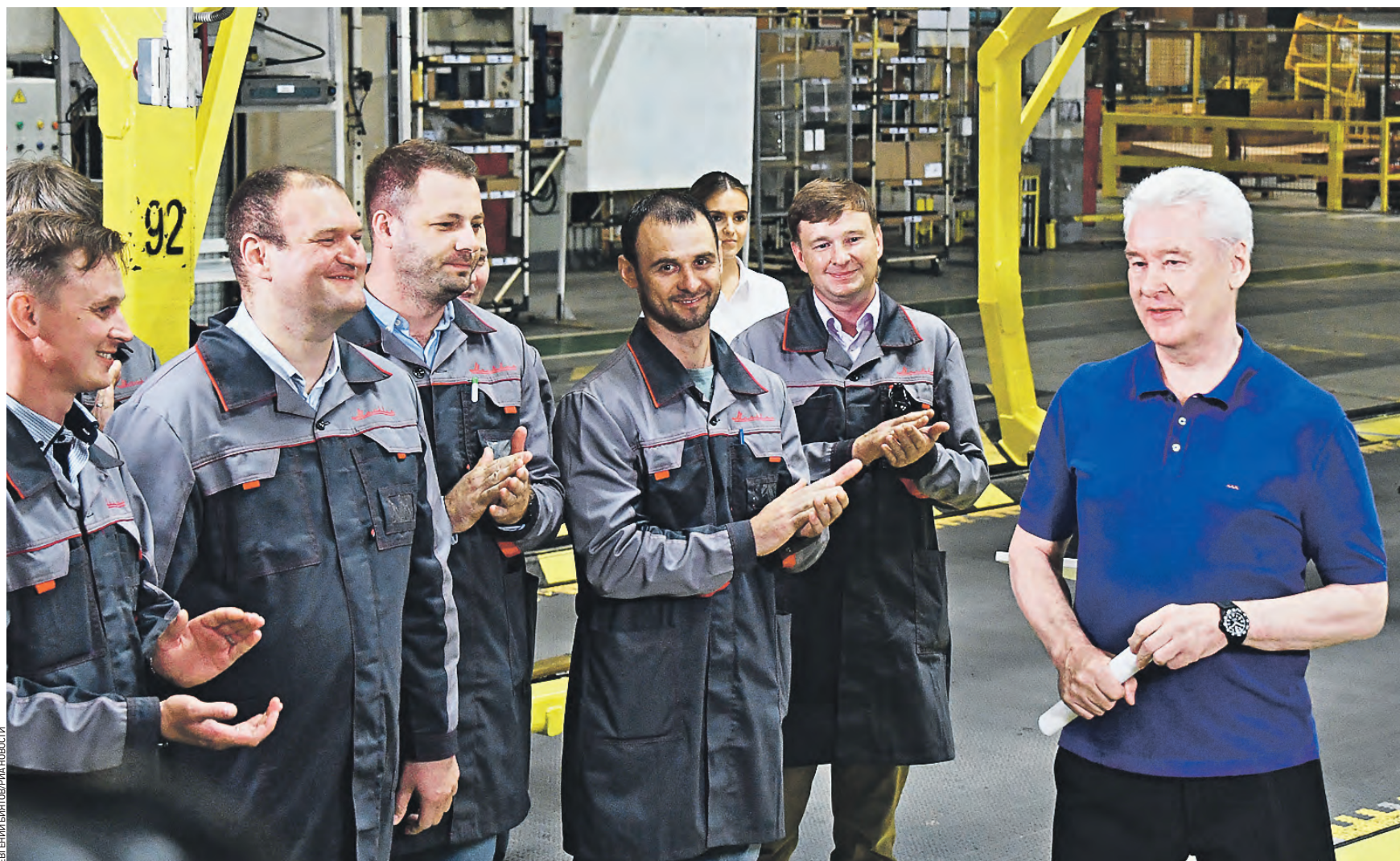
Вчера 13:50 Мэр Москвы Сергей Собянин (справа) общается с сотрудниками автомобильного завода «Москвич» во время своего визита на предприятие. Совсем скоро здесь будут производить российские машины

Французская компания «Рено» владела московским заводом с 1998 года. В марте этого года она объявила о том, что закрывает предприятие и покидает российский рынок. Правительство столицы решило сохранить легендарный завод и возродить знаменитый бренд «Москвич». — Весной, после ухода прежнего владельца, мы взяли это предприятие на баланс города. Выплатили долги по зарплате, сохранили уникальных специалистов, — сказал Сергей Собянин. Сегодня в штате компании трудоустроено 2305 человек. Средний возраст сотрудников — 38 лет, средний стаж работы на заводе — восемь лет. При этом 42 процента сотрудников работают на предприятии уже более 10 лет. По словам мэра, на первом этапе предприятие будет заниматься сборкой машин из дружественных нам стран, а на втором этапе — более глубокой локализацией производства. — И параллельно этим процессам с сегодняшнего дня начинаем работать над созданием собственной плат-