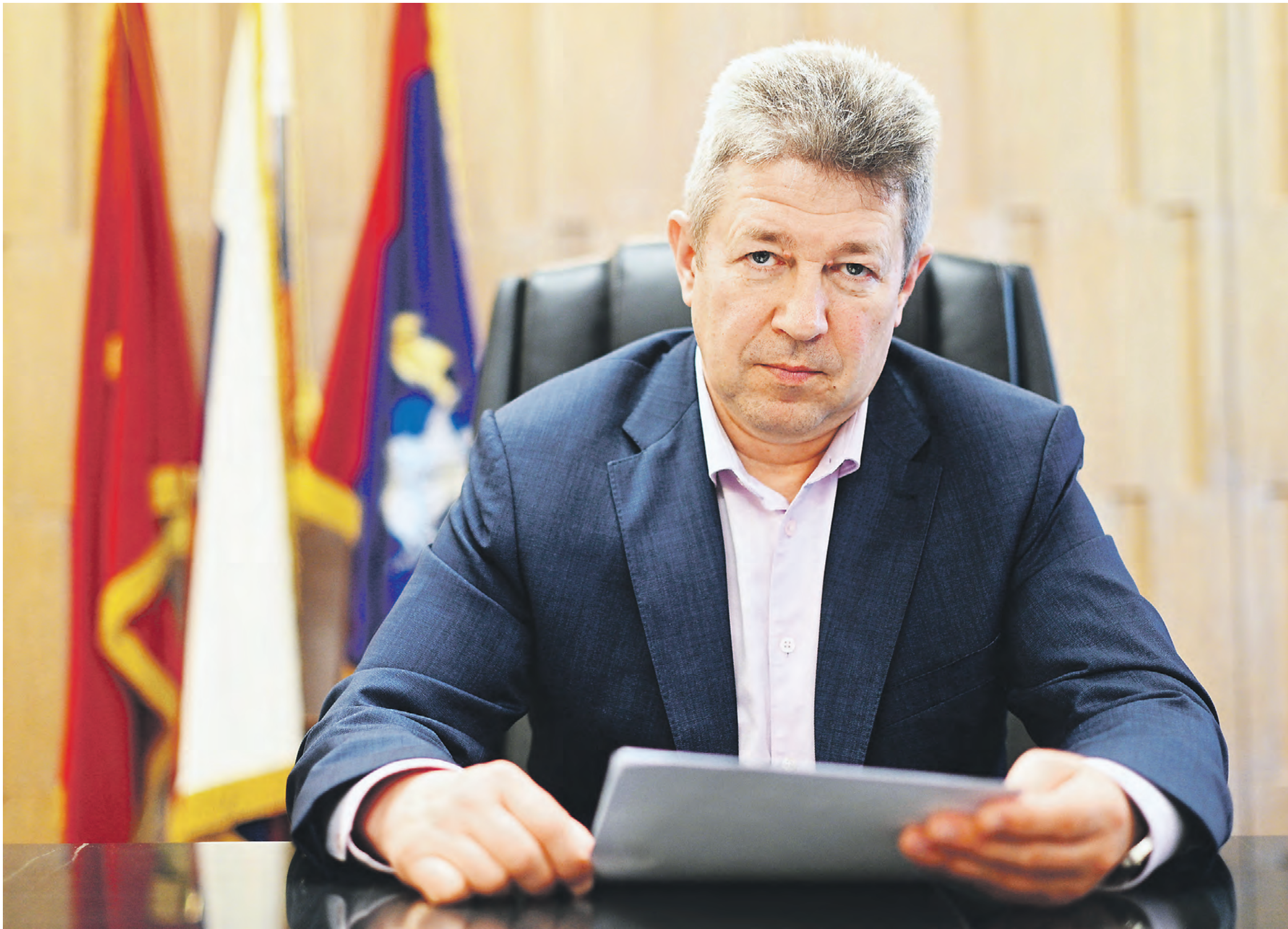
1 июня. Председатель Комитета государственного строительного надзора города Москвы Игорь Войстратенко в своем рабочем кабинете

Председатель Мосгосстройнадзора Игорь Войстратенко: Для путешествий по стране выбираю дикие, нетронутые места