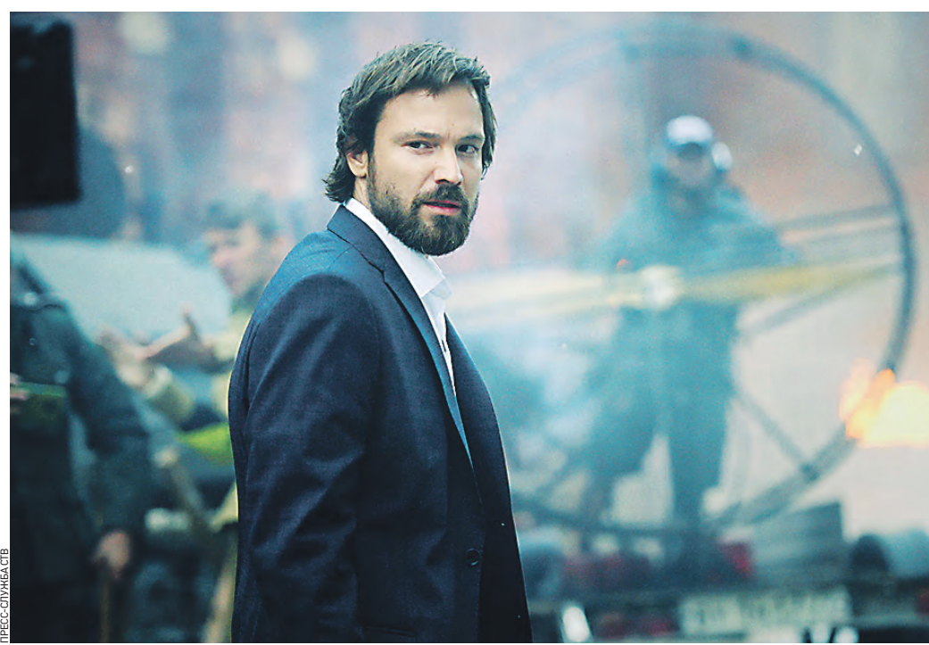
Актер Алексей Чадов дебютировал в качестве автора сценария и режиссера с полнометражным игровым фильмом «Своя война. Шторм в пустыне»

История выхода ленты «Своя война. Шторм в пустыне» долгая и непростая — ленту снимали, когда пандемия вносила коррективы в планы, затем перенесли дату выхода в прокат. И вот в июне 2022-го зритель увидел фильм. Прежде всего стоит сказать, что исполнитель главной мужской роли, автор сценария и режиссер этой ленты — Алексей Чадов. Его кинокарьера началась в 2002 году с фильма Алексея Балабанова «Война». Там артист сыграл Ивана Ермакова, и эта работа полублестяще как критикам, так и публике.