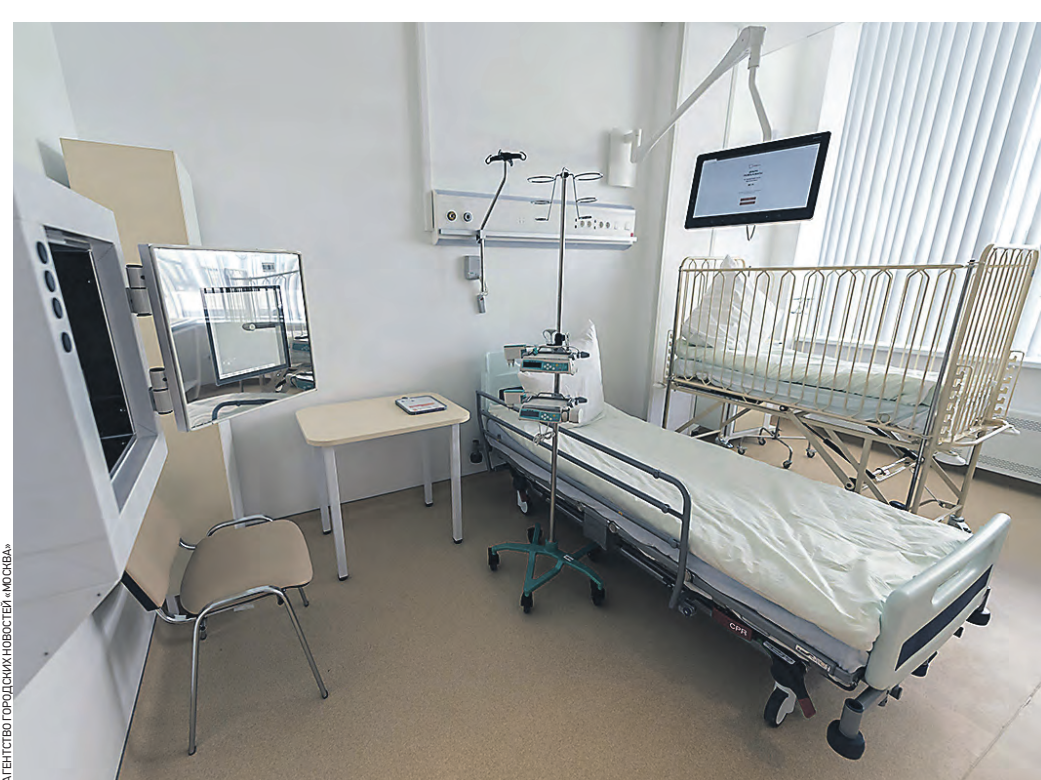
18 июня 2021 года. Детский инфекционный корпус в Коммунарке готов принять пациентов

В начале июня открылся перинатальный центр на 130 коек, который стал первым акушерским стационаром в ТиНАО. Здесь разместили приемное отделение с экстремным оперблоком, два акушерских отделения совместного пребывания матери и ребенка на 100 коек, отделения патологии беременности, реанимации новорожденных, родовое отделение, лабораторию, женскую кон-