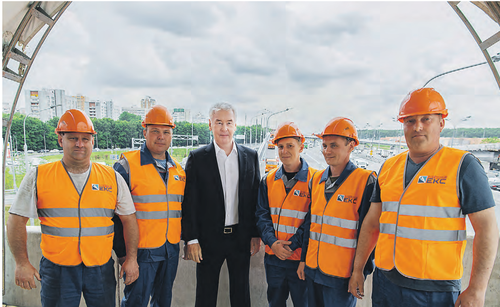
Вчера 12:47 Мэр Москвы Сергей Собянин (третий слева) пообщался с рабочими, которые строят развязку на пересечении МКАД с Осташковским шоссе. Первую очередь сдали, но впереди еще половина работ. Строители обещают сдать транспортный объект к осени

— На месте старой «клеверной» развязки сделаем современную, — рассказал Сергей Собянин. — Проехать ее на автомобиле можно будет примерно на 4–5 минут быстрее. Пассажиры городского общественного транспорта сэкономят до 20–30 процентов времени на каждой поездке. Как уточнил мэр, строители взяли хороший темп: половина работ уже сделана. По плану, объект должны сдать до конца года. Однако председатель совета директоров компа-