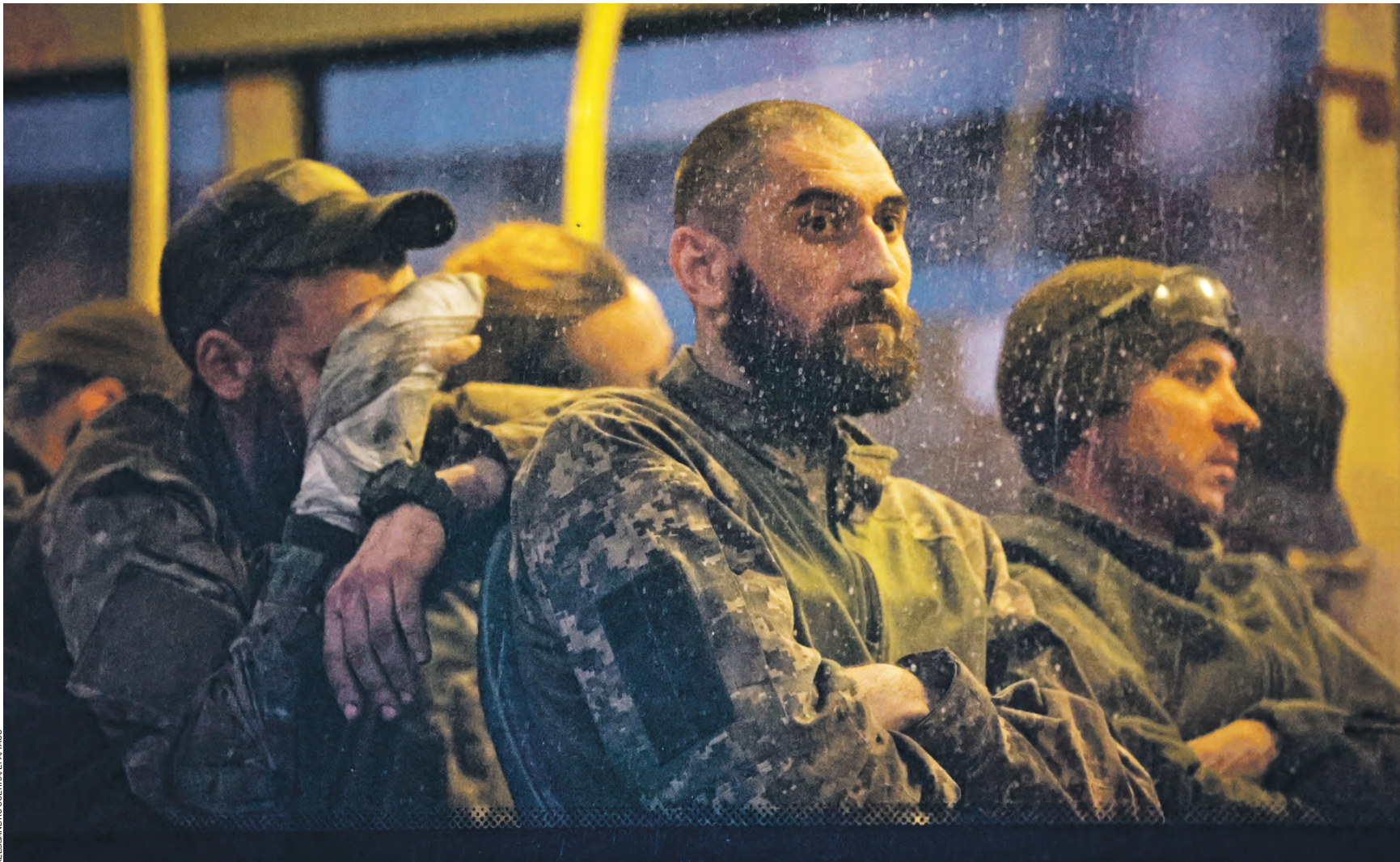
17 мая 18:20 Эвакуация украинских военнослужащих с территории «Азовстали». Тогда более 250 военных сдались в плен. Многие солдаты не хотят возвращаться на родину и снова участвовать в боевых действиях. Например, двое украинцев изъявили желание остаться в России и получить здесь гражданство

В Росгвардии уточнили, что сейчас задержанных доставили в комендатуру для дальнейшего разбирательства. — Также в ЛНР подразделение спецназа Росгвардии обнаружило брошенную замаскированную палатку подразделения ВСУ, автомат Калашникова, гранаты и мины. В одном из населенных пунктов росгвардейцы из схрона противника изыски крупнокалиберный пулемет Владимира, автомат Калашникова, два гранатомета и 54 снаряда к ним, 29 гранат ВОГ-17, восемь мин ТМ-62, сотовый телефон военнослужащего ВСУ, — добавили в ведомстве. В Министерстве обороны России заявили, что в Днепропетровской, Харьковской и Запорожской областях началась принудительная мобилизация. Мужчин задерживают на улицах и направляют служить в украинскую армию. — Мероприятия сопровождаются блокированием населенных пунктов органами национальной полиции. Задерживаются мужчины всех возрастных групп, подлежащих мобилизации, — сообщили в Минобороны РФ. Тем временем российские военные взяли под огневой контроль группировку украин-