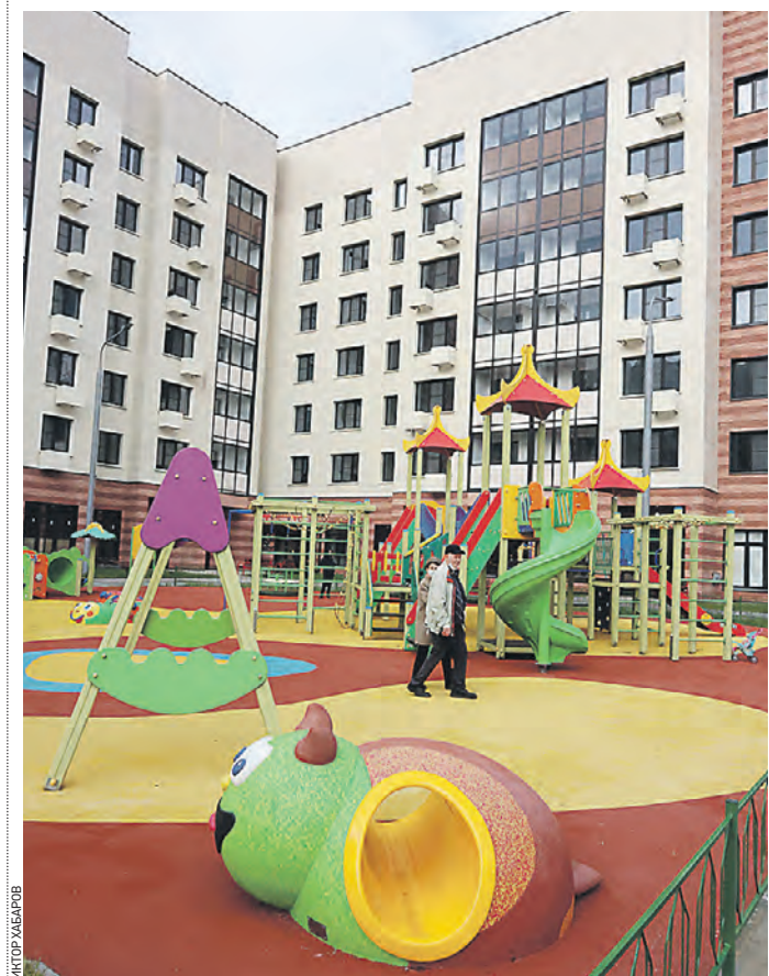
30 октября 2021 года. Дом на улице Академика Черенкова в Троицке возвели по программе реновации

Проекты еще четырех жилых домов разрабатываются: новостройки появятся в поселке Шишкин Лес, владение 5, на улице Спортивной, владение 1, 3, 5, в Троицке, в Щербинке — на улице 40 лет Октября, земельный участок 12, и в Вороновском, в поселке ЛМС, микрорайон Центральный, вблизи дома 36. Ожидается, что к 2025 году программа реновации жилищного фонда в Новой Москве уже завершится.