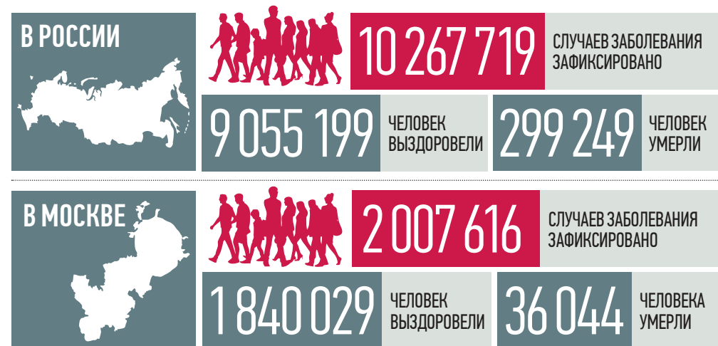
По данным стопкоронавирус.рф и mos.ru на 19:00 21 декабря

В России прослеживаются хорошие признаки по изменению эпидемиологической ситуации, заявила вчера представитель Всемирной организации здравоохранения (ВОЗ) в нашей стране Мелита Вуйнович. Но, по ее словам, заражаемость ковидом все еще высокая, поэтому нужно продолжать работу над снижением распространения вируса.