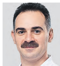
Арнольд Эдуардович, когда ваша больница вступила в борьбу с пандемией?

состояние врачей? В «красной» зоне работают люди, сильные и духом, и физически. Что касается морального духа коллектива, то, поверьте, уныния ни у кого нет. Появилось большее понимание отчасти носителя лечения, чем в начале пандемии. Это придает силы, стало морально спокойнее, хотя каждая новая волна коронавируса протекает со своими особенностями.