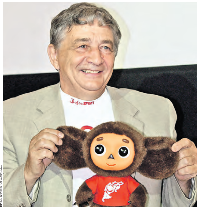
21 июля 2004 года. Писатель Эдуард Успенский с героем своих произведений — Чебурашкой

Газета «Вечерняя Москва» продолжает вспоминать самые интересные и важные события, которые происходили в этот день и повлияли на ход истории.