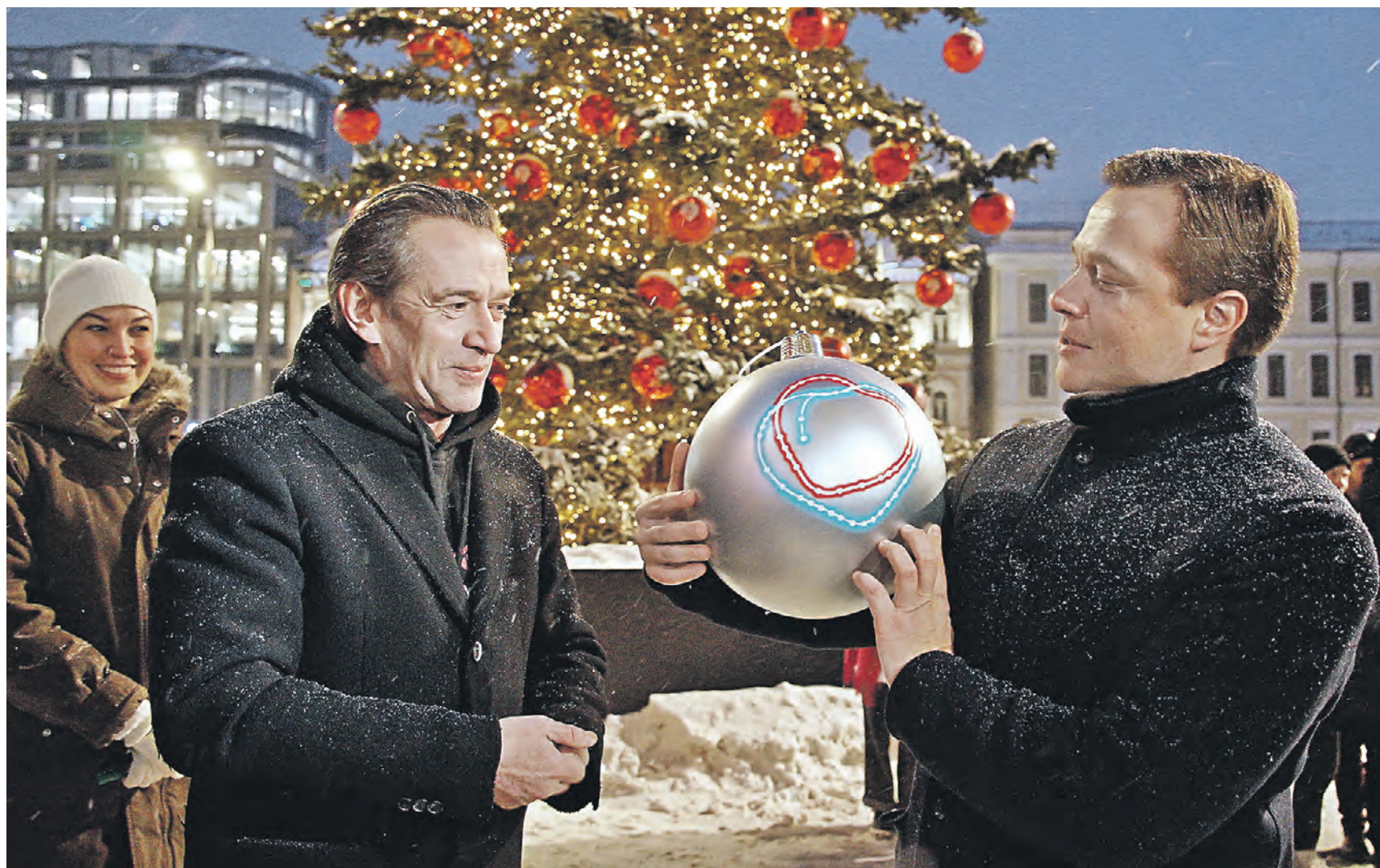
Вчера 16:40 Художественный руководитель Театра Олега Табакова Владимир Машков (слева) и заместитель мэра Москвы Максим Лиситсов оставили свои подписи и пожелания на новогоднем шаре, который украсит транспортную елку на Сухаревской площади. Также они объявили о запуске совместного проекта по безопасности