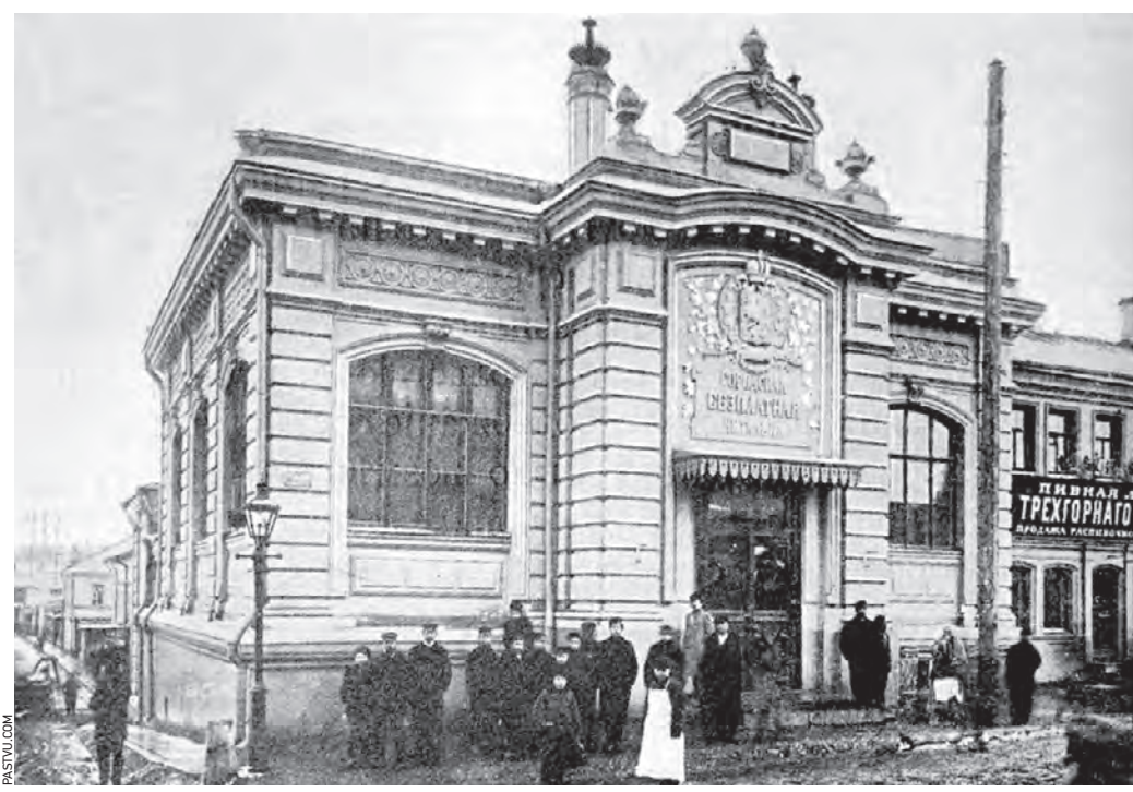
1905–1906 годы. Историческое здание библиотеки-читальни имени И. С. Тургенева построили на средства благотворительницы Варвары Морозовой

дата 8 февраля 1885 года начала свою работу старейшая общедоступная читальня Москвы — библиотека имени И. С. Тургенева.