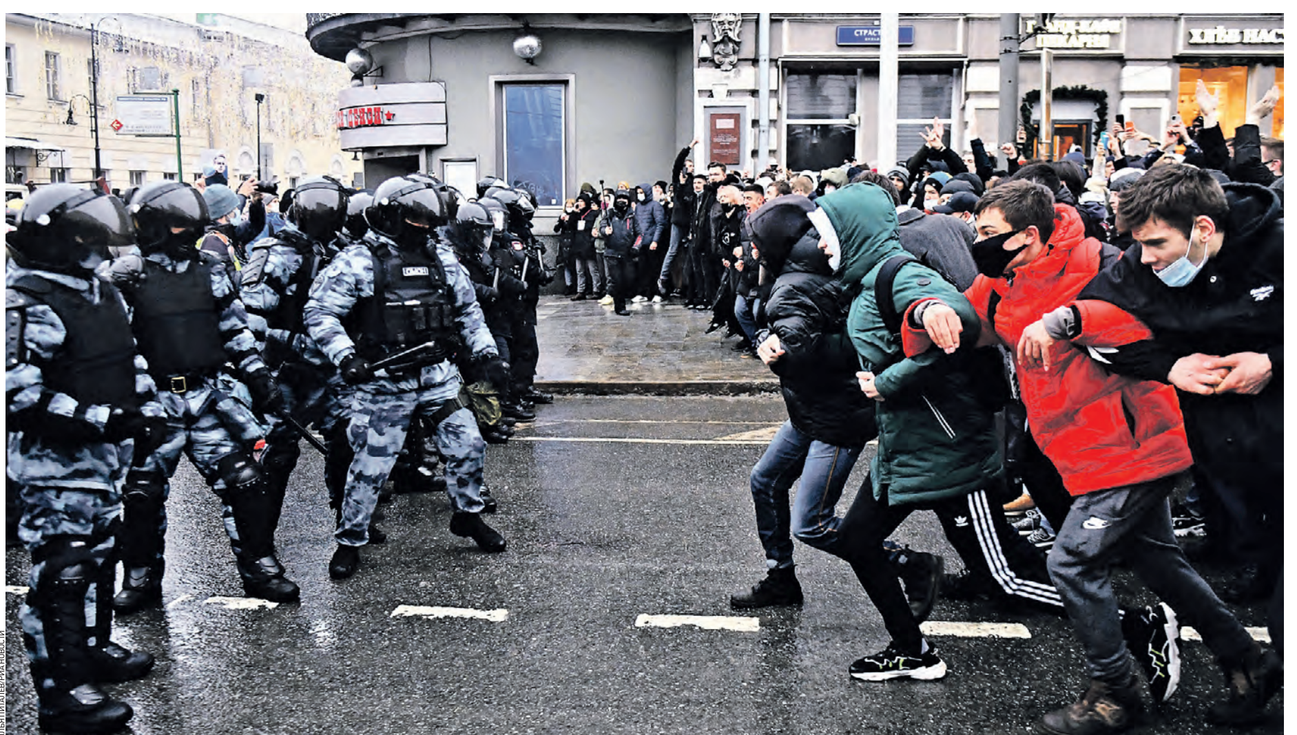
23 января 2021 года. Толпа, состоящая в основном из молодых парней, ввязывается в столкновение с полицейскими. Несанкционированные январские акции закончились массовыми задержаниями нарушителей. Призывы выходить на улицы, полные агрессии к стражам порядка, распространялись в социальных сетях.

Прогрессивный консерватор Интересно, а что можно узнать от сверстников в 15, 16, 17 лет? Как правильно курить за гаражами и не спалиться? Слушать надо старших! Всегда так было!