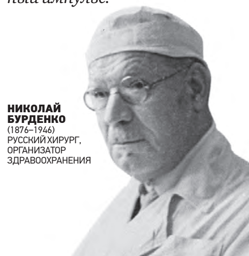
НИКОЛАЙ БУРДЕНКО (1876–1946) РУССКИЙ ХИРУРГ, ОРГАНИЗАТОР ЗДРАВООХРАНЕНИЯ

Иногда мне кажется, что труд вырабатывает какие-нибудь особые гормоны, повышающие жизненный импульс.