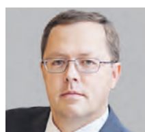
АНДРЕЙ КАРПОВ ПРЕЗИДЕНТ РОССИЙСКОЙ АССОЦИАЦИИ ЭКСПЕРТОВ РЫНКА РЕТЕЙЛА

В первую очередь инициатива должна помочь исправить ту негативную ситуацию, которая существует сейчас в вопросах демографии и защиты здоровья наших граждан. Ведь в 75 процентах смертей трудящейся части населения, в которую входят преимущественно мужчины, виноват алкоголь. Существующие регуляторные меры, созданные для решения этой проблемы, недостаточны. Нам необходимо более качественно и грамотно реагировать на происходящее в стране. В России наблюдается демографический обвал, убыль населения за 2020 год составляет свыше 500 тысяч человек. Это один из острейших факторов, который заставляет задуматься и предпринять конкретные действия для решения этого вопроса. И данная инициатива — один из шагов, который можно предпринять для изменения ситуации. Это делается для пресечения пропаганды алкоголя в детской среде. Обилие крепкой спиртной продукции, которое присутствует в магазинах, — социально опасный фактор. И для этого необходимо вынести его продажу в специальные магазины. Я считаю, что это должно помочь снизить смертность среди граждан и положительно повлиять на рождаемость в стране.