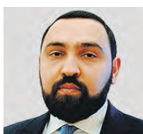
СУЛТАН ХАМЗАЕВ ЧЛЕН ОБЩЕСТВЕННОЙ ПАЛАТЫ РФ

В первую очередь инициатива должна помочь исправить ту негативную ситуацию, которая существует сейчас в вопросах демографии и защиты здоровья наших граждан. Ведь в 75 процентах смертей трудящейся части населения, в которую входят преимущественно мужчины, виноват алкоголь. Существующие регуляторные меры, созданные для решения этой проблемы, недостаточны. Нам необходимо более качественно и грамотно реагировать на происходящее в стране. В России наблюдается демографический обвал, убыль населения за 2020 год составляет свыше 500 тысяч человек. Это один из острейших факторов, который заставляет задуматься и предпринять конкретные действия для решения этого вопроса. И данная инициатива — один из шагов, который можно предпринять для изменения ситуации. Это делается для пресечения пропаганды алкоголя в детской среде. Обилие крепкой спиртной продукции, которое присутствует в магазинах, — социально опасный фактор. И для этого необходимо вынести его продажу в специальные магазины. Я считаю, что это должно помочь снизить смертность среди граждан и положительно повлиять на рождаемость в стране.