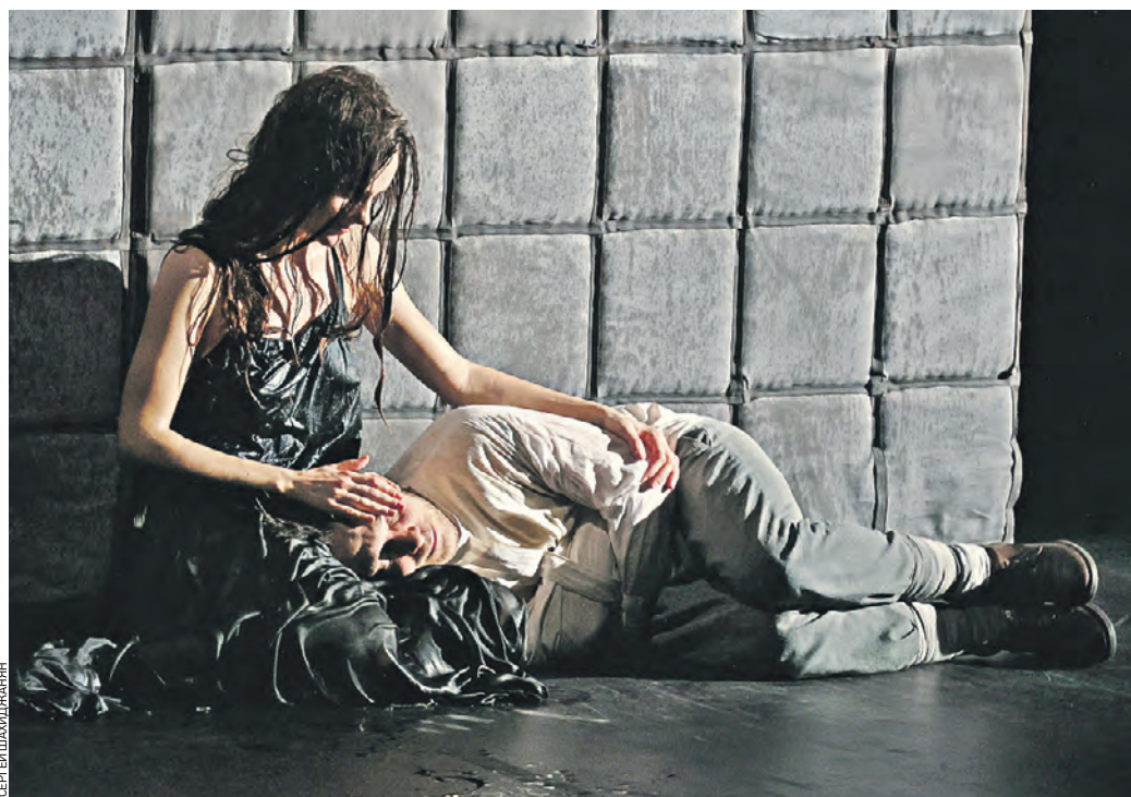
Вчера 13:50 Актеры Ася Домская и Максим Севриновский играют влюбленных в спектакле «Войцек» на сцене Театра имени Евгения Вахтангова