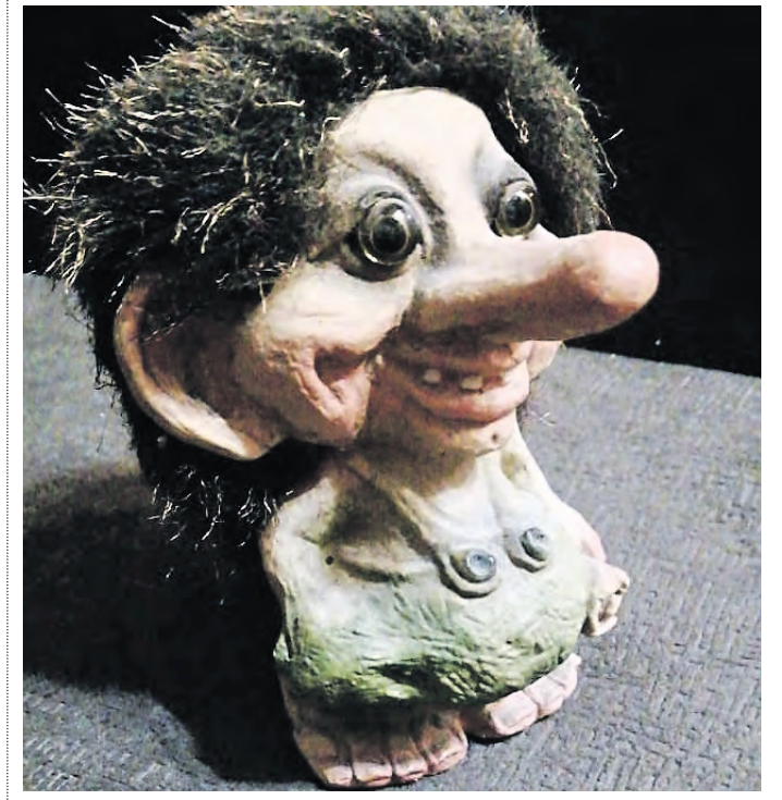
Вчера 11:02 Фигурка сказочного тролля из Норвегии до сих пор напоминает о визите к заграничным коллегам