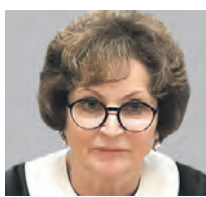
ЕКАТЕРИНА ЛАХОВА председатель Союза женщин России

Предложение неплохое. Ведь есть женщины, которые пострадали от насилия и восстанавливаются после этой травмы психологически. Вот в таком промежуточном состоянии, в период страха, им нужны любые меры поддержки. Есть женщины с реальными фобиями, и им некомфортно находиться в компании мужчин. Думаю, проект можно запустить в тестовом режиме и посмотреть, что из этого получится.