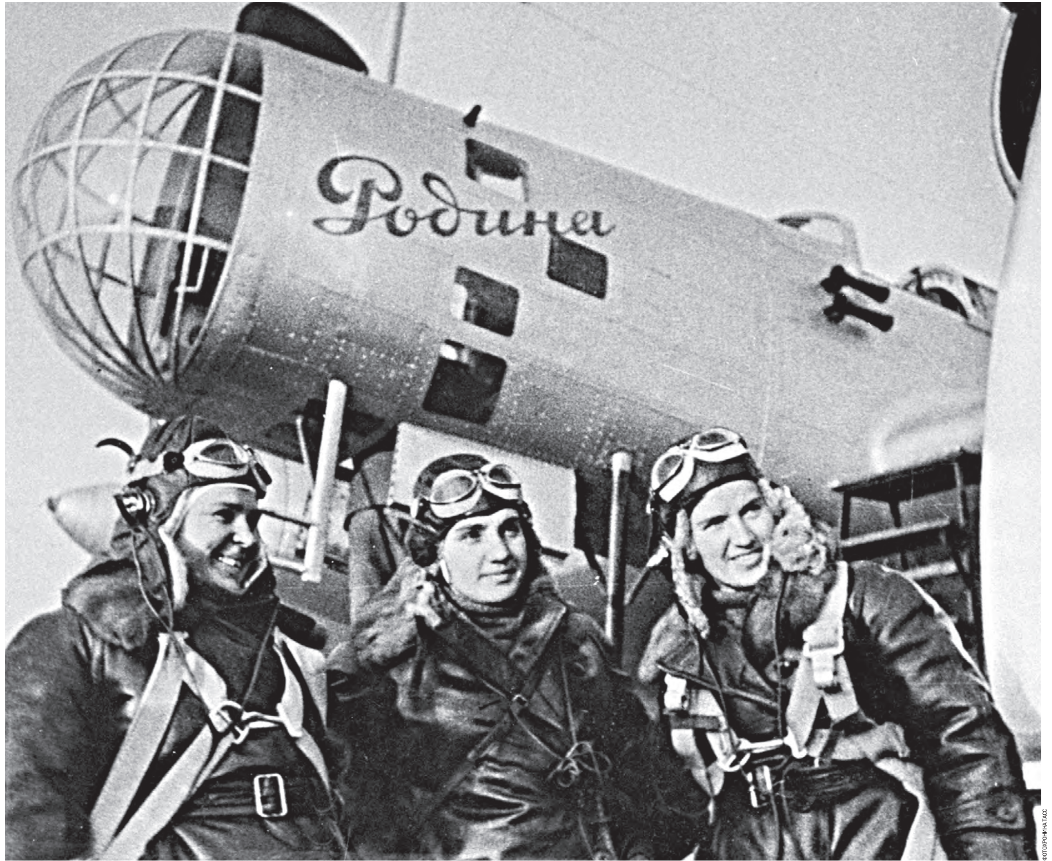
24 сентября 1938 года. Будущие Герои Советского Союза Марина Раскова (справа), Полина Осипенко (слева) и Валентина Гризодубова накануне беспосадочного перелета Москва — Дальний Восток

8 сентября 2016 года в Чертанове появился памятник женщинам — героиням обороны Москвы. На постаменте не летчица и не зенитчица, а девушка в валенках и телогрейке с киркой