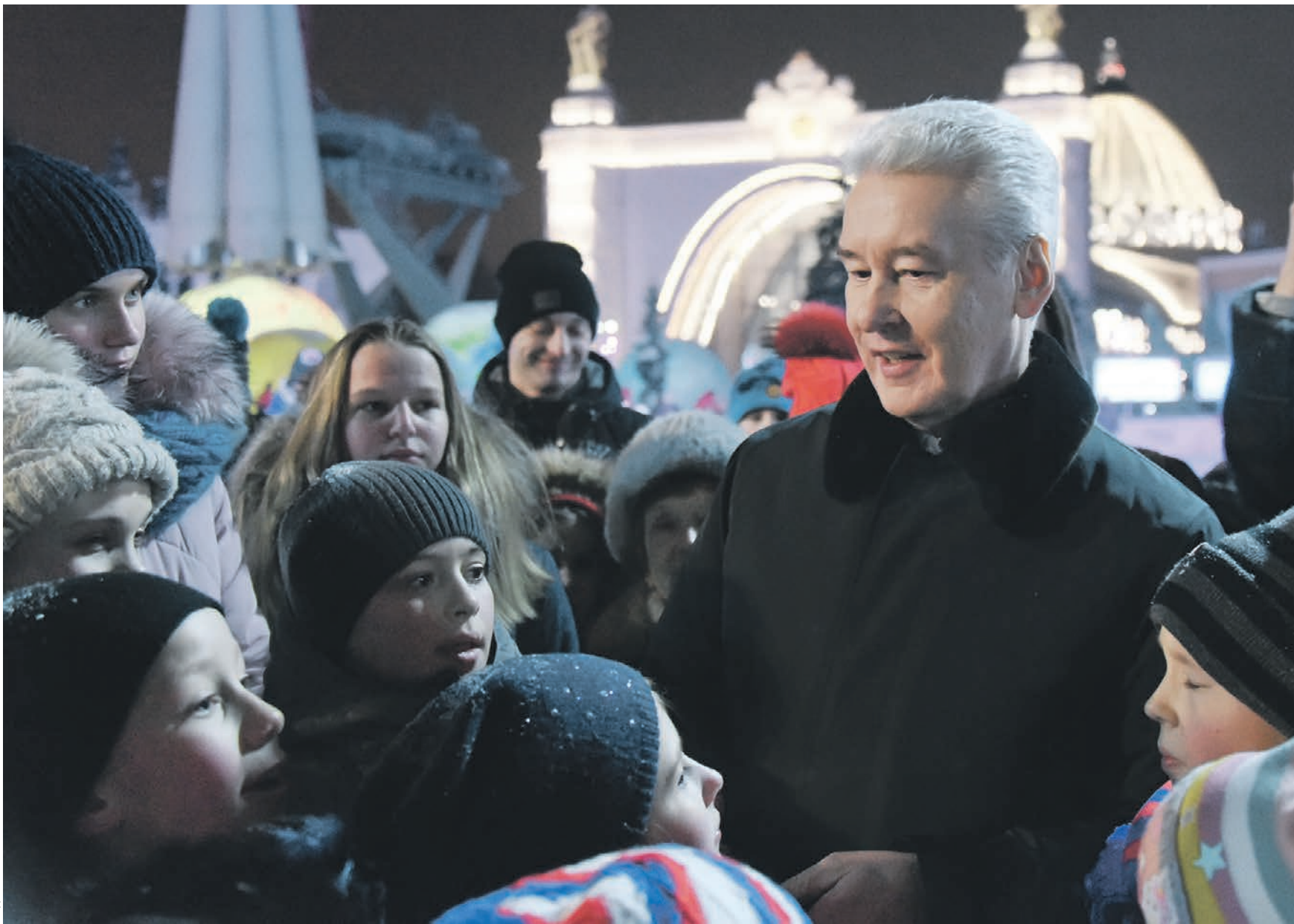
Вчера 18:04 Мэр Москвы Сергей Собянин (в центре) рассказал маленьким москвичам — посетителям катка «Ракета» — о площадках Города зимы, открывшихся на ВДНХ, а также спросил мнение детей о ледовом покрытии. В этом году Город зимы стал новым местом притяжения жителей и гостей столицы

Самый большой каток Город зимы на ВДНХ стал одним из главных мест притяжения москвичей и гостей столицы. Его самый большой объект площадью 8650 квадратных метров — молодежный каток «Ракета». Он рассчитан на 2400 человек. Глава города посетил каток и пообщался с маленькими москвичами. — Как вам лед, понравился? — спросил у ребят Сергей Собянин. — Да, — хором ответили дети. — Специальный детский каток для вас, — добавил мэр. — Очень много есть помимо катка: тюбинговая горка, керлинг и специальная площадка для игры в снежки. Сергей Собянин также отметил, что в Москве открыто большое количество катков, лыжных трасс, горок. — Все открылось и работает, — добавил он. — Дед Мороз дал в этом году столице хорошую зиму, чтобы все снежное и ледяное работало. По словам мэра Москвы Сергея Собянина, в столице целый праздник зимы, а на ВДНХ — свой собственный Город зимы. Отметим, что в течение сезона на катке «Ракета» пройдет множество развлекательных мероприятий. Например, можно будет провести новогоднюю ночь и увидеть шествие Дедов Морозов. Также в Городе зимы открыты еще несколько катков, работает ярмарка. Всех посетите-