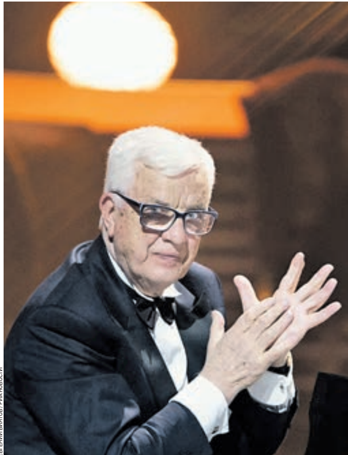
26 февраля 2016 года. Раймонд Паулс на творческом вечере «Святая и музыка любовь», посвященном 80-летию юбилею мастера

Раймонд Вольдемарович Паулс родился 12 января 1936 года в Риге. В 1953 году стал студентом исполнительского отделения Латвийской государственной консерватории, которую окончил в 1958 году. В 1962–1965 годах обучался композиции в Латвийской консерватории. Постоянными исполнителями песен Паулса стали Алла Пугачева, Лайма Вайкуле, Валерий Леонтьев. Песня «Миллион алых роз» на стихи Андрея Вознесенского в исполнении Аллы Пугачевой была переведена на многие языки мира. Раймонд Паулс был инициатором международных конкурсов молодых исполнителей «Юрмала» и «Новая волна». Раймонд Паулс — народный артист Латвийской ССР (1976), народный артист СССР (1985). Женат, есть дочь.