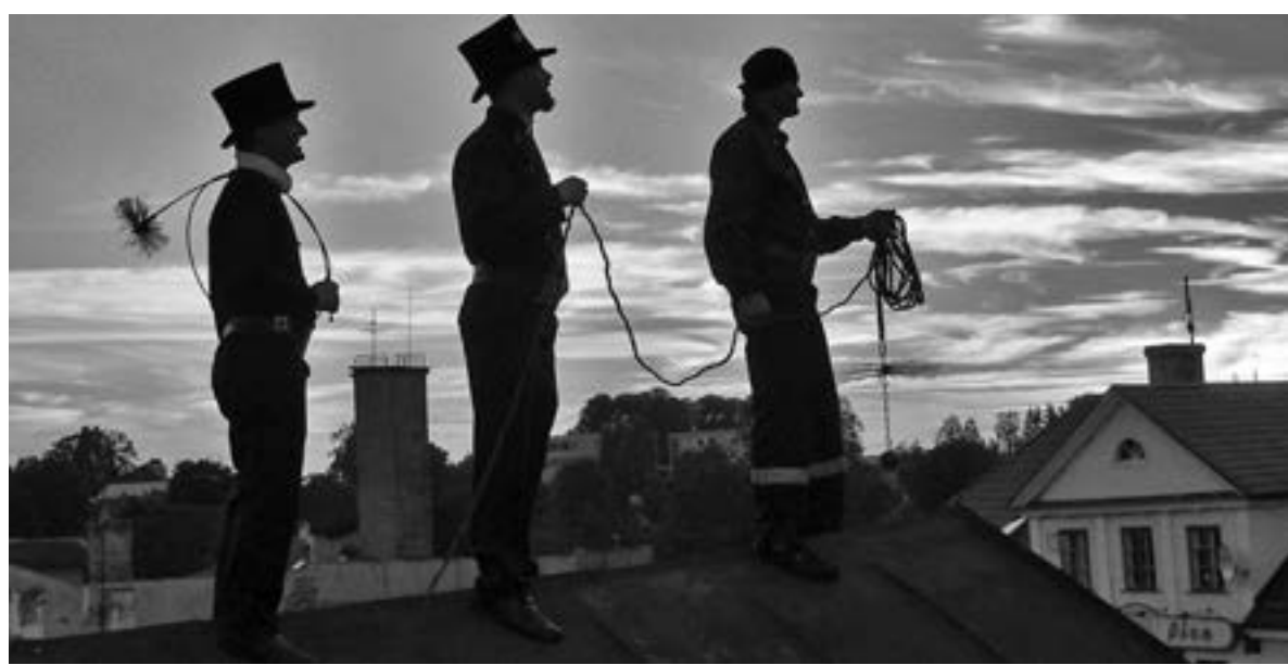
2017 год. Одна из работ московского фотографа Татьяны Линд проекта «Носнуться неба», посвященная трубочистам

Более шести лет московский фотограф Татьяна Линд снимает трубочистов. 45 черно-белых фотографий и историй, привезенных из разных стран. Работая над проектом о трубочистах, Татьяна сопровождала их почти везде — во время работы в многоквартирных и частных домах, на обедах, праздниках и парадах, на собраниях трубочистов и во время занятий по мастерству. Побывала она на многих крышах, повидала разные трубы и дымоходы, общалась с интересными людьми. — Работа трубочистов действительно важная, — говорит Та-