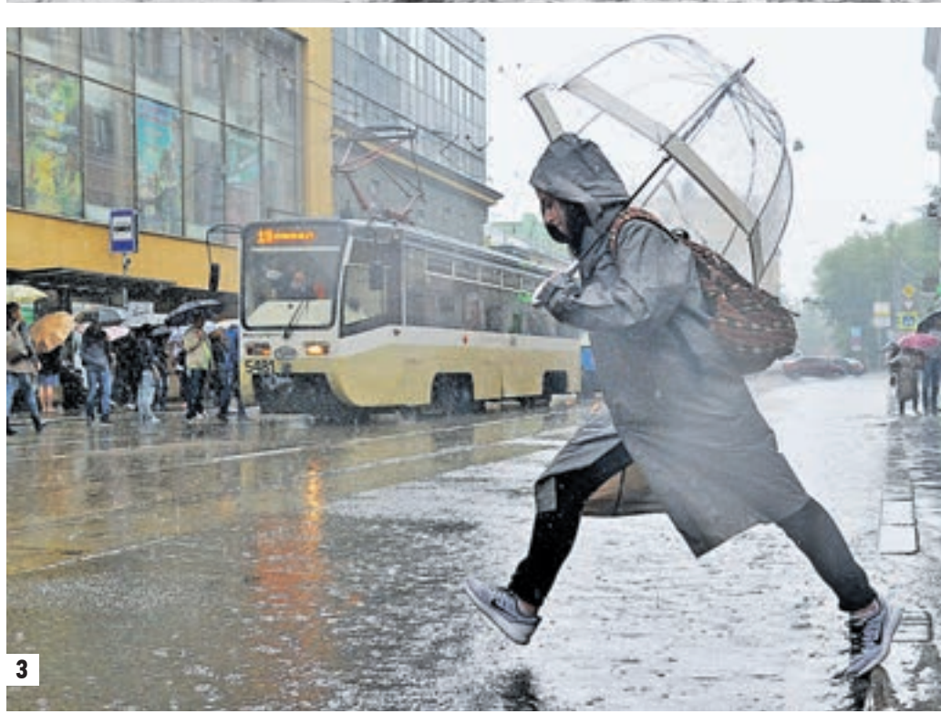
Апрель 1908 года. Повозки, точно речные трамвайчики, «плывут» после сильного ливня по Пятницкой улице столицы (1) 18 июня 1966 года. Нелегко приходилось и городским автобусам, застигнутым непогодой врасплох (2) 3 июля 2017 года. И спустя полвека на улицах Москвы появляются реки, которые пешеходам не перейти, но можно попробовать перепрыгнуть (3)