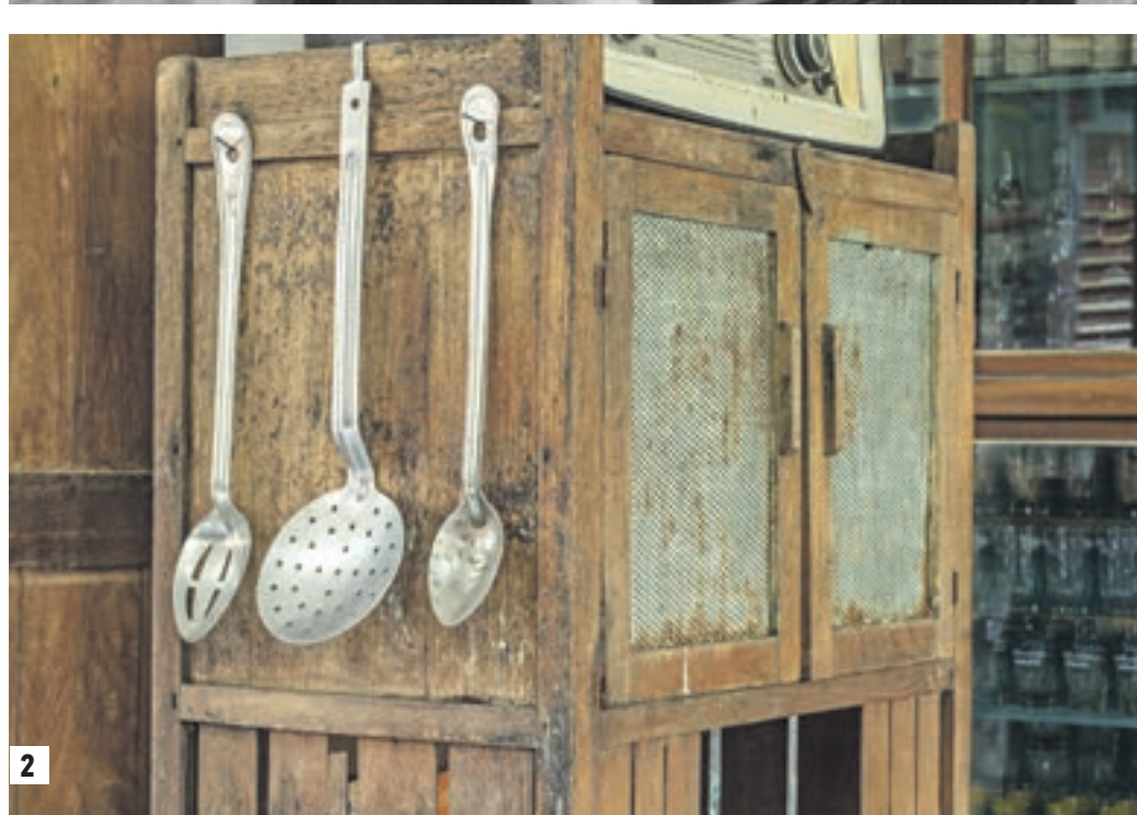
Стилизированные под старину вечеринки до сих пор прельщают молодежь своей неповторимой атмосферой (1). Продав старый сервант или комод, можно заработать приличные деньги (2)

ше, в каком направлении идти. Много обсуждали проблему фашизма, говорили о формировании новых ценностей. У нас же в стране не было такого перехода к новым реалиям. Серии о советском времени штампованы на Первом канале один за другим. Только о советской моде можно узнать сразу из трех многосерийных фильмов «Манекенщица», «Королева красоты» и «Красная королева», снятых в период с 2014 по 2016 год. Даже советскими маньяками можно «познакомиться», посмотрев несколько телесериалов, например «Мосгаз», снятый