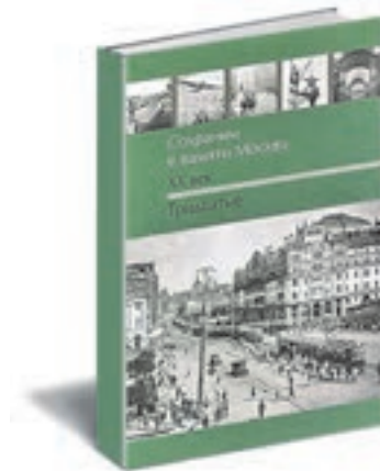
Сохраним в памяти Москву. XX век. Тридцатые/ Сост. Н. И. Дубровина, М. В. Радзишевская, Д. Б. Споров, С. Ю. Шокарев. М.: Галерея, 2015.

Картина московской повседневности (от основания города до первых двух десятилетий XX века). Подробности, которые обычно остаются за строками учебников. Про то, как до строительства водопровода москвичи ходили в ведром к фонтану и дрались там с местной мафией. Как единственную женщину оставили в 1908 году работать извозчиком, чуть не наказали. Как самым первым велосипедистам постановление Московской городской думы от 1903 года предписывало при встрече с экипажем «сойти с велосипеда и по возможности скрыть его от испуганной лошади». История города предстает не сусальной, не приукрашенной. И — очень живой.