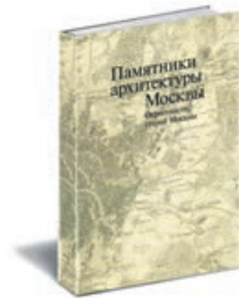
Памятники архитектуры Москвы. Окрестности старой Москвы/ Науч. ред. А. И. Комеч. М.: Искусство—XXI век, 2007.

Монография об истории крупнейшей в стране училища дизайна. Оно было создано в 1825 году по инициативе графа Строганова как «Школа рисовальная в отношении к искусствам и ремеслам». После революции Строгановку назвали ВХУТЕМАС (Высшие художественно-технические мастерские). Авторы книги сосредоточились в основном на ее истории советского периода. В монографии рассказывается о знаменитых выпускниках, о смене тенденций в советском дизайне, развитии, учебно-методических принципах школы и вызовах, которые стоят перед Московской государственной художественно-промышленной академией — так называется Строгановка сегодня.