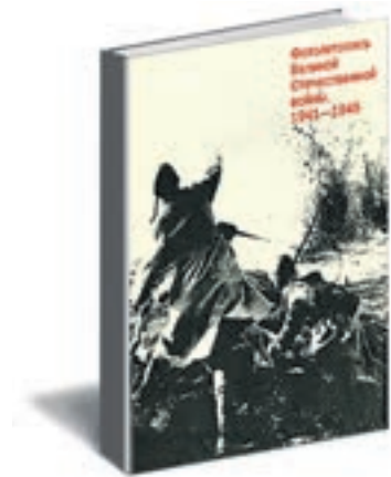
Фотолетопись Великой Отечественной войны. 1941–1945. М.: Мультимедийный комплекс актуальных искусств, Мультимедия Арт Музей, Московский дом фотографии, 2016.

У известного журналиста и московеда Льва Колодного сложилась целая серия книг, посвященных столичным бульварам. Уже вышли издания про Никитский и Тверской. Петровский бульвар, разбитый в начале XIX века на месте сломанных стен Белого города, не подвергался реконструкции, поэтому на нем и сегодня можно увидеть построенный Матвеем Казаковым дворец, в котором принимал император Павел I. Книга строится как череда рассказов о знаменитых зданиях — от торца бульвара до Трубной площади, — о событиях и судьбах людей, которые были с этими домами связаны. Многих героев книги Лев Колодный успел застать, а многим событиям — стать свидетелем.