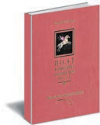
Поэт в России — больше, чем поэт. Десять веков русской поэзии. Антология. В 5 т./ Авт.-сост. Е. Евтушенко. М.: Русский Миръ, 2013–2015.

Описываются достопримечательности, расположенные в юго-востоке и южной частях города, от Камер-Коллежского вала (граница Москвы в XVIII веке) до МКАД. Это усадьбы (Измайлово, Куусково, Люблино, Коломенское, Узкое), церкви, часовни, кладбища (Калитниковское, Даниловское) и даже чудом сохранившиеся старинные жилые дома (например, дом на Измайловском шоссе, 4, выстроенный в первой половине XIX века). Книга иллюстрирована планами, чертежами и стильными черно-белыми фотографиями достопримечательностей.