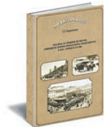
Бирюкова Т. З. Москва. От конки до метро. Очерки истории городского транспорта в XIX — начале XX в. М.: ОСТ ПАК Новые технологии, 2016.

Автор книги — известный журналист, москвед, много лет занимается поисками в библиотеках и архивах. Очерки об истории общественного транспорта написаны легким слогом и читаются на одном дыхании. Рассказывается о том, как прокладывали рельсы для конки (двухэтажного трамвая, который тянули по рельсам лошади), о планах и строительстве Московской окружной и Николаевской железных дорог, о том, как церковь вмешивалась в планирование трамвайного тоннеля под центром Москвы, о первых (неосуществленных) проектах метро.