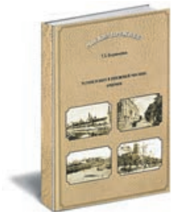
Бирюкова Т. З. Устои и быт в прежней Москве. Очерки. М.: ОСТ ПАК Новые технологии, 2016.

Автор книги — известный журналист, москвед, много лет занимается поисками в библиотеках и архивах. Очерки об истории общественного транспорта написаны легким слогом и читаются на одном дыхании. Рассказывается о том, как прокладывали рельсы для конки (двухэтажного трамвая, который тянули по рельсам лошади), о планах и строительстве Московской окружной и Николаевской железных дорог, о том, как церковь вмешивалась в планирование трамвайного тоннеля под центром Москвы, о первых (неосуществленных) проектах метро.