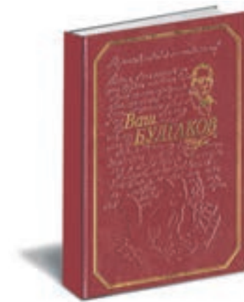
Булгаков М. А. Ваш Булгаков. Собрание сочинений: повести, романы, рассказы, драматургия. Хроника жизни и творчества. М.: Редакционно-издательский центр «Классика», 2016.

Книга состоит из разделов «Начало», «Перелом», «Победа» и «70-летие Великой Победы», а каждый из них делится на части под названиями: «На земле», «В небесах», «На воде». Детям будет интересно узнать, что о войне писали не только Константин Симонов, Борис Полевой, Юлия Друнина, но и Анна Ахматова, и Сергей Михалков, и Самуил Маршак. Есть много рассказов и стихов таких авторов, чьи имена у детей явно не на слуху. Так что маленькие читатели наверняка откроют для себя много нового.