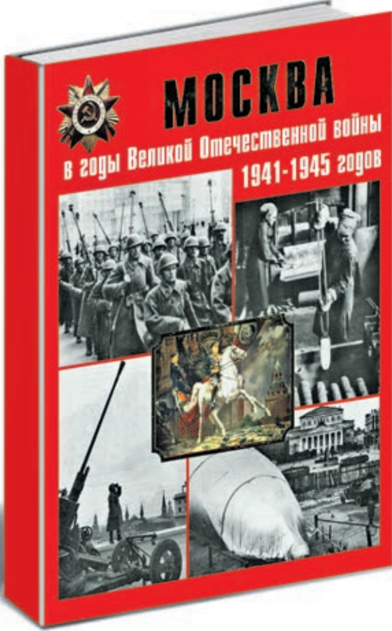
Москва в годы Великой Отечественной войны 1941–1945 годов. Энциклопедия. М.: Планета, 2015.

В книге рассказывается о возрождении керамического промысла на рубеже XIX–XX веков, о гончарном заводе «Абрамцево», Товариществе Кузнецова, керамической мастерской Строгановского училища, артели гончаров-художников «Мурава». Без их продукции нельзя себе представить московскую архитектуру эпохи модерна. Разумеется, большую часть книги составляют красочные иллюстрации, ведь все эти плитки, изразцы и облицовочные панно лучше один раз увидеть, чем сто раз о них прочесть.