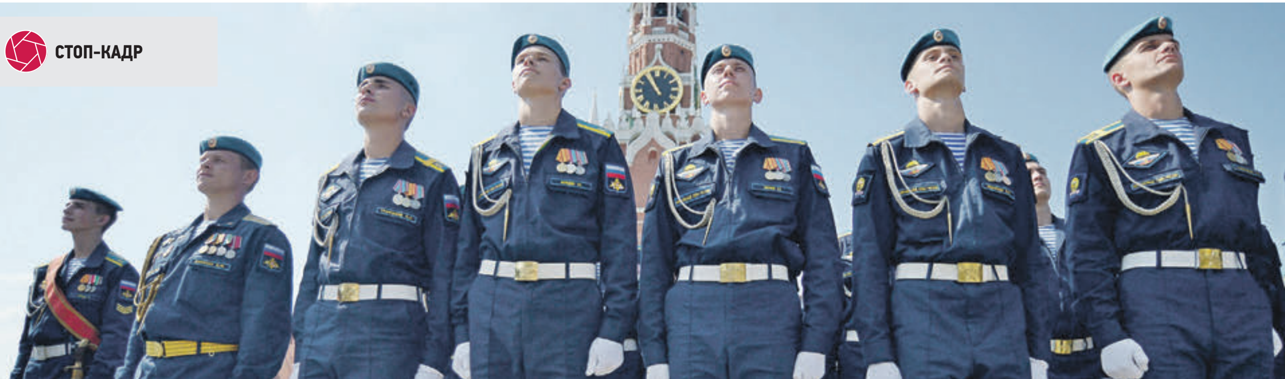
Вчера 11:00 Красная площадь. Бойцы Воздушно-десантных войск прошли парадом по улице Ильинке от храма Ильи Пророка, покровителя русского воинства, а в особенности десантников. В программе празднования состоялись показательные выступления бойцов Рязанского высшего воздушно-десантного командного училища. На мероприятие пришли как ветераны десантуры, так и совсем юные участники — воспитанники военно-патриотических клубов.