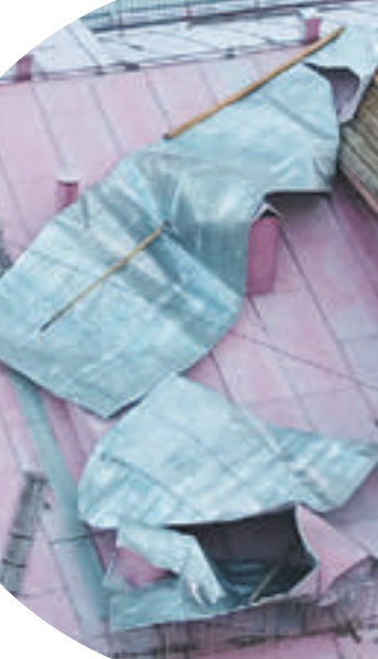
15 июля 20:12 Металлические листы, сорванные ураганным ветром с крыши дома на проспекте Мира

Мы закупили все необходимые материалы. Идет работа по замене поврежденных металлических листов. Ремонт будет завершен в конце месяца.