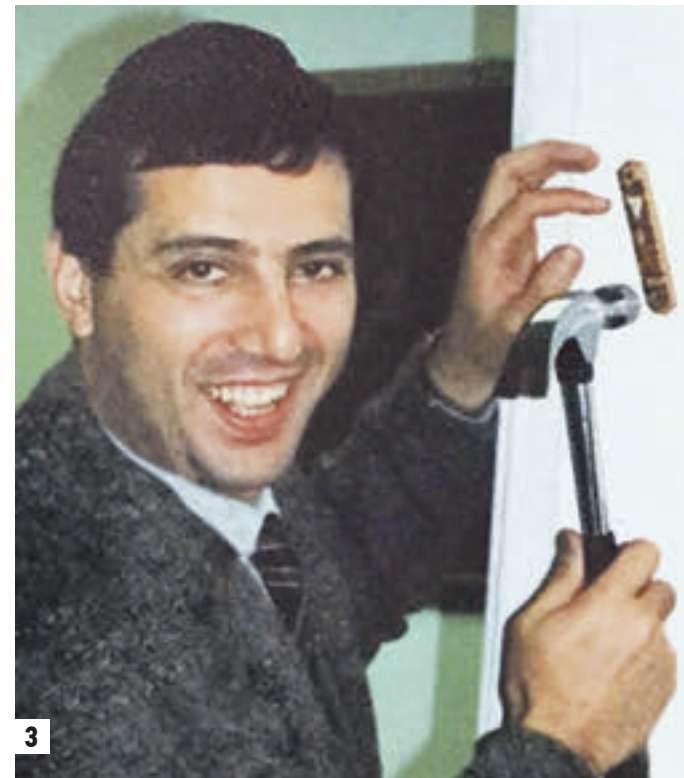
Май 2016 года. Цви Хейфец с супругой Сигалие на посольском приеме по случаю Дня независимости Израиля (1) Ноябрь 2015 года. Вручение верительных грамот. Посол Израиля Цви Хейфец (слева), президент РФ Владимир Путин, министр иностранных дел РФ Сергей Лавров (на заднем плане) (2) Сентябрь 1989 года. Участник консульской группы Цви Хейфец прибывает традиционную мезузу (свиток, содержащий молитву) у дверей будущего посольства (3)

В кабинете посла все предельно функционально. Письменный стол, полки для бумаг, массивные стулья. В противоположном конце помещения — невысокий столик, мягкие кресла, софа — уголок отдыха. Везде уютно и рационально. Господин посол, вы как-то говорили о том, что в 1989 году в составе группы израильских дипломатов находились в Москве. Это был другой город и другая страна. За это время изменилось многое. Что поразило вас в сегодняшней Москве, а что не очень?