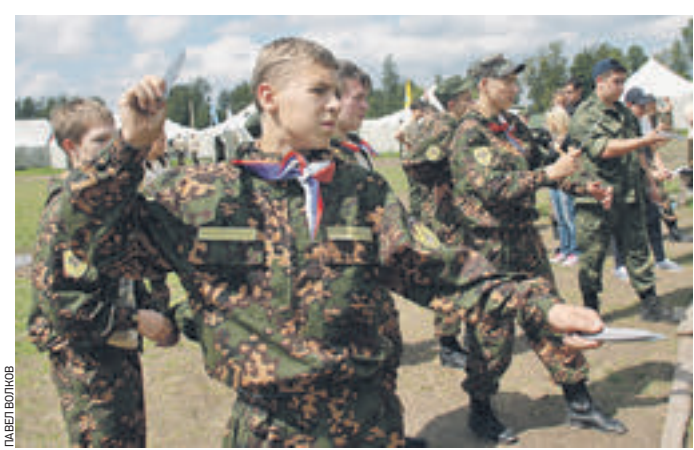
23 июля 12:00 Открытие третьей смены в лагере «Бородино-2016». Здесь ребята не только отдыхают, но и тренируются

Актёр Станислав Дужников шомполом чистит пушку, заряжает и подносит огонь к фитилю. Раздается выстрел. Ребята окружают любимого актёра. Так началась третья смена в военно-патриотическом лагере «Бородино-2016». Смену открывает Герой России Игорь Задорожный. — Лагерь находится на священной для россиян земле, — обратился он к ребятам. — Здесь проходили не только бои за Москву во время Отечественной войны 1812 года, но и во время Великой Отечественной войны. Здесь каждый клочок земли пропитан историей. И вы можете прикоснуться к ней. Лагерь расположен на одном из полей, где проходило Бородинское сражение. Здесь установлены 15 палаток для мальчиков и четыре — для девочек. — К нам приехали 350 детей не только из столицы, но из разных регионов страны, — рассказывает заместитель руководителя лагеря Дмитрий Артюхин. Смена длится две недели. За это время будут организованы реконструкции