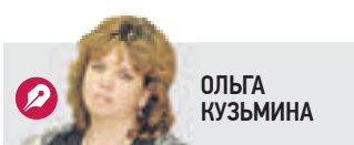
Обозреватель и колумнист «Вечерней Москвы»

Анатолий Михайлович — все такой же волшебный, даже помолодевший, с какими-то невероятными просветленными чертами брутального лица и все той же челючкой. Он все так же величественен, многозначителен и уверен в себе. На экране он предстает, правда, в несколько ином качестве: ныне он не просто врач-психотерапевт, на прием к которому воле телеэкранов столы когда-то едва ли не все жители порушенной России, а судья и «эксперт в области непонятого и необъяснимого». То есть всего того, что «выходит за рамки человеческого понимания». Рамки этого понимания у всех разные. У меня они, очевидно, сужены: смотреть психовещателя — скучно, и для меня его второе пришествие — очень печальный символ абсолютной смуты и сумятицы в уставших от негатива головах.