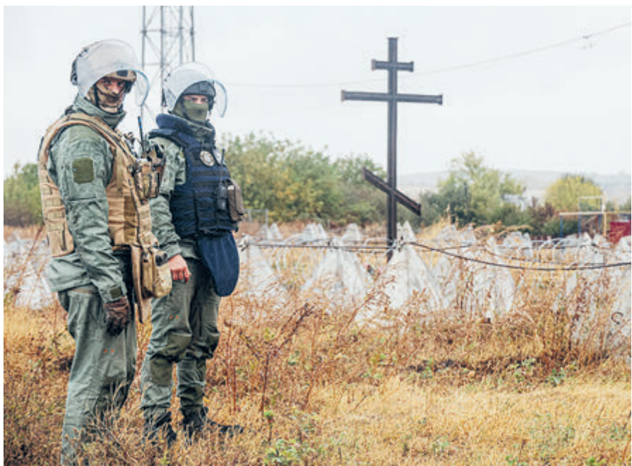
Курская область. Саперы сводного отряда разминирования МЧС России во время обезвреживания участка за работой.

Обратим внимание вот еще на что: вручение награды за «укрепление» состоялось всего через месяц после 6 августа, когда отряды ВСУ без особых проблем прошли тот самый «укрепрайон» с липовыми рвами и