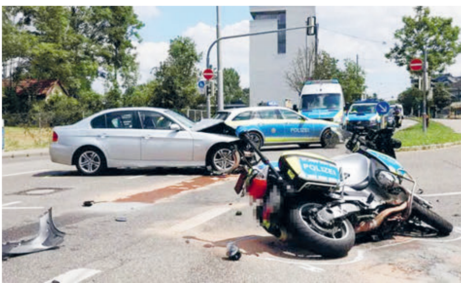
Место смертельного ДТП с кортежем Виктора Орбана.

Как сообщила Bild, Орбан накануне посетил матч чемпионата Европы между Венгрией и Шотландией в Штутгарте. А 24 июня кортеж премьер-министра Виктора Орбана попал по дороге в аэропорт в аварию. Она произошла по вине местной жительницы, не заметившей оцепления и выехавшей на дорогу, где несся кортеж. Ее автомобиль врезался в колонну, сбив двух полицейских на мотоциклах. Один из них, 61-летний, погиб, второй, 27-летний, тяжело травмирован. Возможно, по оценке Spiegel, патрульные, приняв на себя тяжелый удар, нацеленный в борт машины Орбана, тем самым спасли ему жизнь.