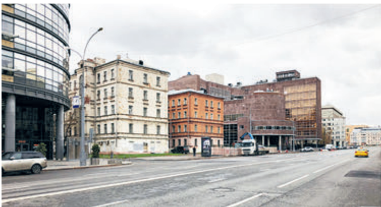
Ради небоскреба (фото сверху) два дома (на фото внизу) подлежат сносу. А ведь их в свое время пощадил Ле Корбюзье.

Лубянки к Садовому кольцу, и прилегающий участок Бульварного кольца полны разнообразных памятников архитектуры и просто великолепных зданий. Это и классицистические усадьбы, и строения эпохи модерна – сразу несколько глав истории строительства Москвы.