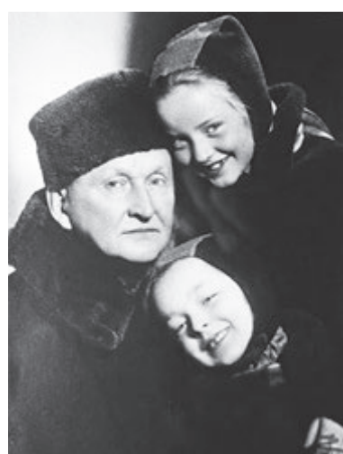
Вертинский с дочками.

Вертинский, вернувшись с фронта по ранению, дебютировал в Москве в Арцыбушевском театре миниатюр с «Песенками Пьеро». А последний его концерт состоялся 21 мая 1957 года в Ленинграде. В тот же день Александр Николаевич скончался от острой сердечной недостаточности в гостинице «Астория». Ему было 68