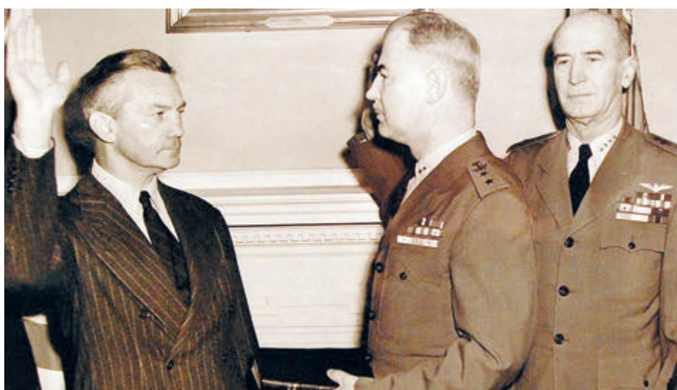
Тот самый генерал Джеймс Форрестол (слева), который в борьбе с «русской угрозой» сошел с ума.

Интересно, что страны G7 дружно вспоминают про демпинг, правила ВТО,