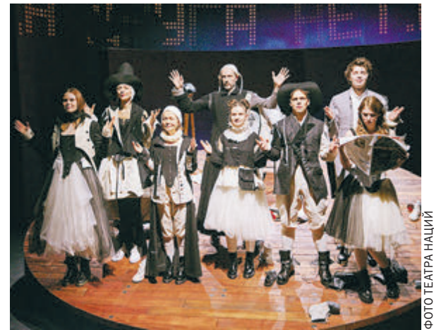
ФОТО ТЕАТРА НАЦИЙ

Постановка «Дама, чье место по центру» предельно динамична. Ее площадкой стало Арт-кафе Театра на Юго-Западе.