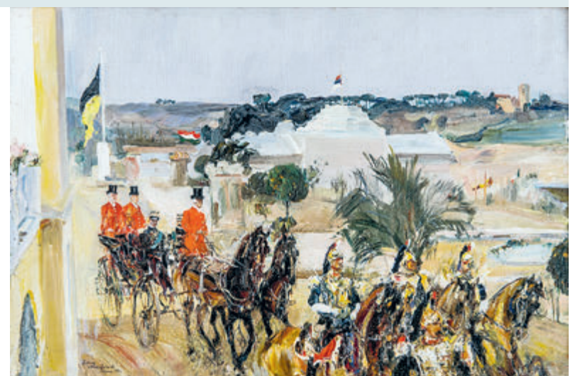
Эти полотна Кустодиева (слева) и Никифорова украсят любой музей.

А вот в «Парижское кафе», в отличие от сказочного «Садко», Репин вложил много чаяний, стремясь отразить дух времени, передать удивление вольными нравами. Живой сцены, как у новаторов-французов, не вышло. Однако теперь это полотно, купленное за миллионы, украшает частный музей одного из олигархов, а на выставке нам достались репинские эскизы из парижских кафе и улиц дореволюционной России в национальном костюме – дань увлечения этнографической темой.