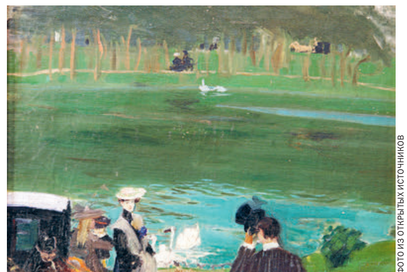
ФОТО ИЗ ОТКРЫТЫХ ИСТОЧНИКОВ

Рассказ идет о многих судьбах, порой блестящих, порой трагических. Александр Яковлев, о революции узнавший в Пекине, к родным пенатам не вернулся. Показавший в Париже серии работ из поездки по Дальнему Востоку, а затем из экспедиций в Африку и Азию под эгидой фирмы «Ситроен», создавший большой портрет балерины Анны Павловой, этот «отличник» добился успеха, но в 50 лет умер от рака. Зато его племянница модельер Татьяна Яковлева, французская возлюбленная Маяковского, дожила до 1990-х.