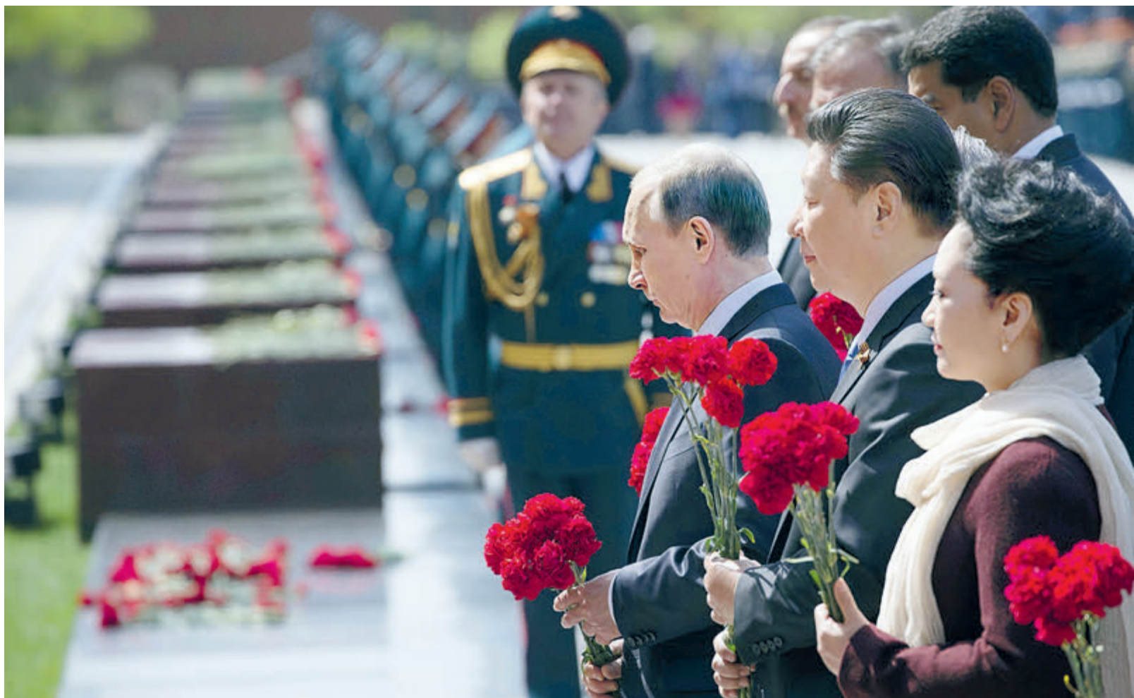
Владимир Путин и Си Цзиньпин с супругой Пэн Лиюань у Могилы Неизвестного солдата.

Проложим дорогу и, преодолев трудности и опасности, снова отправимся в путь. Какой бы хаотичной ни была международная обстановка, сколько бы подъемов и препятствий ни пришлось преодолеть на пути вперед, китайско-российские отношения, подобно скале, останутся твердыми и нерушимыми. Я твердо верю, что под мудрым руководством председателя Си Цзиньпина корабль великого возрождения китайской нации поднимет паруса и отправится в дальнейшее плавание, будет способен противостоять любому шторму и реализует китайскую мечту о великом возрождении китайской нации. Я также твердо верю, что под руководством глав Китая и России обе державы будут сохранять стратегическую решимость, твердо двигаться вперед, неуклонно содействовать поддержанию многополярности мира и демократизации международных отношений, реализовывать великую цель совместного развития и возрождения, а также привносить больше стабильности и определенности в хаотичный мир.