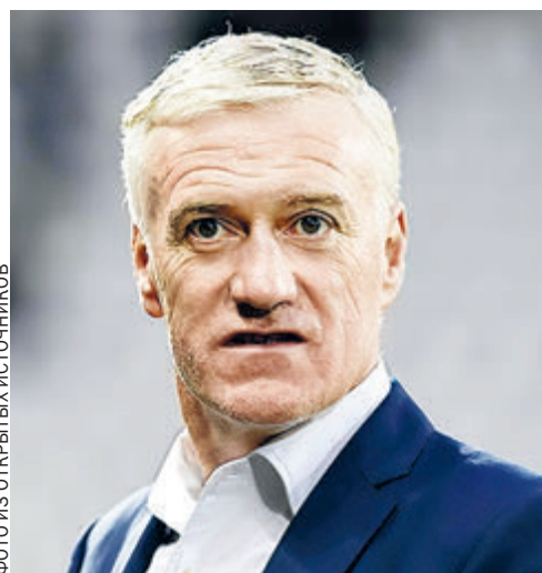
Три звездных фигуры: Дешам, Моуринью, Зидан — и примкнувший к ним Штрайх.

И вот Мартинеса сразу «подобрали» португальцы, которые связывают с ним большие надежды. А тот, в свою очередь, начал работу на новом месте с дотошных бесед с каждым из кандидатов в сборную, включая Криштиану Роналдо. На пост главного тренера сборной Бельгии сейчас рассматриваются экс-наставник «Ювентуса» Андреа Пирло и один из лучших форвардов в истории