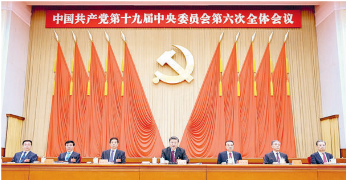
С 8 по 11 ноября в Пекине прошел Шестой пленум ЦК КПК 19-го созыва.

12 ноября прошла пресс-конференция Центрального комитета Коммунистической партии Китая, посвященная итогам Шестого пленума ЦК КПК 19-го созыва, который завершился 11 ноября