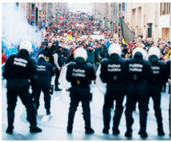
Брюссель. Ноябрь 2021 года.

Чувство эйфории по поводу избавления от пандемии, охватывающее народы и страны после очередной волны коронавируса, напрасно и опасно, ибо ведет к потере бдительности, несоблюдению эпидемиологических требований, росту заболеваемости и делает неизбежной новую вспышку, еще более массовую, чем раньше. К такому неутошительному выводу пришел директор Европейского бюро ВОЗ Ханс К्लюге. Он уверен, что четвертая волна COVID-19 в Европе этой осенью обусловлена тремя факторами – штаммом «дельта», отказом населения от вакцинации и ослаблением карантинных ограничений.