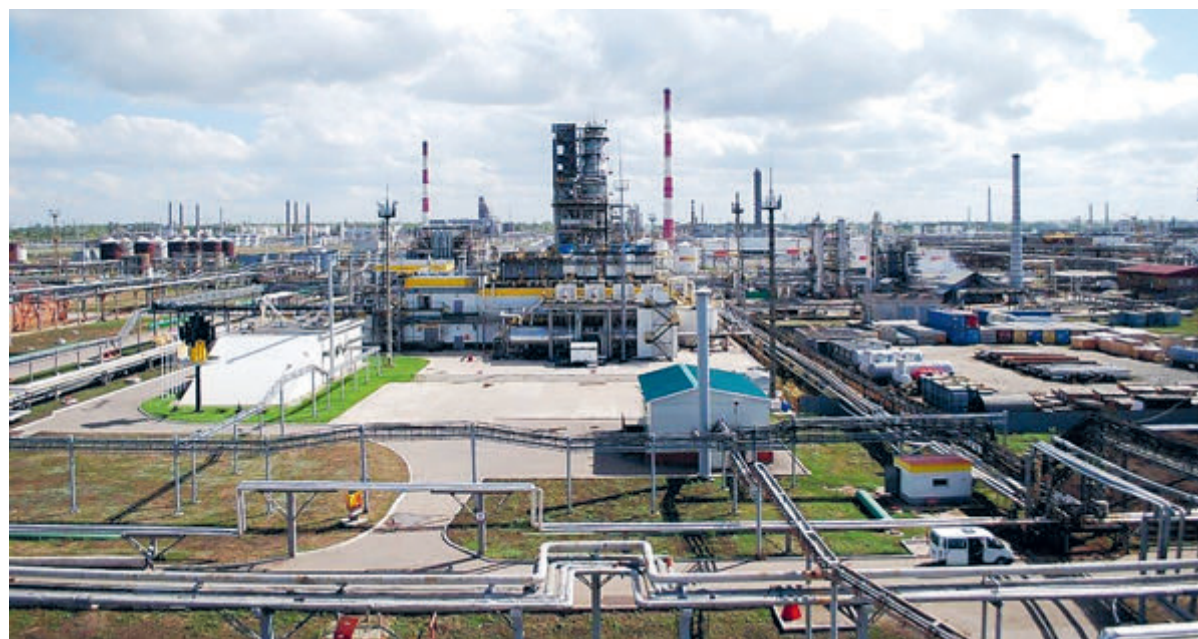
Новокуйбышевский НПЗ был признан «Лучшим экологически ответственным градообразующим предприятием».

Для повышения эффективности управления и минимизации воздействия производственной деятельности на окружающую среду «Роснефть» за последние три года направила более 122 млрд рублей инвестиций в реализацию программ повышения рационального использования попутного нефтяного газа, повышения надежности трубопроводов, строительство очистных сооружений и т. д. Как заявили в нефтяной компании, «Роснефть» ставит перед собой амбициозные долгосрочные цели в рамках климатической повестки. Для выстраивания системной работы по их достижению были разработаны долгосрочные мероприятия, что свидетельствует о повышенном внимании к защи-