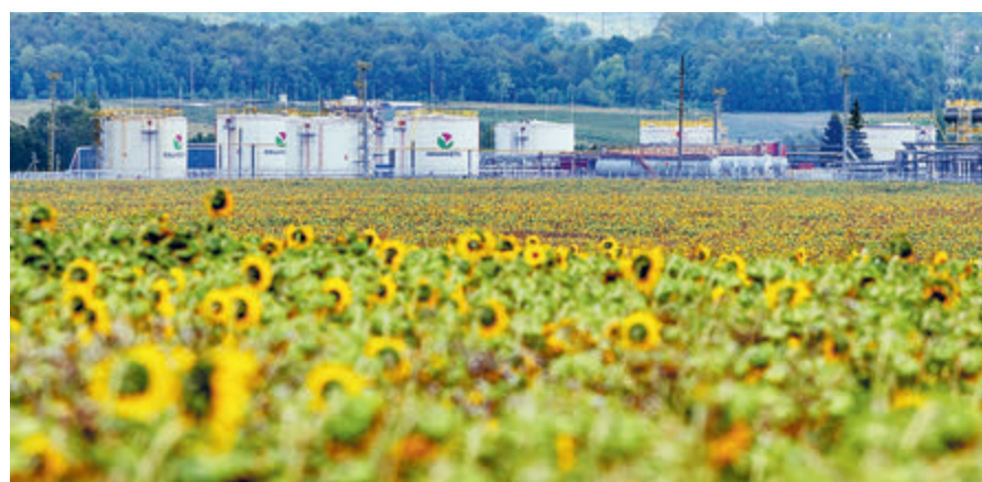
На работающем под управлением «Роснефти» нефтегазодобывающем и перерабатывающем комплексе «Башнефть» в части экологичности производства удалось добиться значительных успехов.