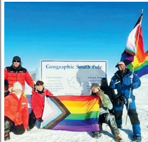
Украинские полярники внесли свой вклад в исследование Антарктиды.

Впрочем, далеко не все соотечественники оценили этот порыв. Вот характерные комментарии украинцев в Сети: «И все это происходит за деньги наших налогоплательщиков. Нет слов... Не позорьте льды!.. Лет двадцать пытался понять, чем занимается наша «фундаментальная наука» в Антарктиде. Теперь понял. Прививают толеранцию пингвинам. Академика Вернадского, правда, жаль...»