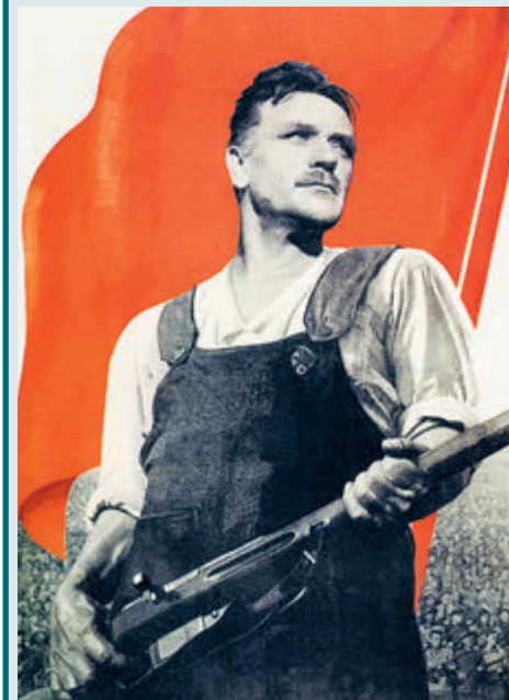
ЕСЛИ ЗАВТРА ВОЙНА...

– Мы наблюдаем повышение ставок как со стороны Вашингтона, так и со стороны Москвы. Если сейчас кто-то не уступит, логика эскалации заставит