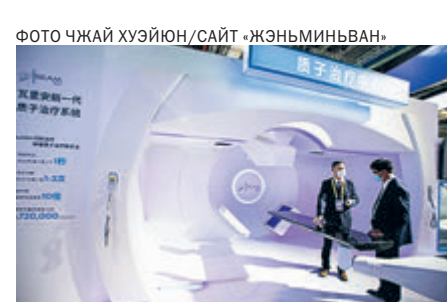
Участники посетили первый в мире лечебный центр протонной терапии в рамках Четвертого импортного ЭКСПО.

ведущих отраслевых предприятий, а также много средних малых и микробизнеса. В мероприятии приняли участие развивающиеся страны, государства вдоль «Одного пояса, одного пути», а также наименее развитые страны.