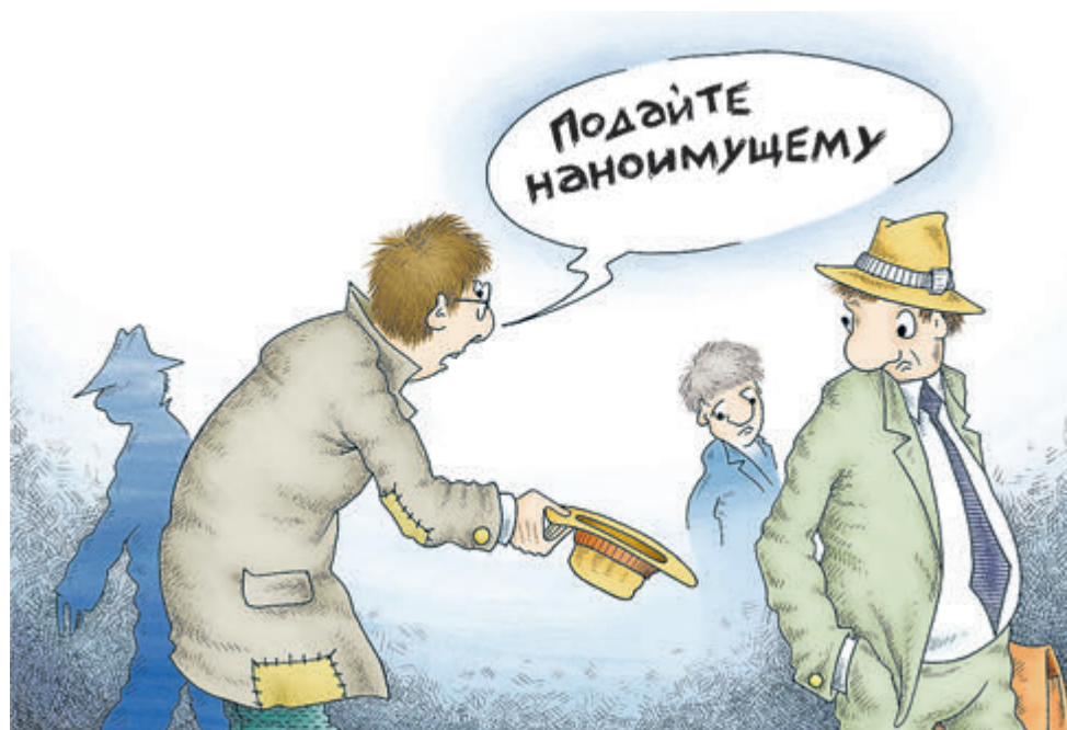
ИЛЛЮСТРАЦИЯ АЛЕКСАНДРА ШИМДТ/CARTOONBANK.RU

должить верить в российские государственные компании. Многие банки, фонды, в том числе негосударственные и пенсионные, инвестировали в эти бумаги, поскольку они считали, что это надежное вложение, рассчитывали на государственные гарантии.