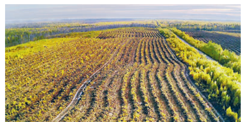
Около 13 млн саженцев деревьев высадили сотрудники дочерних обществ «Роснефти» за 2018–2021 годы.

Предприятия «Роснефти» с начала 2021 года собрали и сдали на вторичную переработку более 200 тонн бумаги и картона. Из такого количества макулатуры можно изготовить более 5 млн школьных тетрадей. Каждая тонна переработанной бумаги позволяет сберечь 1000 кВт электроэнергии и 200 м³ воды. Вторичное сырье на предприятиях «Роснефти» собирают в специальные контейнеры, которые установлены во всех административных зданиях. Затем бумагу измельчают и направляют на заводы для вторичного использования. После переработки из очищенного сырья производят новую продукцию. В 2020 году предприятия компании поэтапно переходят на электронный документооборот, сокращая потребление бумаги и повышая углеродную нейтральность.