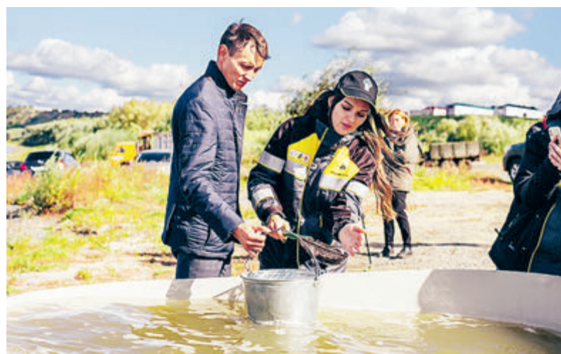
В 2021 году сотрудники компании выпустили в реки и озера более 117 млн выращенных в рыбобитомниках мальков.