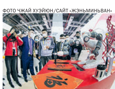
Интеллектуальный робот использует кисть для написания китайских иероглифов.