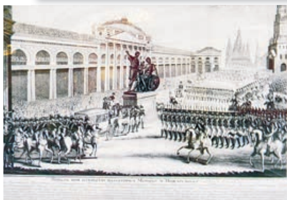
Парад при открытии памятника. Гравюра XIX века.

автор настоял на Красной площади. Удивительно, но последнее слово осталось не за царем.