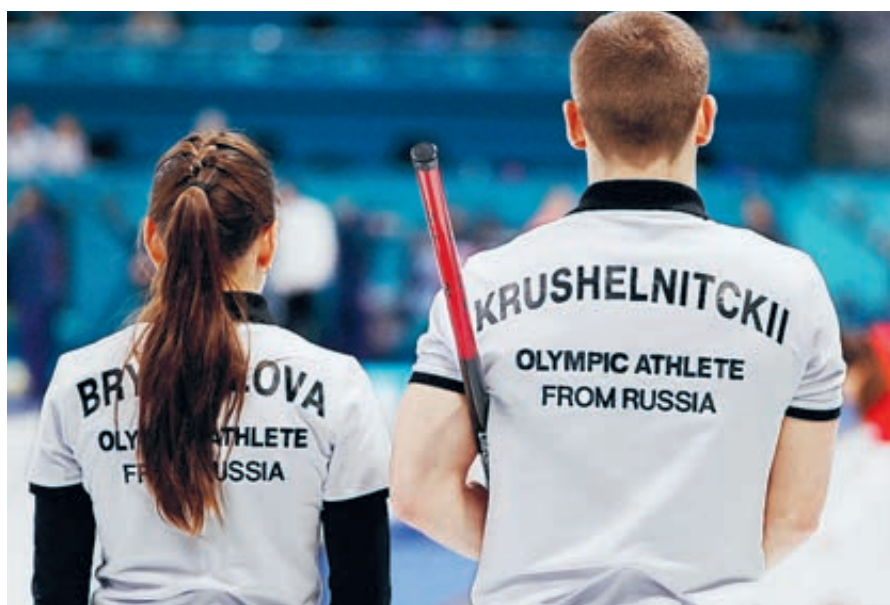
Наша сборная по керлингу начала Олимпиаду с поражения. Но есть еще шанс все исправить.