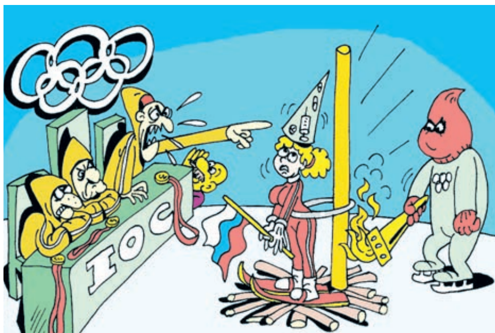
ИЛЛЮСТРАЦИЯ ИГОРЯ КОЛГАРЕВА, GARTSOOLBANK.RU

Нынешние Игры – вовсе не исключение. На фоне скандалов, связанных с дискредитацией рос-