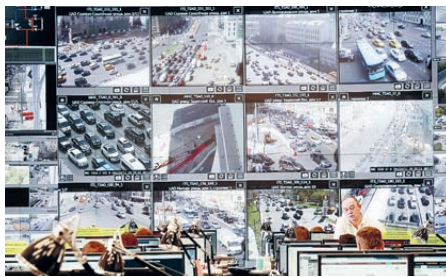
Так выглядит работа ситуационного центра ЦОДД.

Помилуйте, господа, речь идет всего лишь о соблюдении закона и элементарной справедливости! Ведь процедура обжалования и сейчас могла бы быть не столь сложной, если бы ГИБДД, суды и другие органы исполняли законы РФ. Посудите сами, куда уж проще? Получил автовладелец, как он считает, необоснованный штраф, зашел на сайт ГИБДД, где есть соответствующий сервис обращений, написал в течение 10 дней