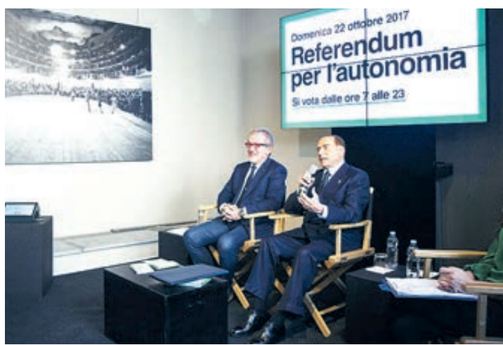
Бывший премьер-министр Италии Сильвио Берлускони посетил мероприятие, посвященное предстоящему консультативному референдуму в Венето и Ломбардии.