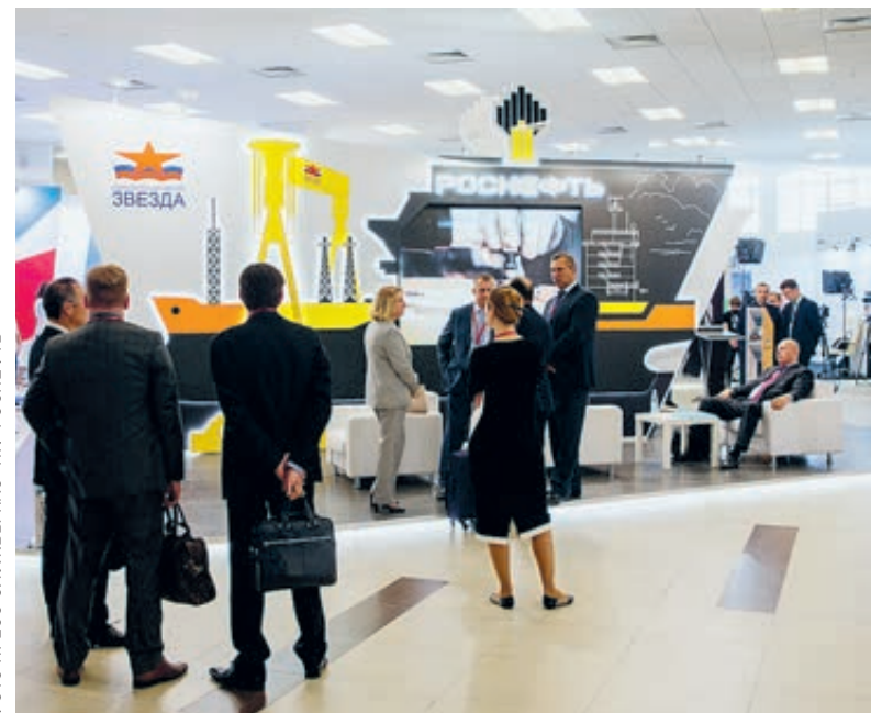
Стенд «Роснефти» на ВЭФ-2017.

узем вторую очередь, возможно, с нефтехимической направленностью, – заявил он. Сечин также отметил, что Essar Oil стал объектом острой конкурентной борьбы. «На приобретение Essar были нацелены ряд крупнейших международных корпораций, в том числе и региональных, – отметил глава «Роснефти». – Нам удалось одержать победу в конкурентной борьбе. Конкуренция возникла по объективным причинам, потому что состав активов, входящих в Essar, очень серьезный. Речь идет о 20 млн тонн переработки на территории Индии, в районе города Вадиар. Это новый завод сочень хорошиими показателями. Индекс сложности Нельсона – 11,8. Это один из лучших заводов, входящих в десятку мировых предприятий с наилучшими возможностями по работе с разными сортами нефти. Кроме того, в состав активов входит глубоководный экспортно-импортный порт, который позволяет напрямую поставлять необходимое сырье, а также экспортировать нефтепродукты. Существенным дополнительным элементом является сеть из 3,5 тысячи заправок на индийском рынке, который отличается высоким уровнем либерализации и эффективностью».