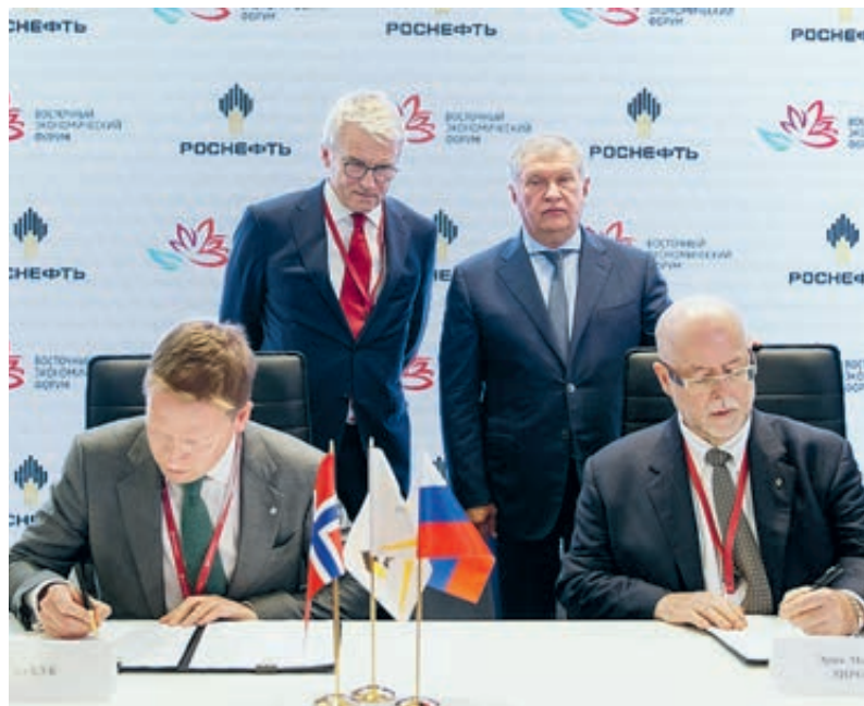
Подписание перспективного соглашения «Роснефти» со Statoil.

Научно-исследовательская экспедиция «Кара-Лето-2017», стартовавшая из порта города Мурманска, отработает в Баренцевом и Карском морях системы управления ледовой обстановкой, такие как буксировка айсбергов с помощью каната и специальной сети