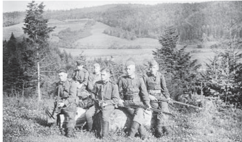
Военнослужащие МГБ СССР в районе села Смилница (Львовская область) во время ликвидации формирований ОУН-УПА, 1947 год.

Но вскоре автор переходит совсем к другим фактам, ради которых, собственно, и затевался этот документ. «В ряде населенных пунктов под влиянием немецко-фашистской агитации население враждебно относится к мероприятиям советской власти и командования Красной армии. В отдельных случаях от-