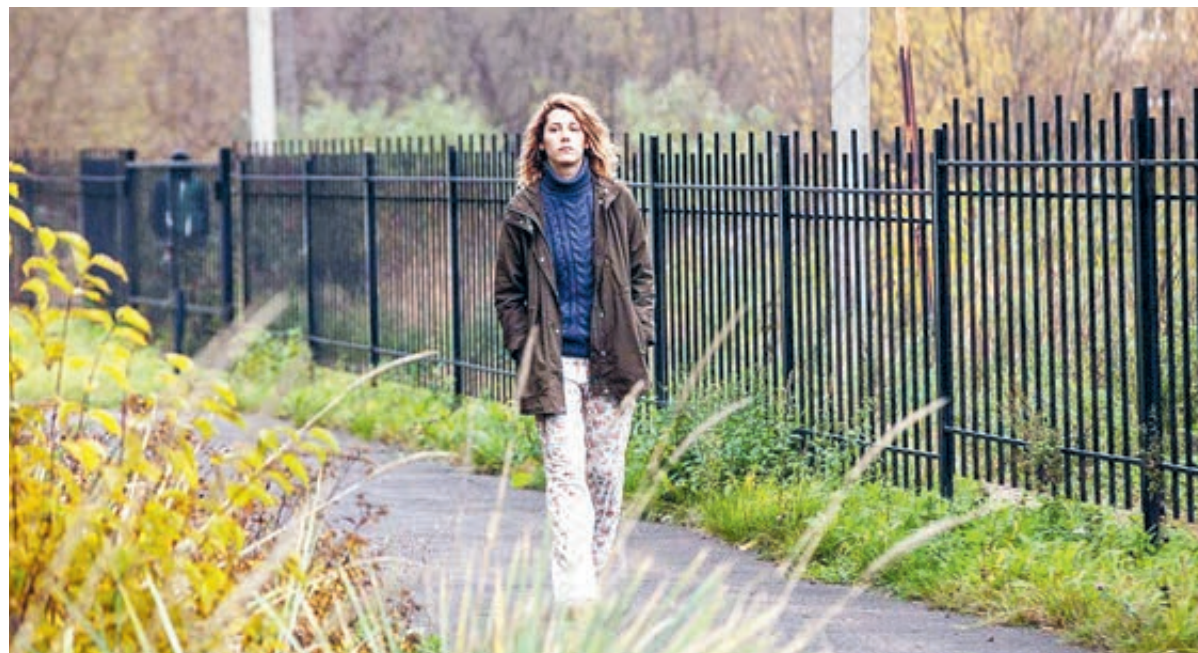
Ирина Горбачева в фильме «Аритмия».

В программе Уралкинофеста было заявлено порядка 130 картин. В течение недели они шли с утра до ночи в десяти лучших кинотеатрах города. Еще десяток кинотеатров открыли свои двери для фестиваля российского кино в других городах области – Нижнем Тагиле, Асбесте, Первоуральске, Красноуфимске, Верхней Пышме. На сеансах побывали 36 тысяч зрителей, которые заранее озаботились приобретением билетов с местами. Едва ли не столько же сидели в проходах, на приставных стульях, висели, что называется, на люстрах. Благо сеансы были бесплатными – об этом позаботилось руководство области.