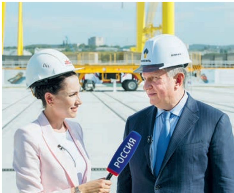
Игорь Сечин дает интервью каналу «Россия».