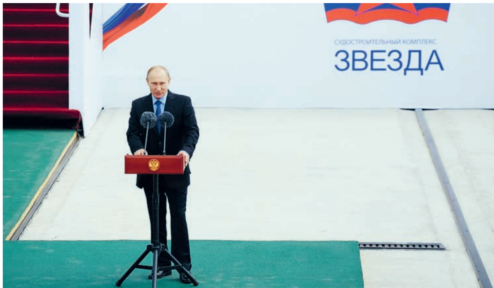
Глава государства отметил, что судоверфь «Звезда» – это масштабный проект, значимый для всей страны, который уверенно развивается, идет вперед.

Глава государства отметил, что судоверфь «Звезда» – это масштабный проект, значимый для всей страны, который уверенно развивается, идет вперед. «Работы на предприятии выполняются по графику, уже начато строительство судов и морской