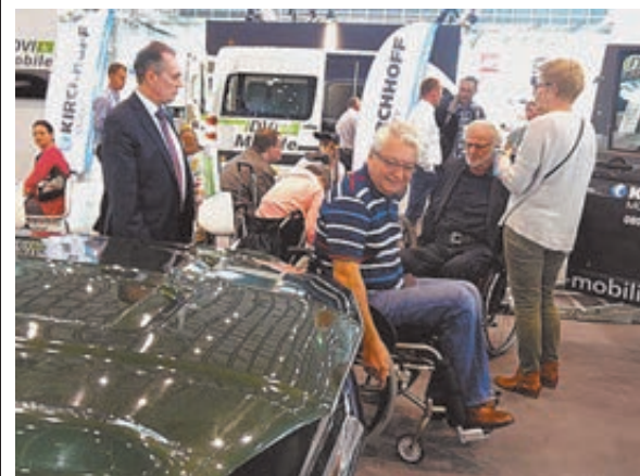
На ярмарке в Дюссельдорфе инвалиды чувствуют себя в своей тарелке.

Впрочем, в кулуарах и не для печати назывались и другие тому причины. Например, в Германии генетические механизмы, губитель-