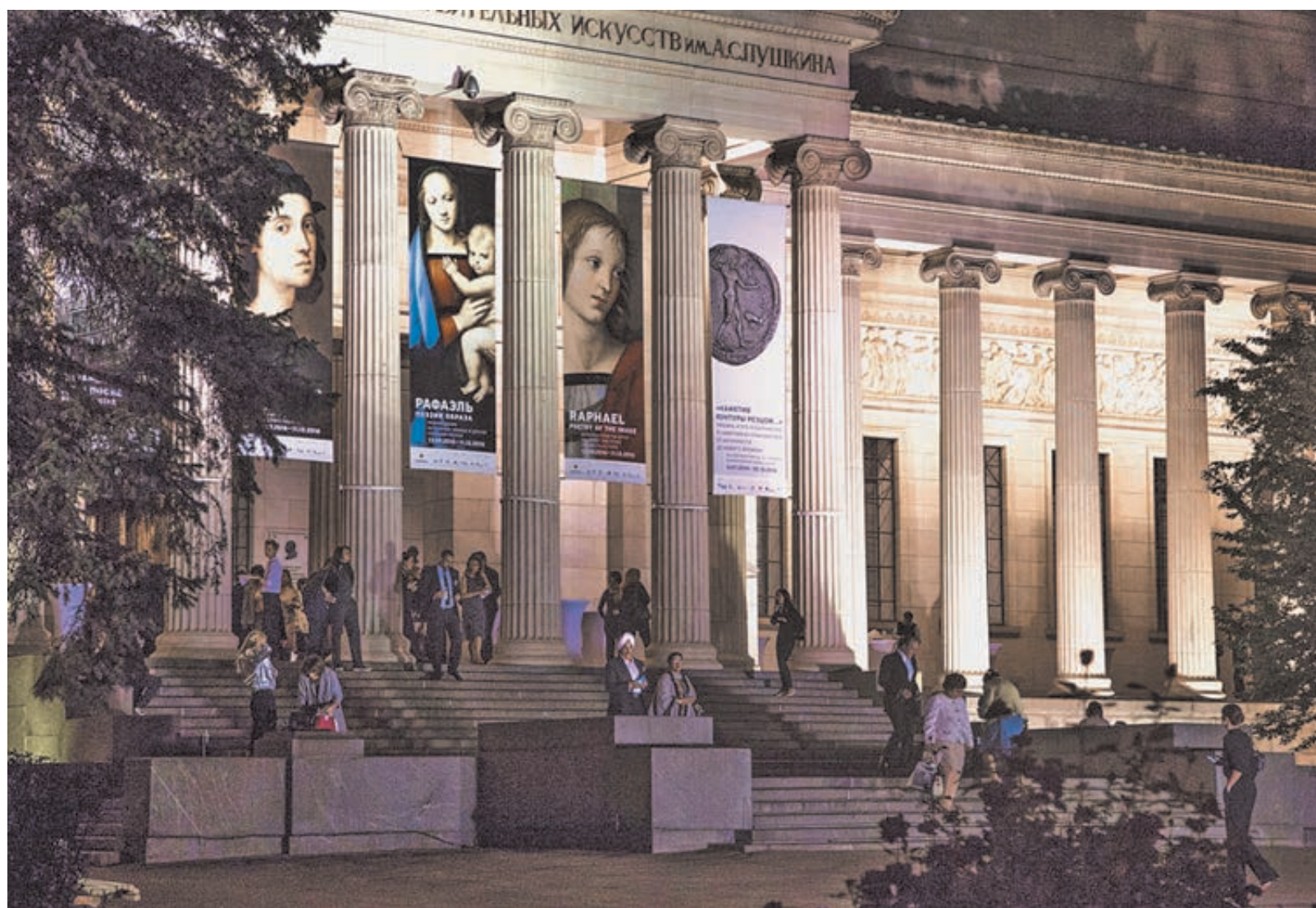
Двери в Музей изобразительных искусств имени Пушкина открыты до позднего вечера.

Об этом исчерпывающе заявил глава компании Игорь Сечин нынешним летом накануне Петербургского международного экономического форума в интервью итальянской Sole 24 Ore: «В 1960-е годы основатель и глава компании «Эни» Энрико Маттеи заключил с СССР долгосрочный контракт на поставку нефти, разрушив таким образом догматы холодной войны, которые в том числе предполагали экономическую изоляцию России, – напомнил итальянский читатель Игорь Сечин. – Отстаивая соглашение, подписанное им в Москве, Маттеи уверял тогда, что «оно не представляет опасности для Италии, зато обеспечивает страну нефтью, дает работу ита-