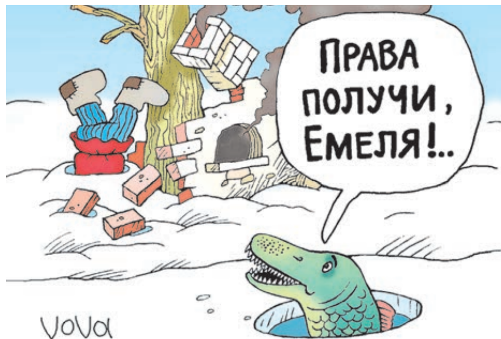
ИЛЛЮСТРАЦИЯ ВЛАДИМИРА ИВАНОВА/САНКТОВИАНК.РУ

С некоторых пор в ПДД введено понятие «затор»: водители не