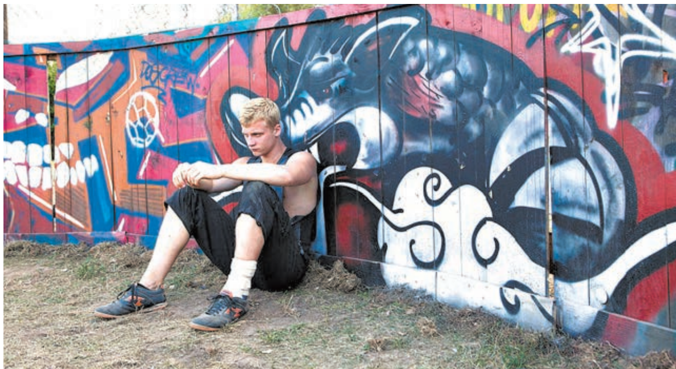
Кадр из фильма — победителя «Коробка».

Понять коллег из солидных медиа можно: масштаб события в Екатеринбурге и впрямь соответствовал самым высоким критериям и ожиданиям. Здесь в общей сложности было показано около сотни лент. Сюда приехал сонм звезд — от классиков российского кино Глеба Панфилова, Владимира Меньшова, Сергея Соловьева, Инны Чуриковой, Владимира Хотиненко, представивших свои новые работы, до мастеров среднего поколения в лице Михаила Ефремова, Николая Лебедева, Сергея