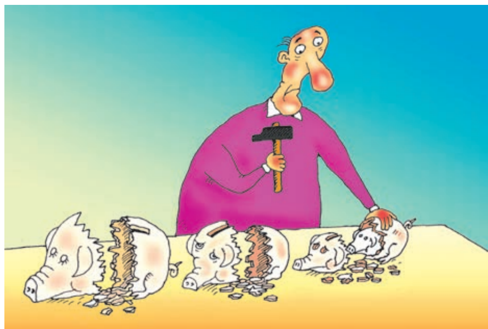
ИЛЛЮСТРАЦИЯ ВАЛЕРИЯ ТАРАСЕНКО / CARTOONBANK.RU

Но история не терпит слагательного наклонения, да и время