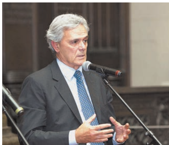
Посол Италии в РФ господин Чезаре Мария Рагальини.