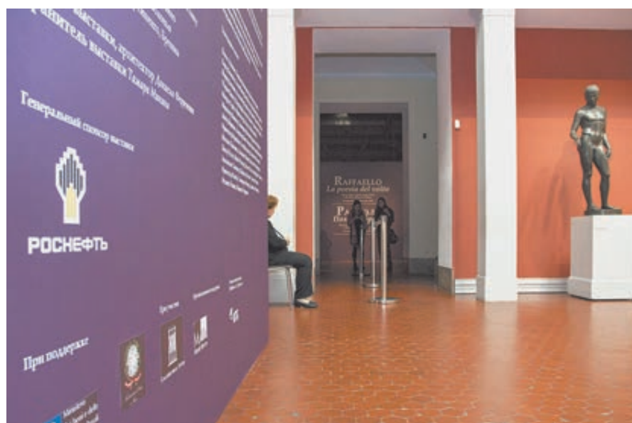
В ожидании первых посетителей.

льянцам» и что он искренне рад тому, что «волчица, вскормившая Ромула и Рема, наконец-то породнилась со знаменитым русским медведем». В результате именно благодаря российской нефтяной отрасли, энергомосту, созданному усилиями Маттеи и его советских партнеров, отношения между Россией и Италией на протяжении десятилетий имеют прочную основу.