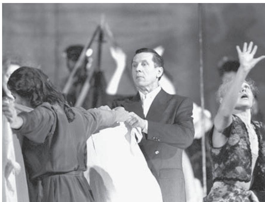
Спектакль «Живаго (доктор)», 1993 год.