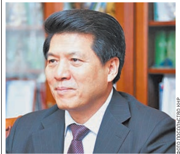
ФОТО ГОСПОДСТВО КНР