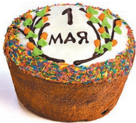
ИЛЛЮСТРАЦИЯ ВЛАДИМИРА ТРАПЕЗНИЧУ, САНКТ-ПЕТЕРБУРГ

Пасха в этом году совпала с Первомаем, что вызвало некоторое брожение в умах. Руководители сразу нескольких регионов страны объявили об отмене демонстраций трудящихся. То ли для того, чтобы не сталкивать лоб в лоб колонны православных граждан и воинствующих атеистов, то ли во избежание оскорбления чувств верующих неподобающими пролетарскими речевками. Ну а что же наше ТВ? Как оно совместит в эфире события, требующие разного тематического наполнения?