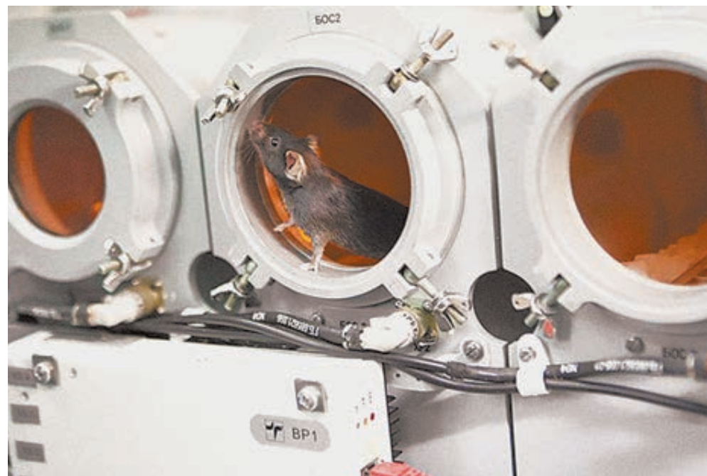
Вот они, мыши-космонавты.