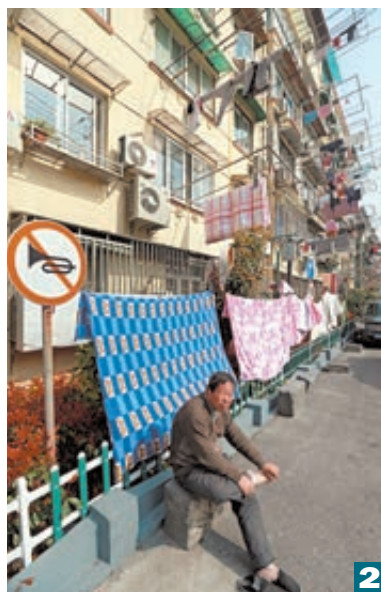
1 Ли Хуэй с Владимиром Путиным.

В-третьих, неуклонно возрастает вклад Китая в рост мировой экономики. Меры, которые Китай принял в ответ на глобальный финансовый кризис, имели положительный эффект не только для нашей экономики, но и для мировой экономики в целом. С начала этого кризиса Китай оперативно корректировал макроэкономическую политику, выработал комплексный план по расширению внутреннего спроса и стимулированию экономического роста. Все это дало заметный положительный эффект, Китай возложил процесс выхода из кризиса и постепенного восстановления мировой экономики. В 2007-м китайский вклад в мировой экономический рост впервые превысил вклад США. По этому показателю Китай вырвался на первое место в мире. Можно сказать, что Китай постоянно делится с миром своим позитивом и «китайской уверенностью» в борьбе с финансовым кризисом.