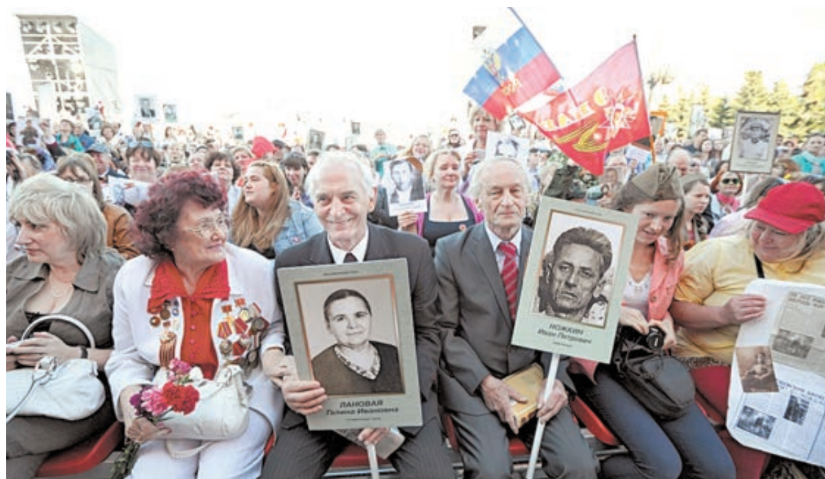
ФОТО – НОМЕРАНТЪ

– Но нашлись и малодушные, кричавшие, что все организовано и проплачено! – Им быстро пришлось замолчать. Есть ситуации, когда ложь невозможна, ибо бессмысленна. В прошлом году рядом со мной бабушка шла. Никакого плаката у нее не было – маленькая фотокартонка. Она не собиралась никуда, на кухне хлопотала, телевизор глядела – и увидела по «ящику», как люди собираются. Бросила стряпню, фотографию