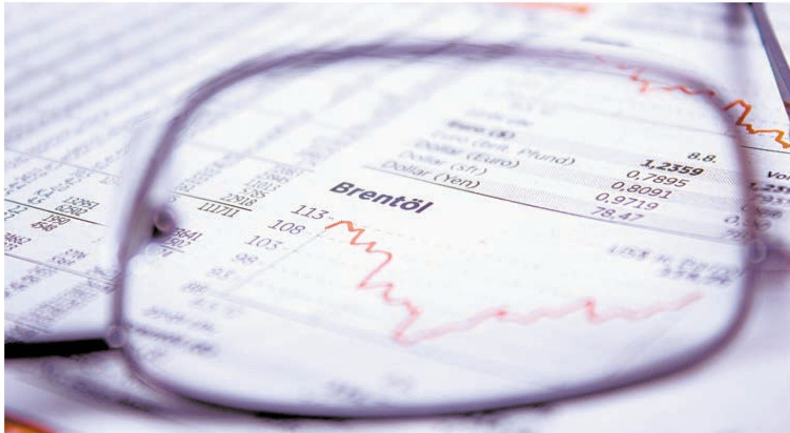
Волатильность нефтяного рынка не мешает «Роснефти» уверенно смотреть в будущее.

Эксперты справедливо называют «Роснефть» бюджетообразующей, ведь она традиционно выплачивает больше налогов и пошлин, чем другие госкомпании. За 2015 год сырьевые предприятия, естественные монополии, банковские структуры, инфраструктурные корпорации, частично или полностью принадлежащие государству, перечислили в бюджет в общей сложности 4280 млрд рублей, из которых 2306 млрд рублей (54%) приходится на «Роснефть».