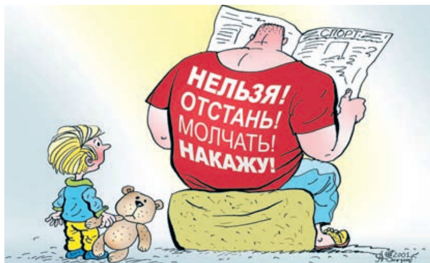
ИЛЛЮСТРАЦИЯ АЛЕНА-НРА СЕРГЕЕВА / CARTOONBANK.RU