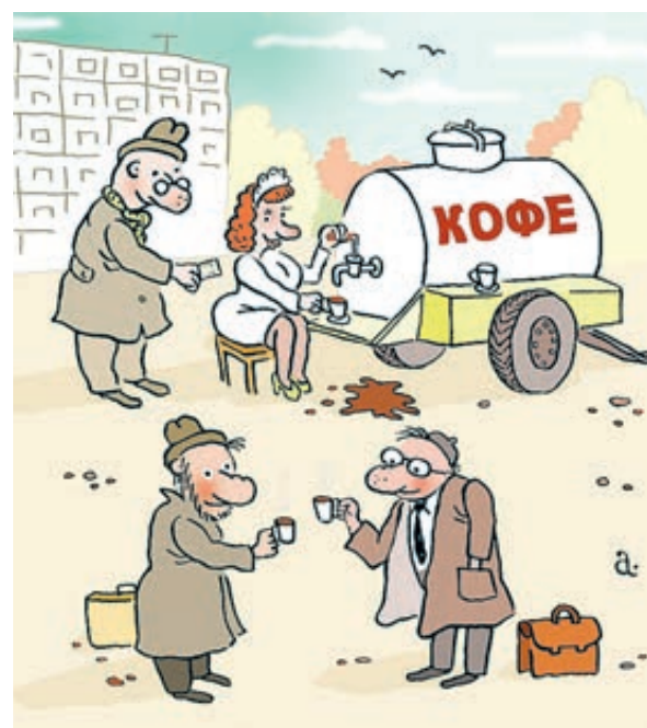
ИЛЛЮСТРАЦИЯ ВАСИЛИЯ АЛЕКСАНДРОВИЧА / CARTOONVALENTIN.RU

Да, реальные доходы населения сокращаются уже четвертый год. Но не менее весомый вклад в сокращение числа клиентов внес запрет на курение в ресторанах и кафе. Эксперты говорили, что эффект будет временным,