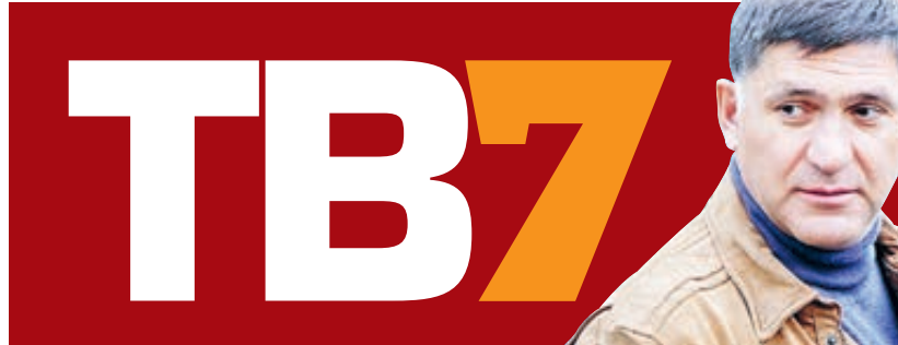
Сергей Пускепалис в роли полицейского, который решил, чтобы найти денег на лечение сына, обратиться к тем, кого по долгу службы преследовал, в сериале «Большие деньги» Пн-Вт, 21.30, «Первый»