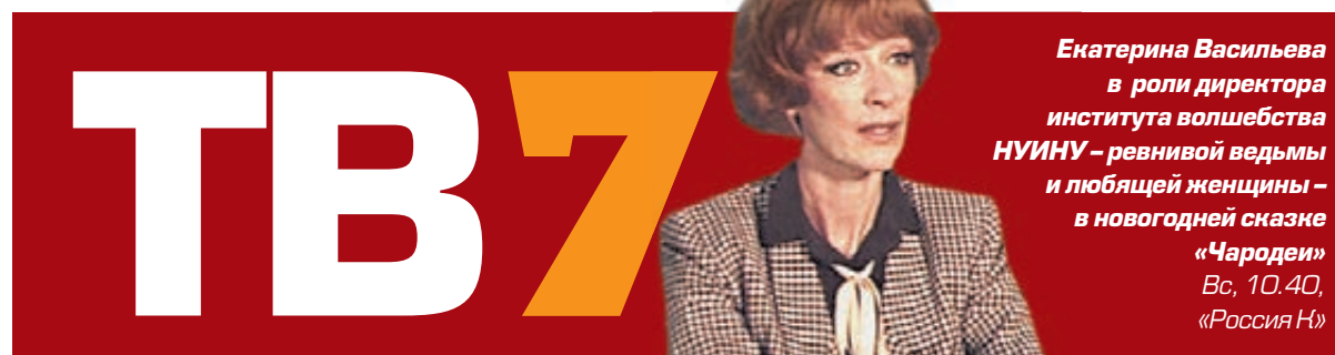
Екатерина Васильева в роли директора института волшебства НУИНУ – ревнивой ведьмы и любящей женщины – в новогодней сказке «Чародей» Вс, 10.40, «Россия Н»