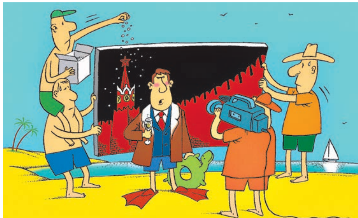
ИЛЛЮСТРАЦИЯ АНЖЕЛИНЫ СМАЙЛ / CARTOONBANK.RU

С одной стороны, и правда, ни жестокости, ни разнузданности. Но вы бы хотели, чтобы перед поздравлением главы государства вас развлекали всем вышеперечисленным? Заметьте, даже ни одной знаменитой гайдаевской комедии в эфире, а ведь они уже сняты! Впрочем, в те давние времена послед-