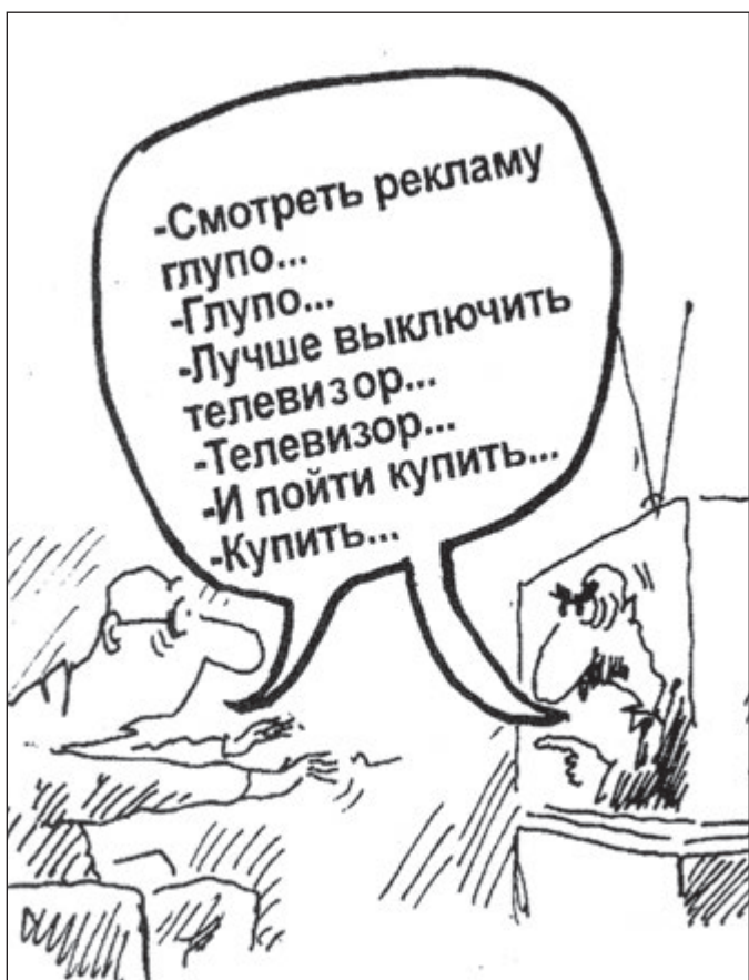
РИСОВАЛ: АЛЕКСАНДР СЕРГЕЕВИЧ САНТОНОВ

Уже давно ходят разговоры об отмене закона, запрещающего рекламу в детских телепередачах. Они начались давно, еще до падения курса рубля и стоимости барреля нефти. Ряду депутатов стало понятно, что благими намерениями и нравственным воспитанием подрастающего по-