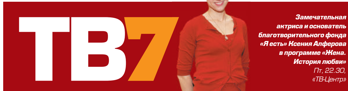
Замечательная актриса и основатель благотворительного фонда «Я есть» Нсеня Алферова в программе «Жена. История любви» Пт, 22.30, «ТВ-Центр»