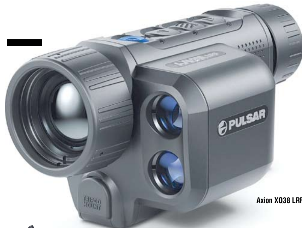
Axion XQ38 LRF

Yukon Advanced Optics — ведущий мировой разработчик и производитель тепловизионной техники и приборов ночного видения для профессионалов и любителей активного отдыха — выпустил уникальный и единственный в своем роде на рынке РФ тепломонокюляр с лазерным дальномером.