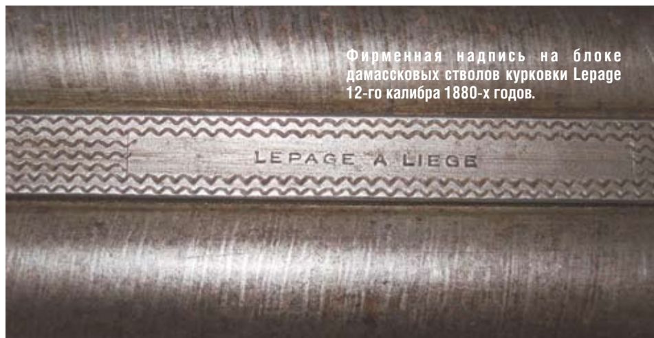
Фирменная надпись на блоке дамасковых стволов курковки Lepage 12-го калибра 1880-х годов.