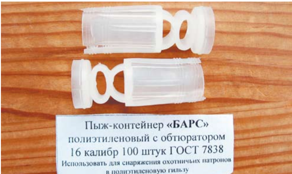
Пыж-контейнер «БАРС» полиэтиленовый с обтюратором 16 калибр 100 штук ГОСТ 7838 Использовать для снаряжения охотничьих патронов в полиэтиленовую гильзу