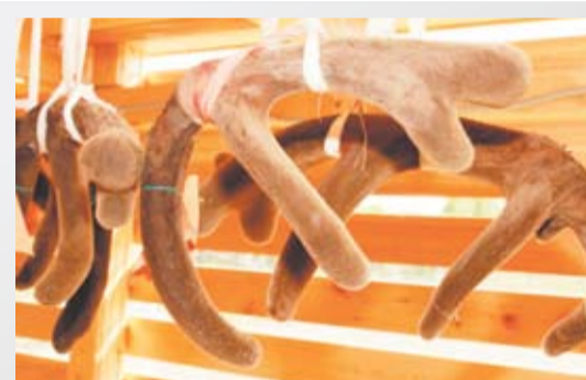
СИЛА В РОГАХ 15 стр.