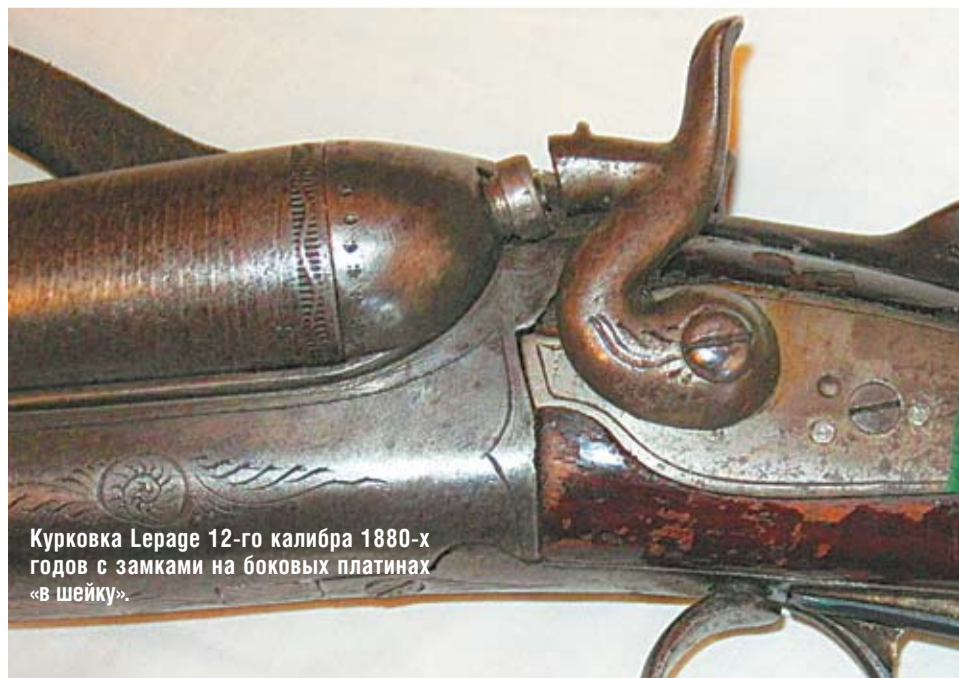
Курковка Lepage 12-го калибра 1880-х годов с замками на боковых пластинах «в шейку».

Весьма приятно, что у курковки Lepage 12-го калибра 1880-х годов дамасковые стволы внешне сохранились очень неплохо для своего почти 130-летнего возраста, ржавчины нет. Стволы в блок спаяны по длине, к ним припаяны и вкладыш с двумя подствольными крюками, это типичная технология производства блоков дамасковых стволов последней четверти XIX века. Левый ствол с дульным сужением, на нем пробито клеймо Choqe и указан размер — 17,4 мм, то есть левое дульное сужение равно