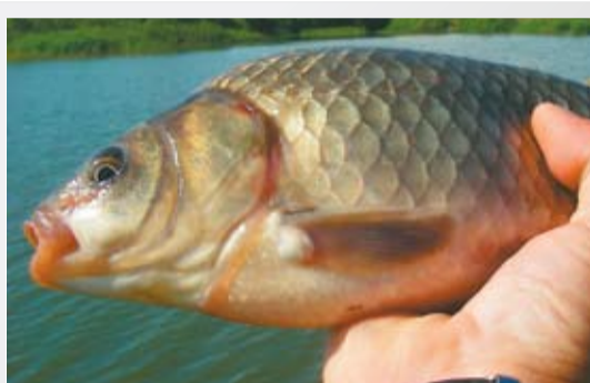
КАРАСЬ В ЖАРУ 9 стр.