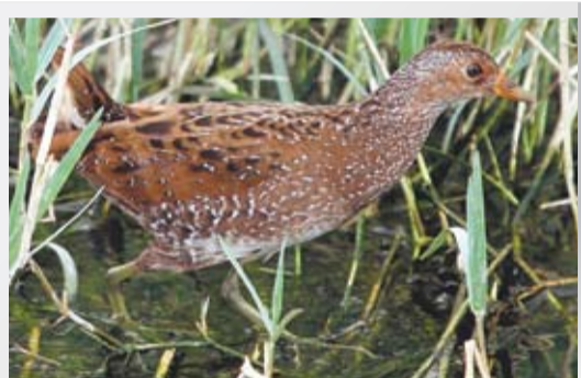
ПОГОНЫШ МОЕГО ДЕТСТВА 5 стр.