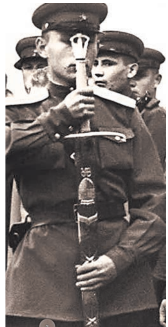
Именно этот меч — знак восхищения мужеством защитников Сталинграда — Черчилль преподнес Сталину на Тегеранской конференции.

...Бесконечные кадры кинохроники, бесценные фотодокументы. Многотысячные колонны плененных немцев, потомки которых сейчас безумно поставляют все новое оружие на войну, которая после мая 45-го никогда не должна была повториться, бредут за линию горизонта.