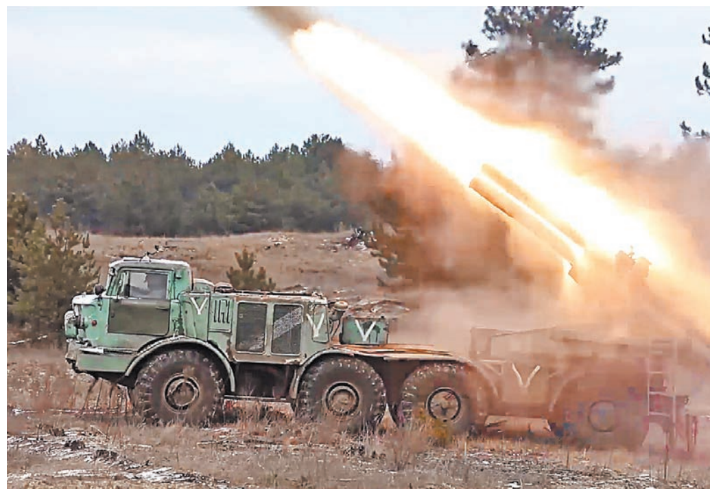
Реактивная система залпового огня «Ураган» имеет 16 направляющих и бьет по противнику 270-кг снарядами.