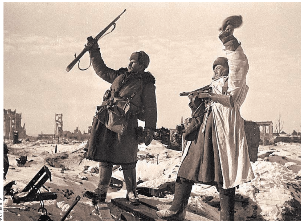
Город свободен! Битва за него длилась 200 дней.