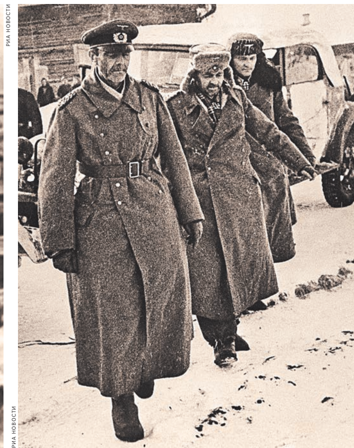
Генерал-фельдмаршал Паулюс и члены его штаба, сдавшиеся в плен.