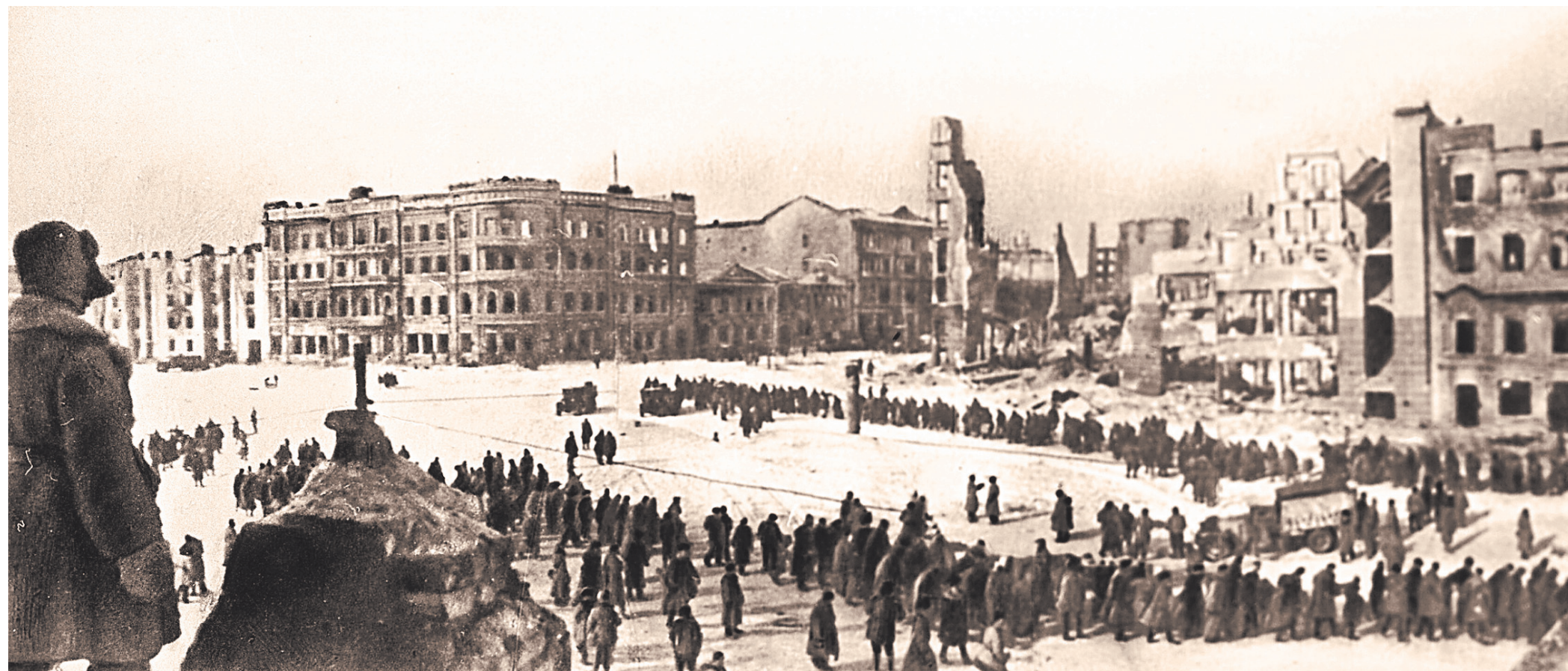
Пленные гитлеровцы на улицах Сталинграда.