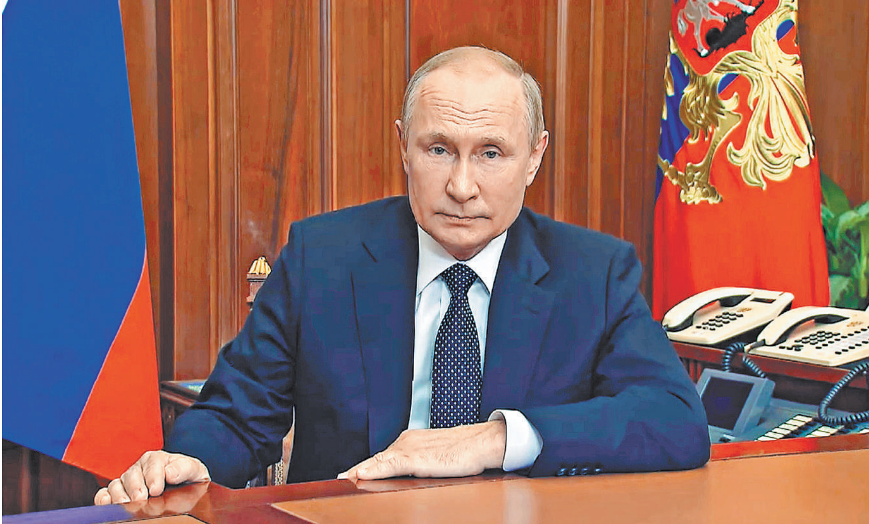
Владимир Путин. При угрозе территориальной целостности нашей страны, для защиты России и нашего народа мы используем все имеющиеся в нашем распоряжении средства. Это не блеф.

И такие планы они вынашивают давно. Они поощряли бан-