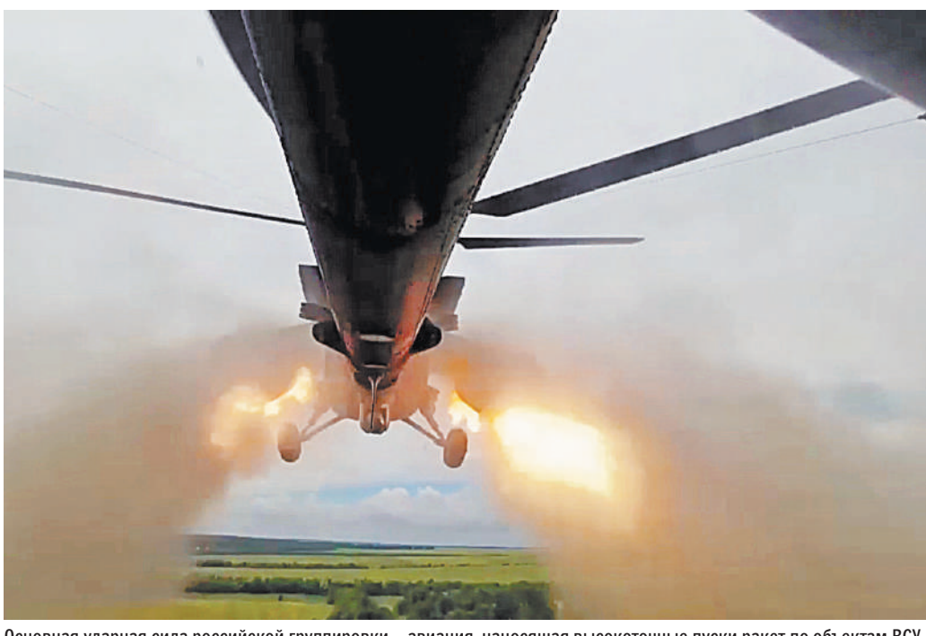
Основная ударная сила российской группировки — авиация, наносящая высокоточные пуски ракет по объектам ВСУ.

СЕРГЕЙ ШОЙГУ: На самом деле, идет большая, трудная боевая работа, которую выполняют с честью наши военнослужащие, Луганской, Донецкой народных республик и другие подразделения и добровольцы, которые участвуют в этой операции. Освобождена Луганская Народная Республика,