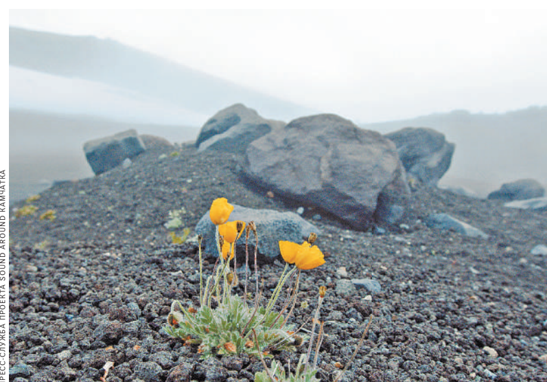
Горы Камчатки впечатляют и весной, и осенью.