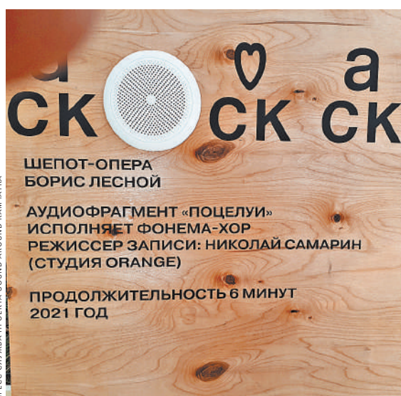
Вот такая «Звуколавка» — с «Шепот-оперой» в парке.