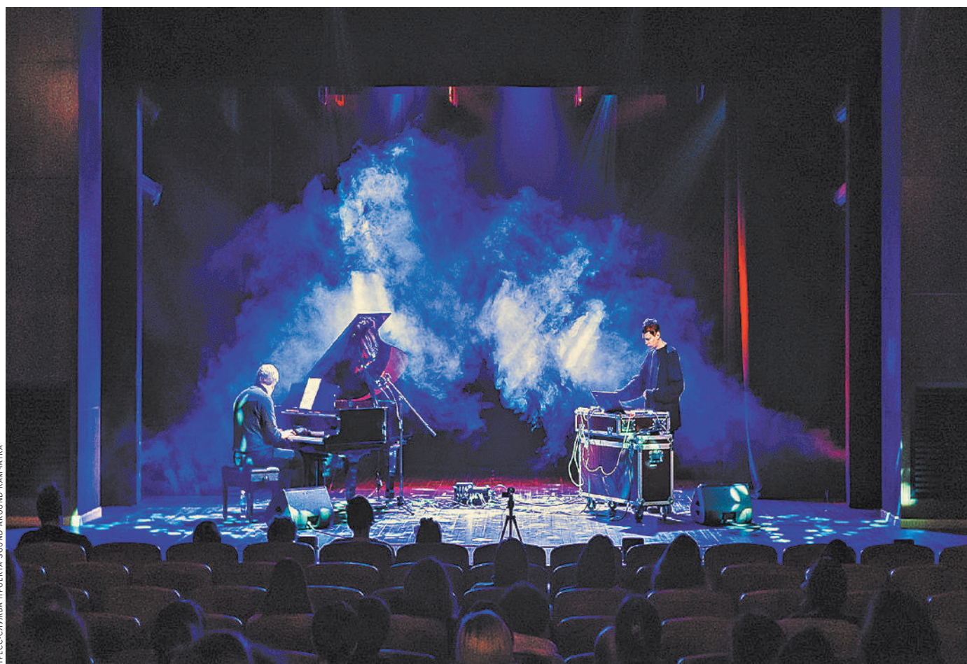
Концерт электронной музыки «Синтезированные ландшафты» обещают в зале филармонии «Октябрьский» 24 сентября.