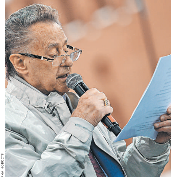
Основателем конкурса был поэт Андрей Дементьев.

В честь Всемирного дня поэзии в Твери прошли литературные консультации, где осваивающие поэтическое мастерство авторы смогли получить профессиональные советы. Все выходные в Доме поэзии работал открытый микрофон. ●