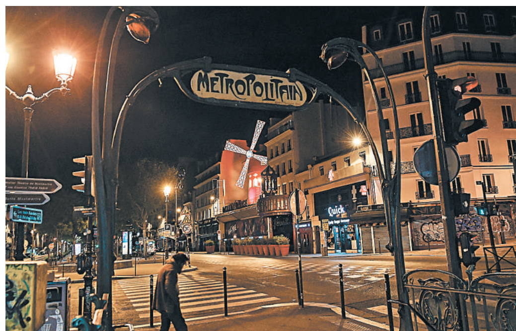
В прошлом сверкавшие разноцветными огнями в окружении толп посетителей парижское кабаре «Мулен Руж» сегодня безнадежно пустует.