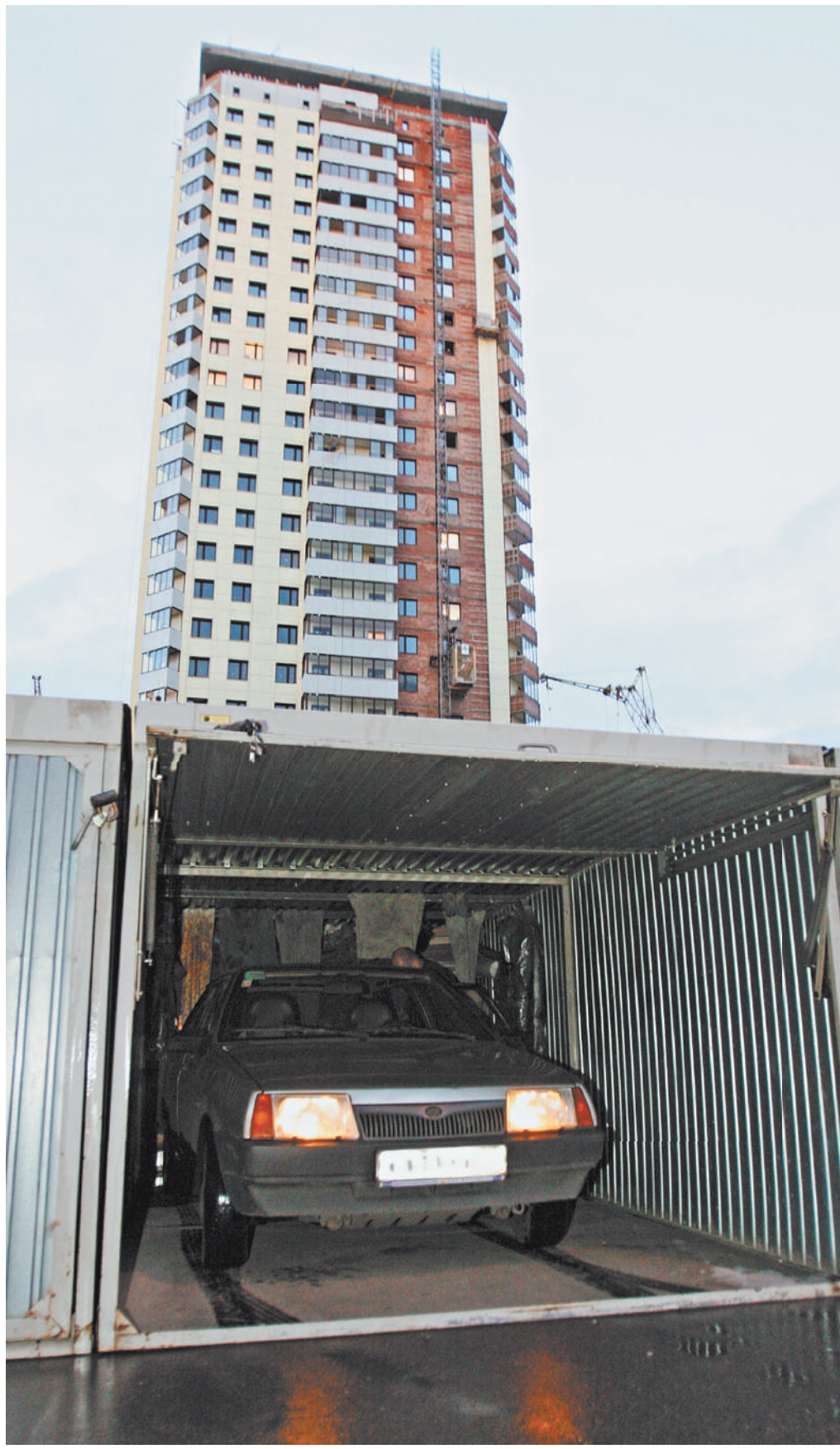
Оформить в собственность можно будет любые гаражи и землю под ними. За исключением «ракушек».

Во втором чтении мы расширили «гаражную амнистию» не только на капитальные гаражи, но и на некапитальные металлические сооружения, которые возведены также до 30 декабря 2004 года. Но при условии, что земля была выделена гаражному или гаражно-строительному кооперативу именно под строительство гаражей и находится у ГСК в бессрочном пользовании, либо если право бессрочного пользования переформировано в действующую аренду. При этом речь не идет о так называемых «ракушках».