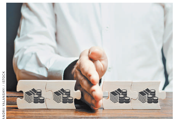
Общий долг по кредиту, взятому супругами сообща, погашать после развода надо строго поровну.

На самом деле, подобные споры о разделе взятых на семейные нужды денег, в последние годы перестали быть в наших судах редкостью. Ведь та же статистика приводит две цифры — с одной стороны распадается чуть ли не каждый второй брак.