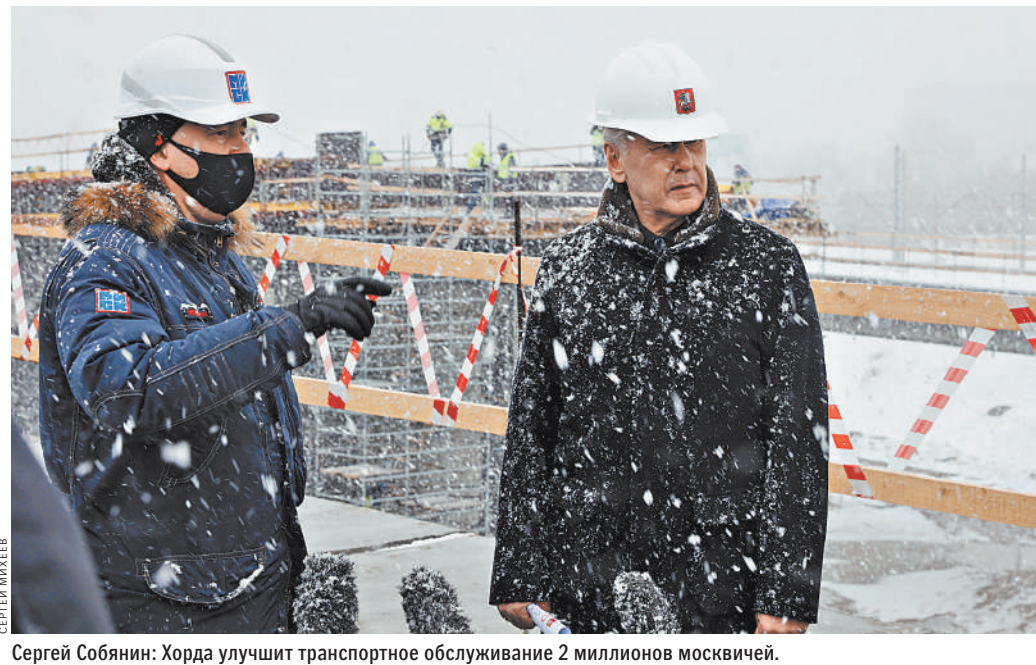
Сергей Собянин: Хорда улучшит транспортное обслуживание 2 миллионов москвичей.