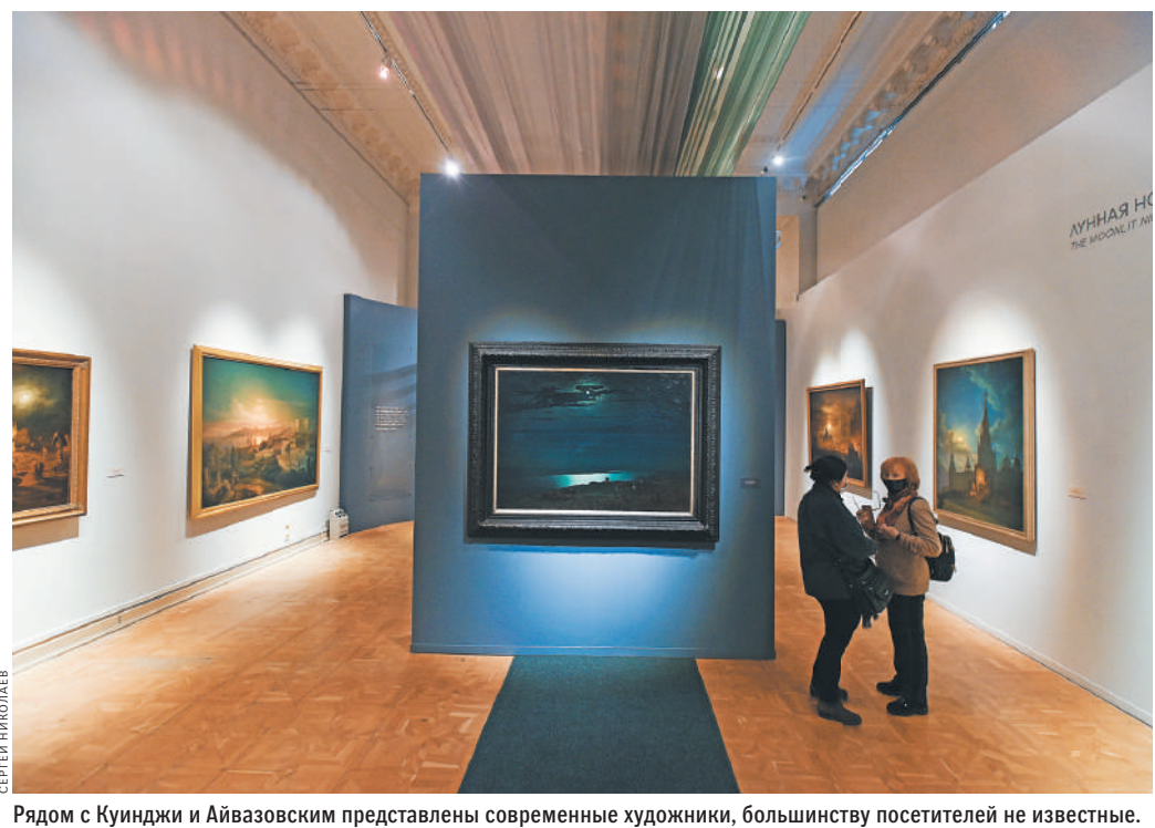
Рядом с Куинджи и Айвазовским представлены современные художники, большинству посетителей не известные.

— О других выставках читайте на сайте rg.ru/sujete/5330