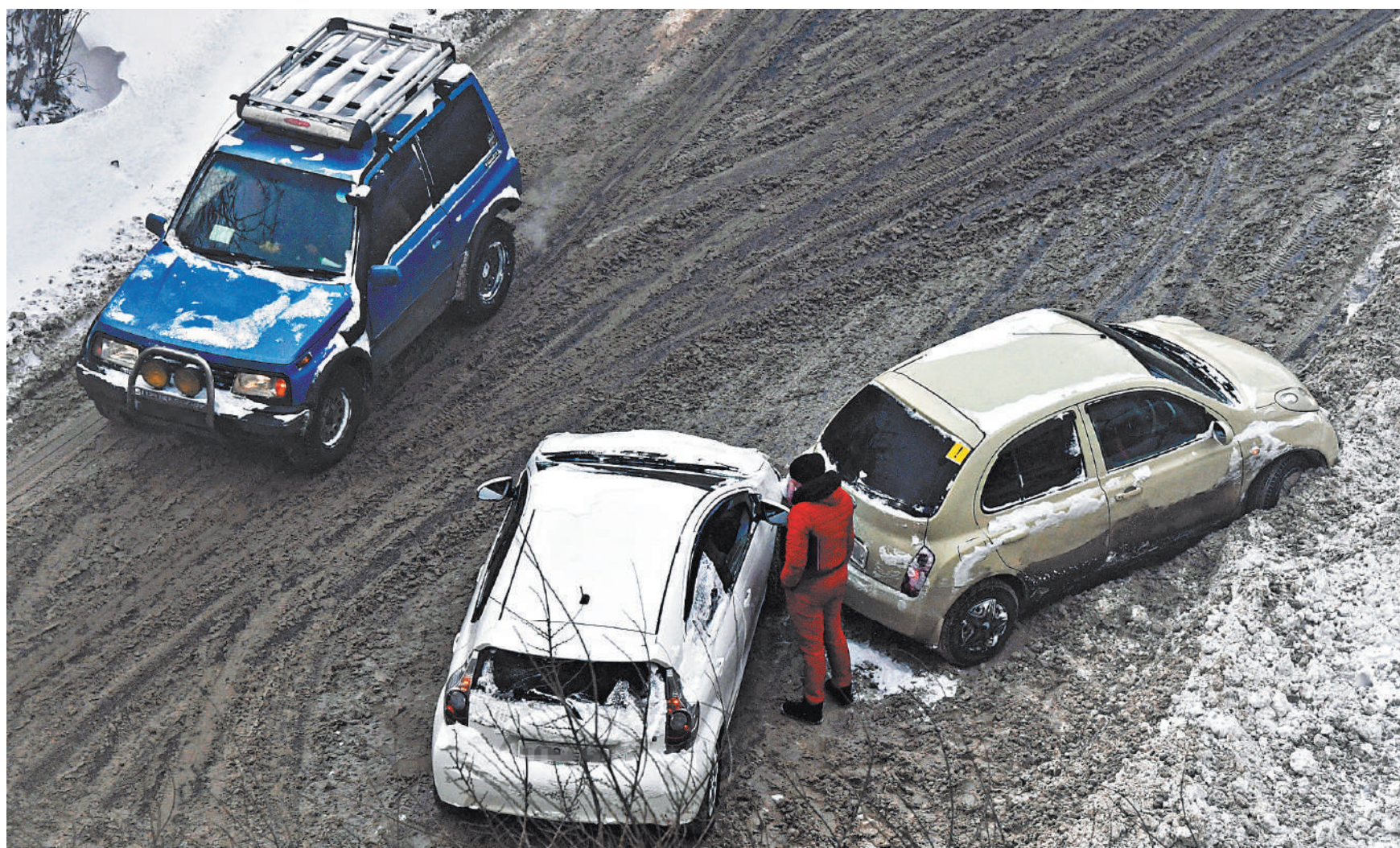
Даже мелкая авария может обернуться потерей машины, если владелец не вник в страховой договор.

1 ← Но сам факт составления заявления о выплате при заключении договора выглядит по меньшей мере странно.