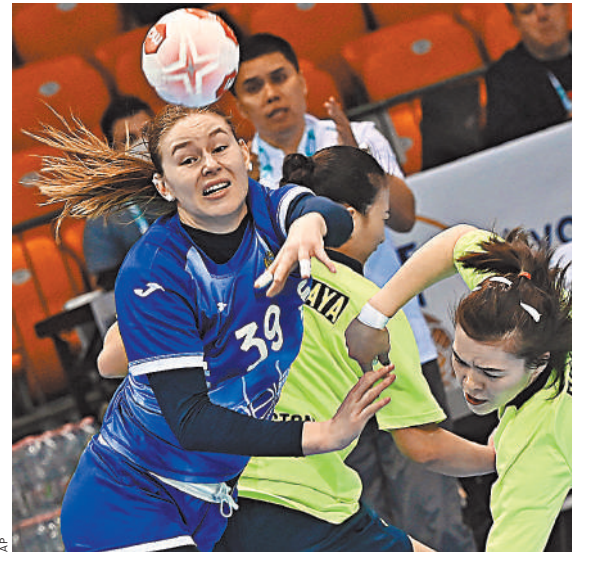
Российским гандболисткам (в темном) пришлось попотеть, чтобы заполучить олимпийскую путевку в Токио.