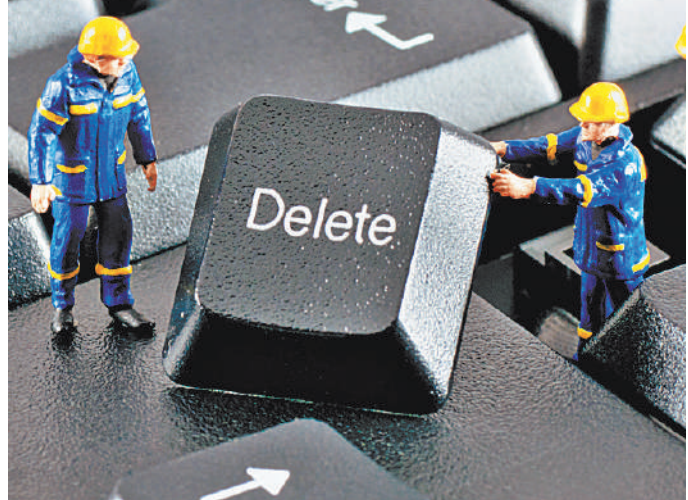
По результатам проверки прокуратуры составляется заключение о наличии оснований для принятия мер по удалению недостоверной информации.