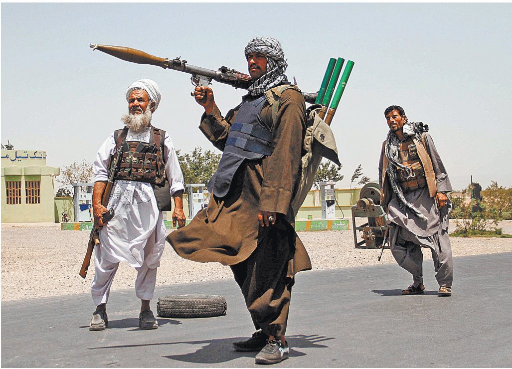
Талибы заявили, что ждут передачи власти напрямую, без переходного правительства.

Но талибы заявили, что переходного правительства в Афганистане не будет, они ждут передачи власти напрямую. Агентство Associated Press со ссылкой на представителя движения сообщило, что талибы вскоре провозгласят о создании Исламского эмирата Афганистан из президентского дворца в Кабуле.