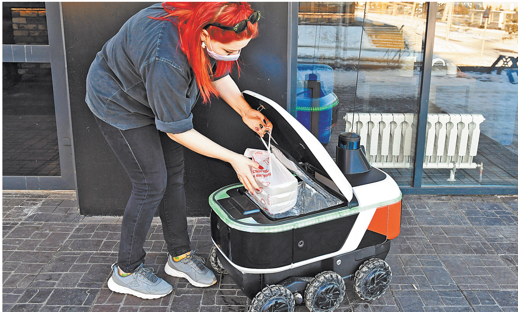
Пока робот-курьер не научился доставлять еду к порогу квартиры, бывает, сбивается с заданного маршрута и даже может «сойти с ума» — разрядиться или сойти с дистанции.