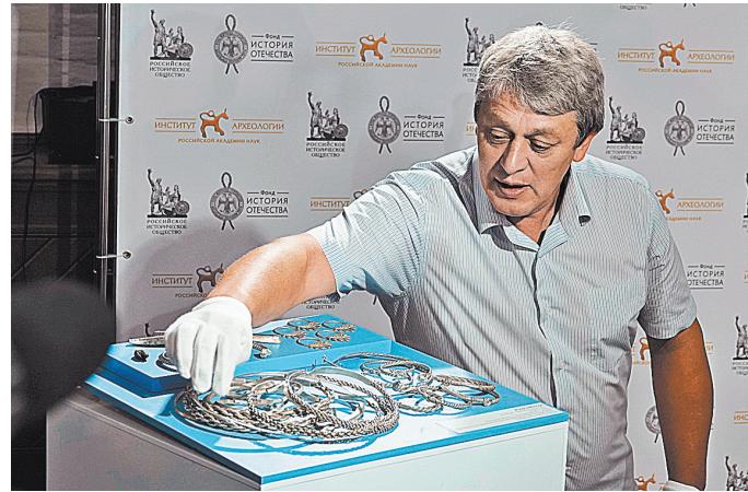
Исадский клад будет передан в Рязанский историко-архитектурный музей-заповедник

— Находка приоткрывает завесу над «финской предисторией» Суздаля, — убежден научный сотрудник Института археологии РАН Александр Морозов.