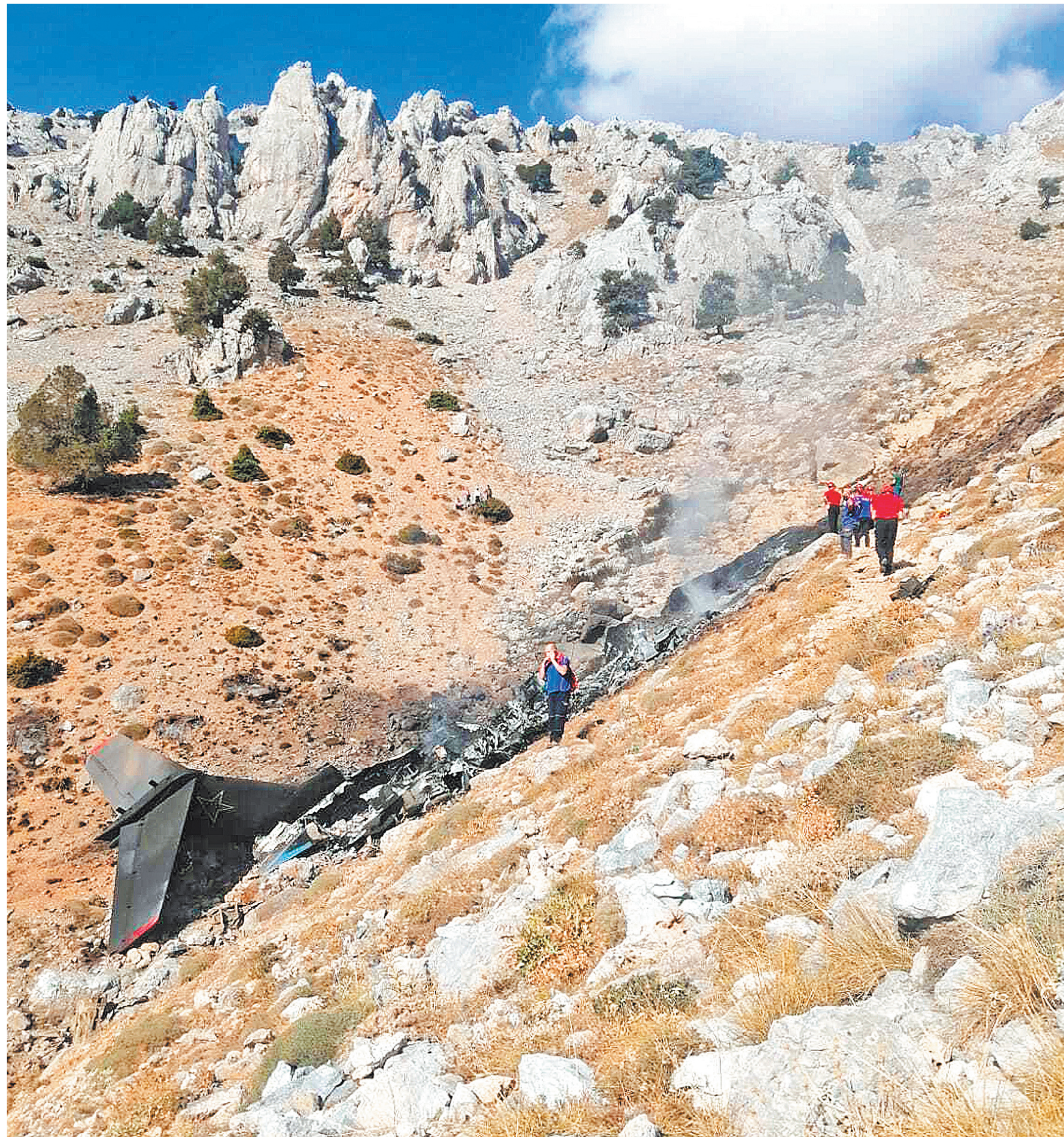
Самолет-амфибия Бе-200 Минобороны России потерпел крушение при заходе на посадку — машина не смогла набрать нужную высоту после сброса воды на очаг пожара и врезалась в скалы.