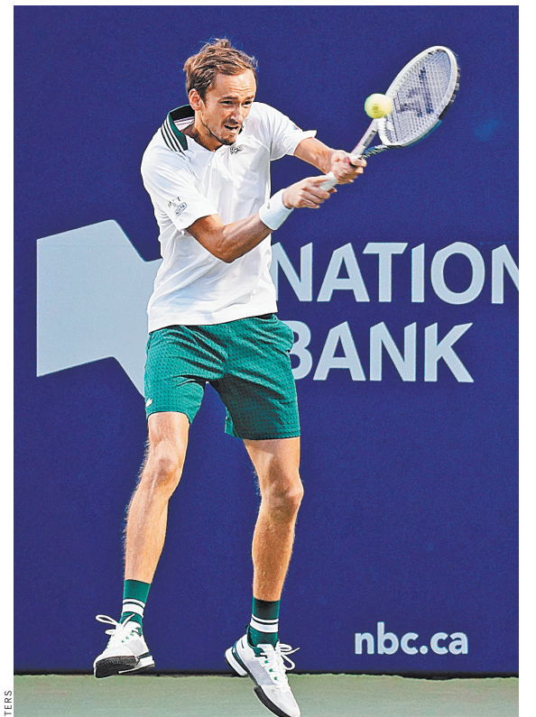
Неудача на Олимпиаде в Токио разозлила Даниила Медведева. Победа в Торонто помогла бы вернуть уверенность.

На счету Медведева 11 титулов в одиночном разряде, в том числе на трех «Мастерсах» — в Париже, Шанхае и Цициннати, а также на Итоговом чемпионате АТР.