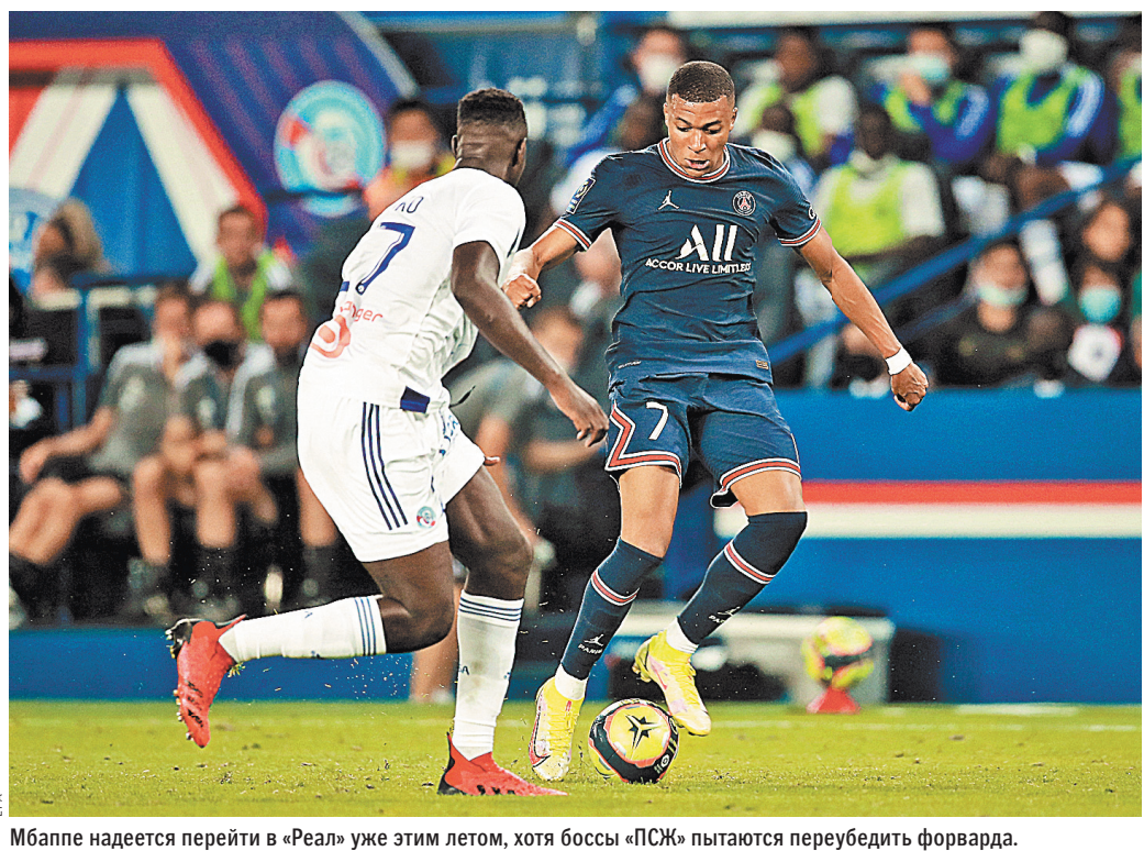
Мбаппе надеется перейти в «Реал» уже этим летом, хотя боссы «ПСЖ» пытаются переубедить форварда.

Победу на выходных одержала также «Валенсия», за которую выступает Денис Черышев. «Летучие мыши» одолели дома «Хетафе» со счетом 1:0 — с пенальти, заработанного Черышевым, отличился Карлос Солер.